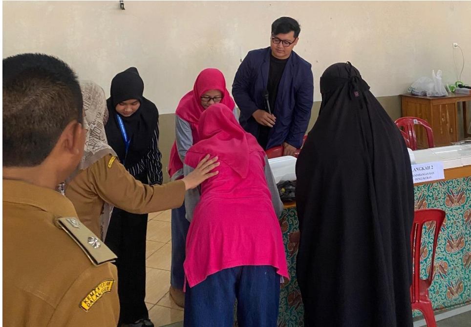
Gambar 5.4 Kegiatan Posyandu