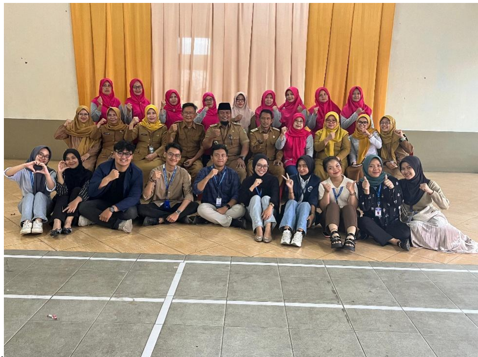
Gambar 5.3 Kegiatan Posyandu

Praktikan turut berkontribusi dalam kegiatan ini dengan membantu para ibu-ibu PKK dalam berbagai tugas, seperti menimbang, mencatat hasil timbangan, mengukur lingkar pinggang dan tinggi badan peserta, serta mencatat hasil pengukuran tekanan darah. Dengan adanya keterlibatan praktikan, kegiatan Posyandu dan Posbindu ini dapat berjalan lebih lancar, dan praktikan memperoleh pengalaman langsung dalam pelayanan kesehatan masyarakat. Kegiatan ini juga memperkuat kerjasama antara pihak desa, masyarakat, dan praktikan dalam upaya meningkatkan kesejahteraan kesehatan masyarakat Desa Babatan.