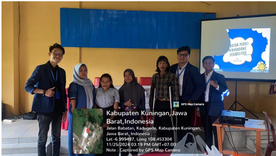
Gambar 4.3. Penyuluhan Sosial Penyandang Disabilitas