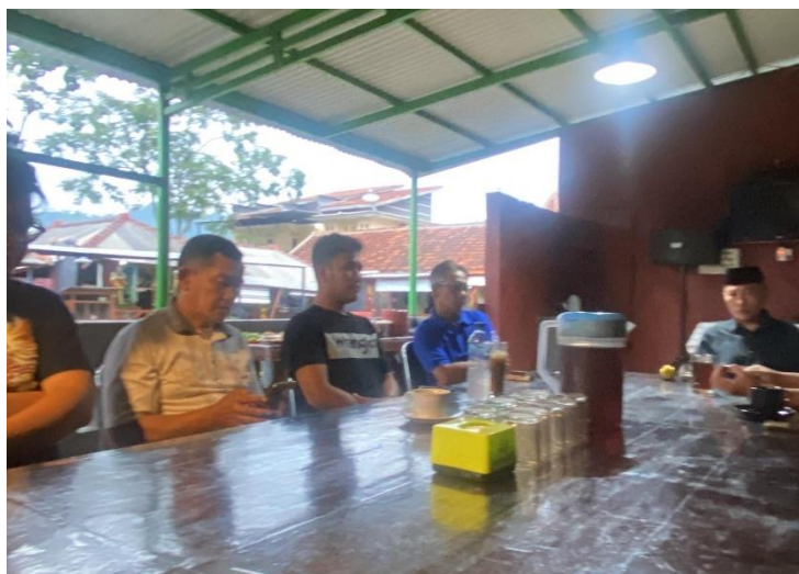
Gambar 4. 2. Membuat Capacity Building di rumah makan Cimuncang