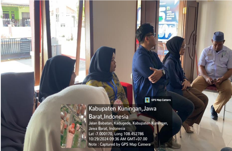
Lampiran 4. Foto Bersama Setelah MPA Selesai