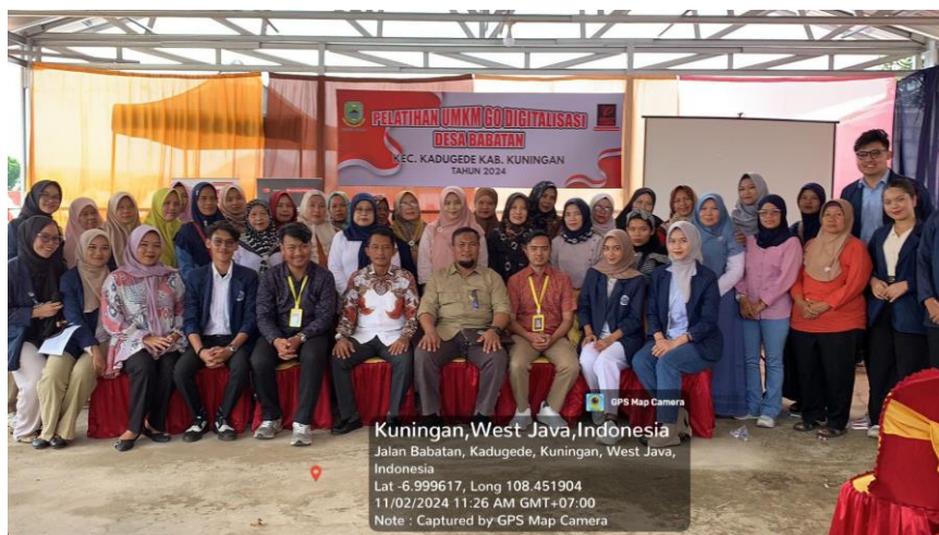
Gambar 5.2 UMKM