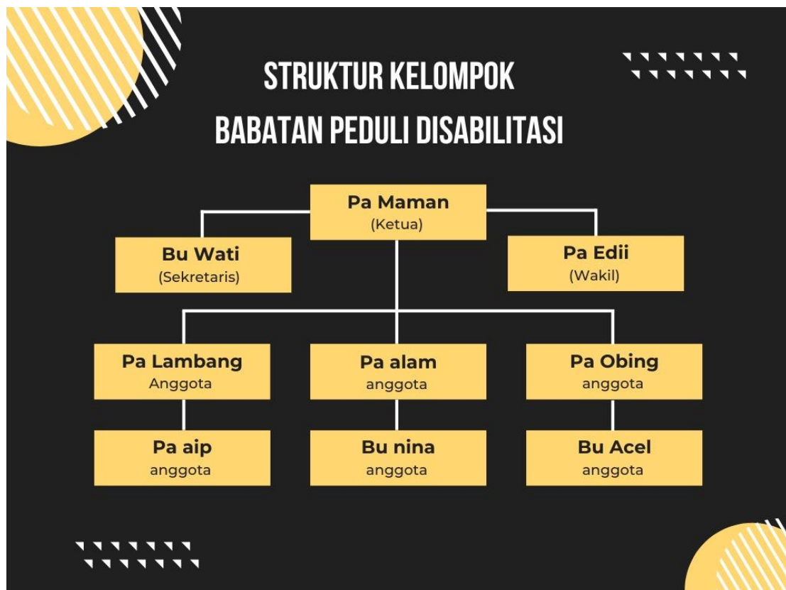
Gambar 4.4. Struktur Kepengurusan

Terbentuknya struktur kepengurusan TKM untuk Program Kelompok Masyarakat Peduli Penyandang Disabilitas, dengan susunan sebagai berikut: