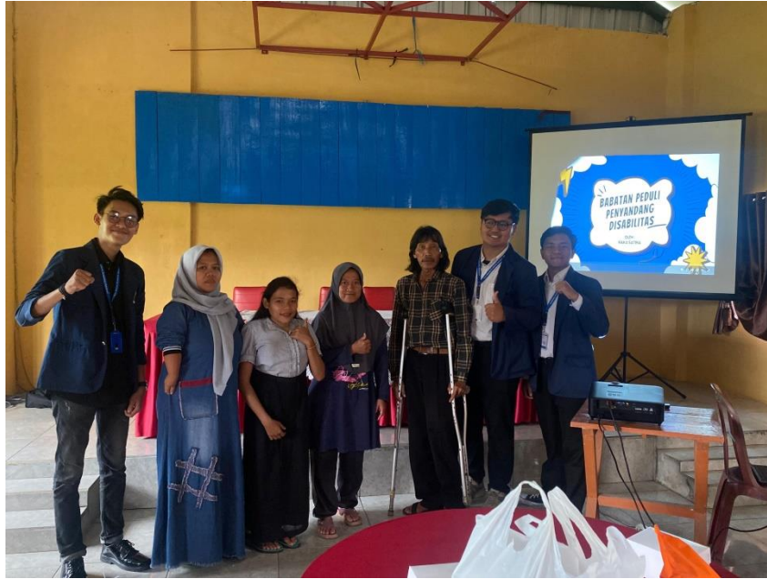
Lampiran 12. Kegiatan Loka karya Desa