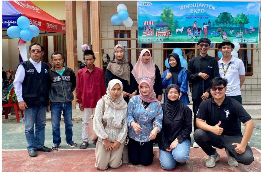
Gambar 4.1. Pendampingan Mengikuti Program Hari Disabilitas Internasional