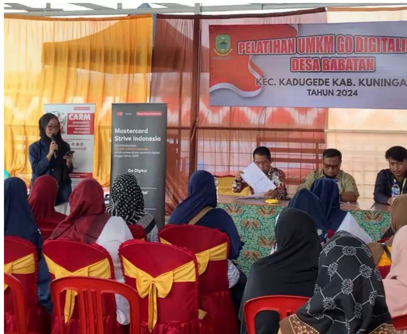
Gambar 5.1 UMKM (Mercy Corps Indonesia)

acara berjalan lancar dan memberikan dukungan penuh kepada peserta selama kegiatan berlangsung. Keikutsertaan praktikan dalam kegiatan ini memberikan pengalaman berharga dalam manajemen acara dan pengembangan UMKM berbasis digital.