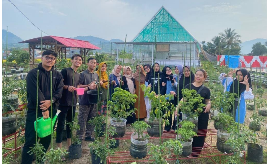
Gambar 5.4 Siram Kebun