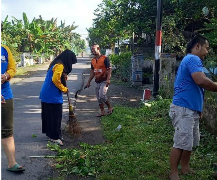
Gambar 5.3 Kerja Bakti