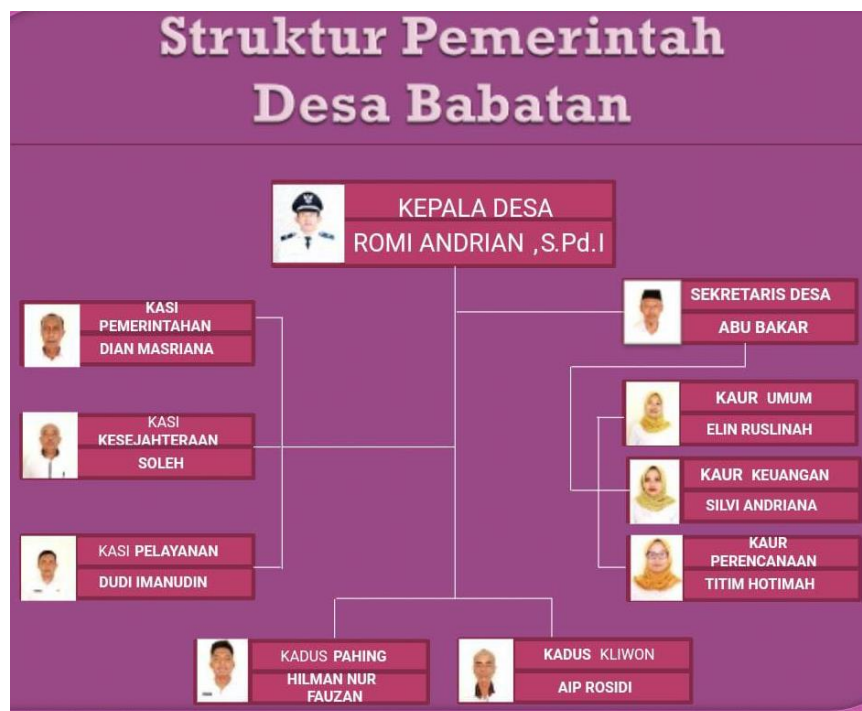
Gambar 3.1. Struktur Pemerintahan Desa Babatan