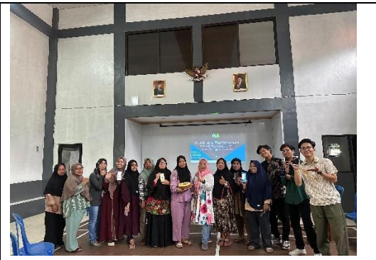
Pembuatan Olahan Makanan