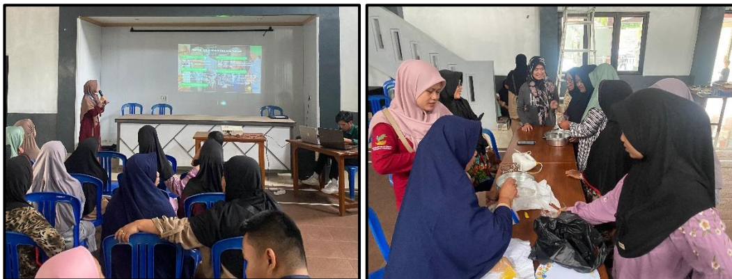
Foto 4. 10 Pelaksanaan Program Pepeling ( Pemberdayaan Perempuan Gunungkeling )ship