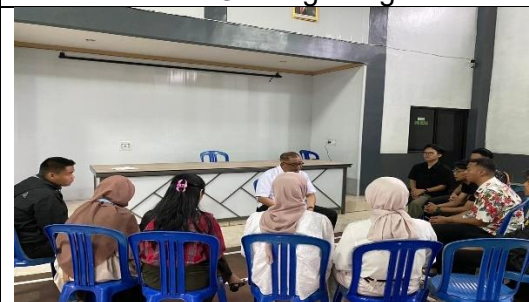
Supervisi bersama Dosen Supervisor