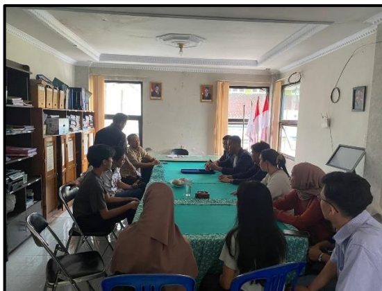
Foto 4. 11 Terminasi Praktikan