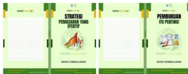
Modul Pemasaran Produk "Strategi Pemasaran yang Efektif"