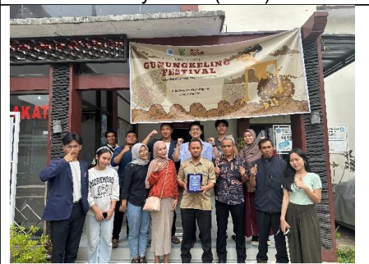
Terminasi dengan Perangkat Desa Gunungkeling