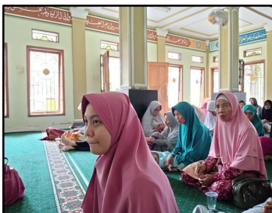
Foto 4. 5 Pengajian Ibu-Ibu Lansia Desa Gunungkeling

Pada tanggal 1 November 2024, praktikan diajak oleh Ibu Kepala Desa untuk mengikuti kegiatan pengajian lansia yang diadakan setiap Hari Jumat. Pada kegiatan tersebut praktikan mengenalkan diri, menyampaikan maksud dan tujuan praktikum serta berbaur dengan masyarakat Desa Gunungkeling. Praktikan disambut baik dan mendapat dukungan dalam pelaksanaan praktikum komunitas.