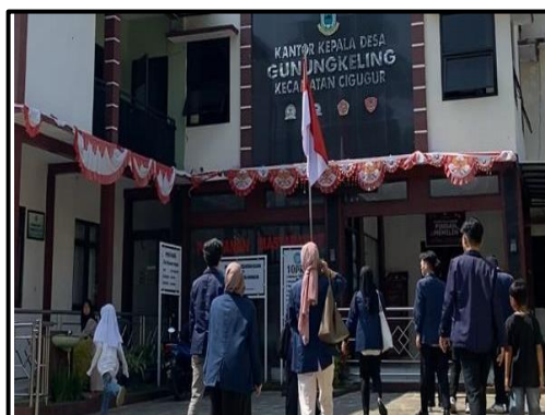
Foto 4. 2 Penerimaan di Kantor Desa Gunungkeling

Penerimaan selanjutnya dilakukan di Kantor Desa Gunungkeling yang dilakukan pada hari Selasa, 29 Oktober 2024, kegiatan ini bertujuan untuk mengetahui informasi awal mengenai desa seperti profil desa, peta wilayah,