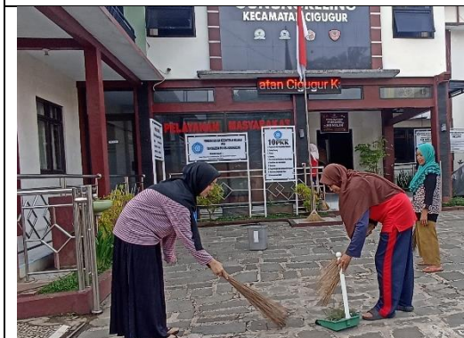
Kegiatan Jumat Bersih