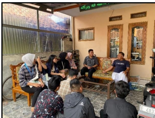
Foto 4. 3 Home Visit ke Rumah Ketua RW 2

1) Kunjungan Tokoh Masyarakat ( home visit )