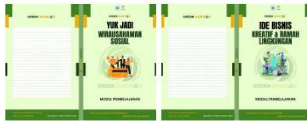
Modul Motivasi Membuka Usaha Sosial "Yuk Jadi Wirausahawan Sosial"