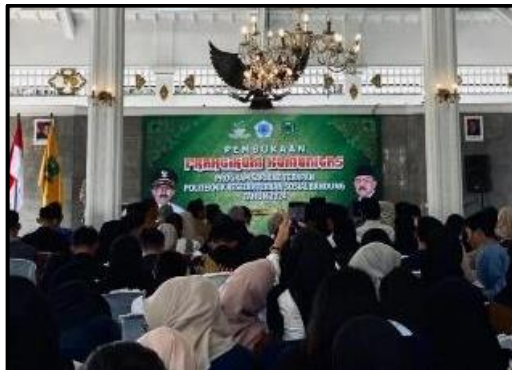
Foto 4. 1 Penerimaan Praktikan di Kantor Bupati Kuningan

Penerimaan praktikan Poltekesos Bandung yang akan melakukan kegiatan praktikum komunitas di Pendopo Kabupaten Kuningan oleh PJ Bupati Kuningan. Kemudian, penerimaan praktikan dilakukan di Kecamatan Cigugur yang dihadiri oleh perwakilan dari pihak 6 (enam) desa antara lain: Kelurahan Cigugur, Desa Sukamulya, Kelurahan Cigadung, Kelurahan Cipari, Desa Winduherang, Desa Gunungkeling, Desa Cisantana, Desa Cileuley, Desa Babakanmulya, Desa Puncak. Pada kegiatan penerimaan ini praktikan menyampaikan maksud dan tujuan pelaksanaan praktikum komunitas yang akan dilaksanakan selama 40 hari di lokasi masing-masing.