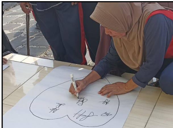
Foto 4. 9 Janji Hati

diawal dan siap untuk memberdayakan Perempuan Rawan Sosial Ekonomi (PRSE) di Desa Gunungkeling.