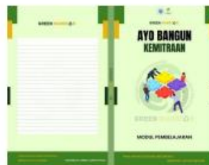
Modul Kerjasama "Ayo Banyun Kemitraan"