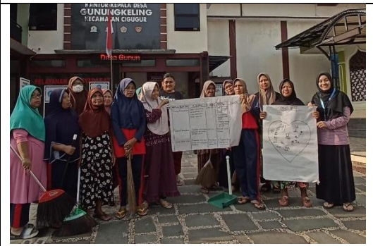
TOP bersama sasaran dan TIM Kerja Masyarakat (TKM)