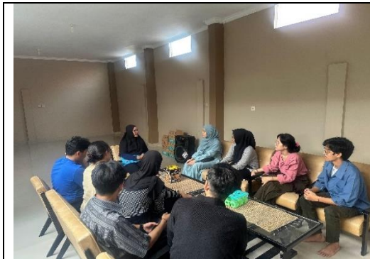
Homevisit ke Rumah Ibu Ketua PKK