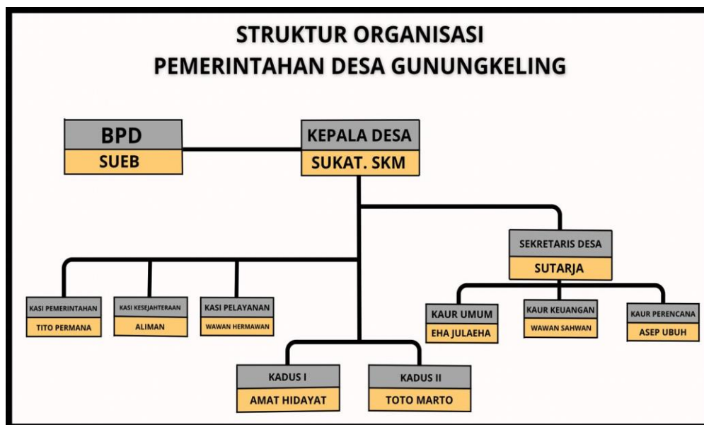
Gambar 3. 2 Struktur Organisasi Pemerintah Desa Gunungkeling