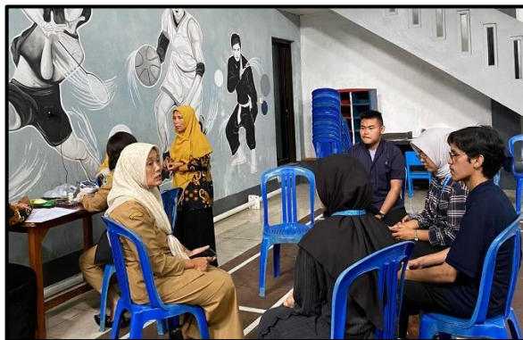
Foto 4. 6 Posyandu Balita Desa Gunungkeling