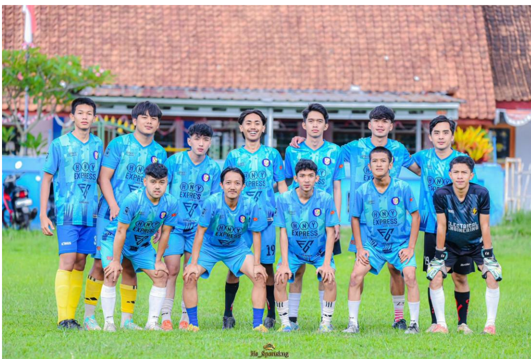
Foto 5. 3 Bermain Sepakbola bersama Karang Taruna

Pada hari jumat, 29 November 2024 praktikan mengikuti olahraga bersama yaitu sepakbola di lapangan Nusaherang, kegiatan tersebut bertujuan untuk mendekatkan diri dengan teman-teman karang taruna.