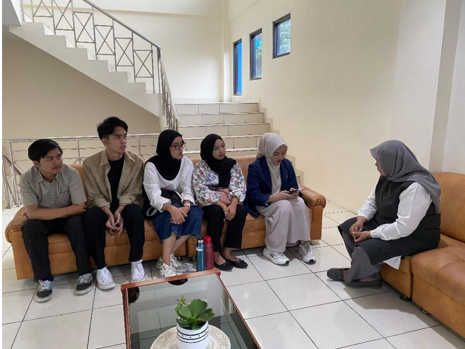
Foto 1. 1 Kegiatan Bimbingan Pra Lapangan

mengenai aras makro. Kegiatan ini berlangsung selama 30 menit mengingat bahwa pedoman praktikum komunitas belum keluar.