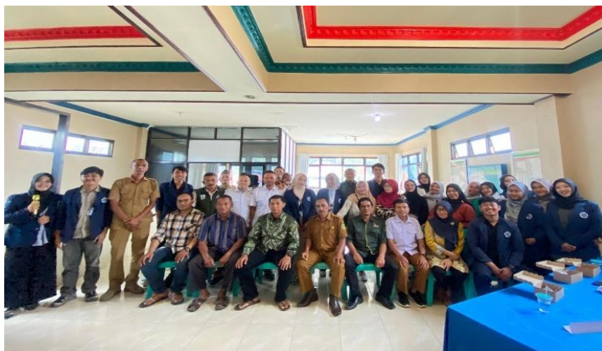
Foto 5. 1 Kegiatan Lokakarya

Pada senin, tanggal 2 Desember 2024, praktikan Praktikan dan rekan membuat kegiatan loka karya yang dilakukan di kantor desa cileuleuy, yang pada saat itu dihadiri oleh kepala desa, kepala dusun, BPD desa cileuleuy,TKSK, kader PKK dan tokoh Masyarakat, kegiatan tersebut berisikan pemaparan terkait dengan program pemberdayaan yang telah dilakukan oleh mahasiswa praktikum komunitas yang berada di desa cileuleuy selama 40 hari. Selain itu juga kegiatan loka karya tersebut merupakan acara penutupan dan perpisahan dengan pihak Desa Cileuleuy mengingat akan berakhirnya kegiatan praktikum komunitas di Desa Cileuleuy.