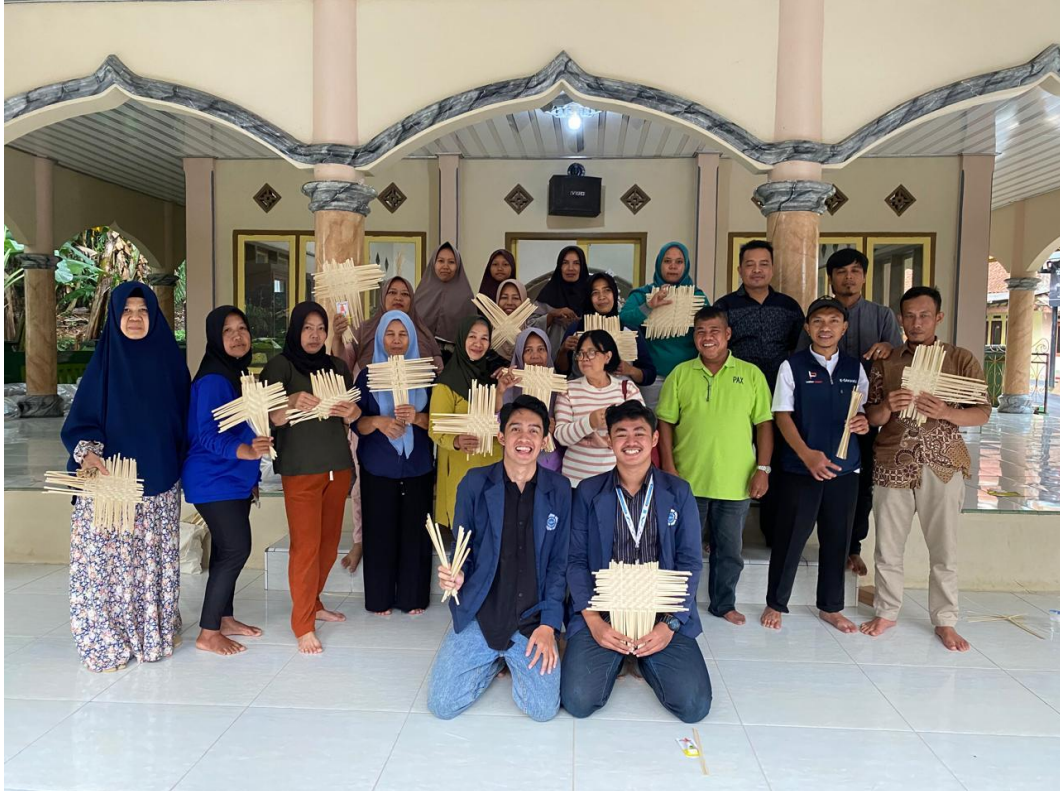
Foto 4. 7 Kegiatan Pelatihan Anyaman Bambu