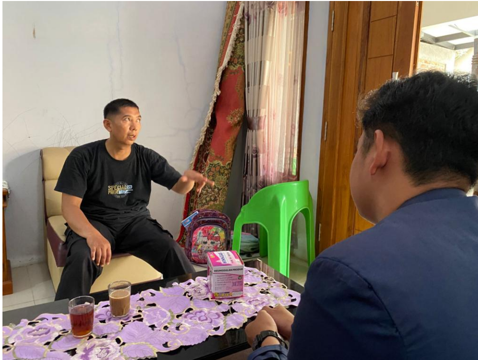
Foto 4. 2 Perkenalan Kerumah Kepala Dusun