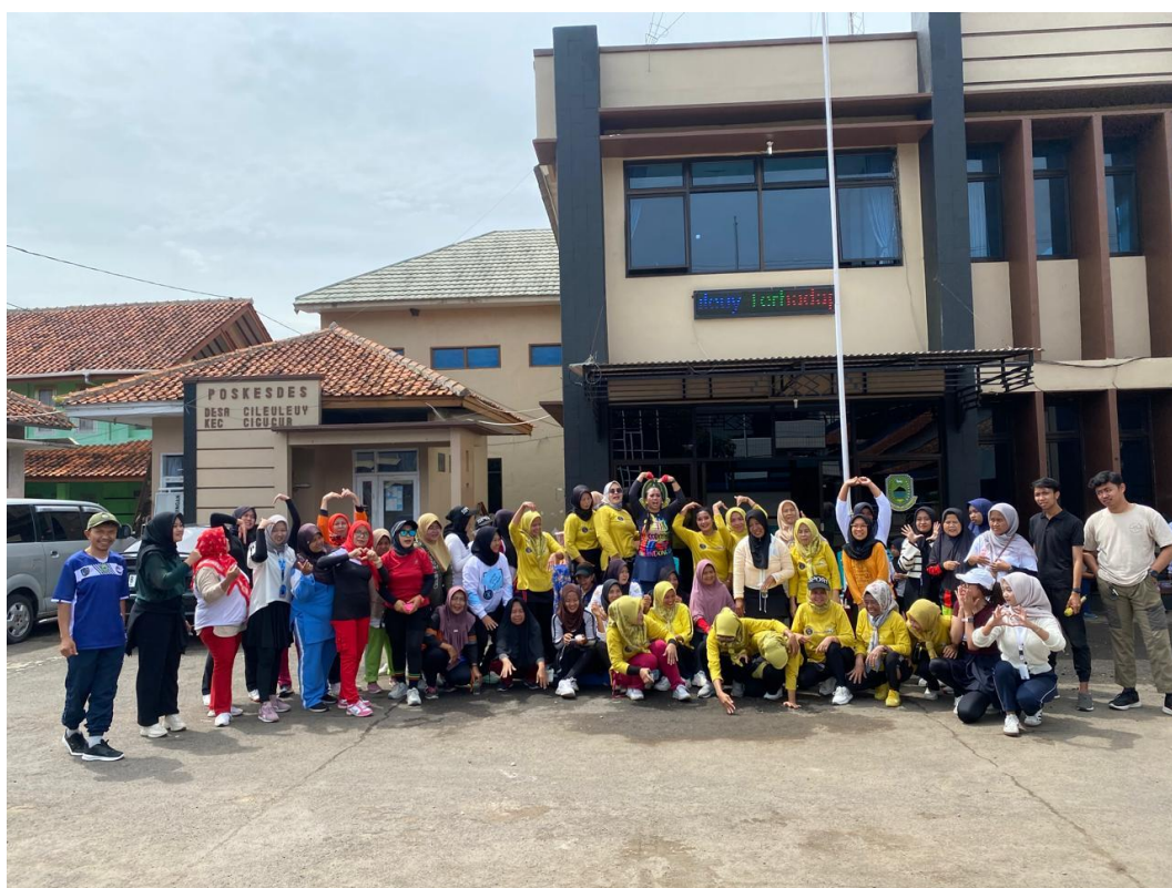
Foto 5. 2 Kegiatan Senam bersama

Pada hari Minggu, 1 Desember 2024 praktikan dan rekan kelompok berinisiatif untuk membuat acara bersama dengan warga desa cileuleuy yang dilakukan di lapangan desa cileuleuy yaitu kegiatan senam dan dilakukan pengecekan Kesehatan seperti cek tensi dan tes kadar gula, kegiatan tersebut dihadiri oleh 50 warga desa cileuleuy yang terlihat sangat antusias dengan adanya kegiatan tersebut pada kegiatan tersebut dibuatkan slogan “sehat bersama bahagia selalu”, kegiatan tersebut juga dihadiri oleh sekretaris desa cileuleuy dan melihat warganya antusias dengan adanya kegiatan tersebut, maka kegiatan senam dan cek kesehatan tersebut akan dijadikan kegiatan rutin bulanan di desa Cileuleuy karena permintaan juga dari peserta kegiatan yang hadir pada saat itu.