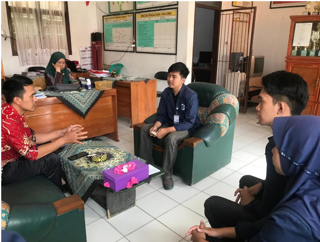
Foto 4. 5 Mengobrol dengan Interest Group yang ada di Dusun Kliwon.