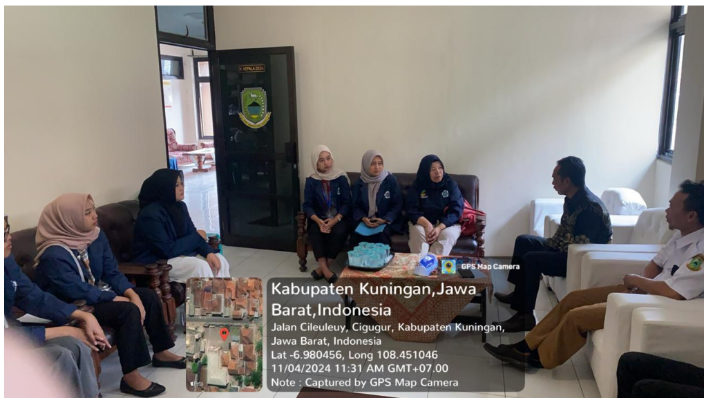
Foto 1. 2 Supervisi Dosen

Dosen memiliki 3 kali jadwal untuk supervisi, pada awalnya, untuk supervisi pertama, dosen datang pada tanggal 4 November 2024 sekaligus ke kantor Desa Cileuleuy untuk meminta izin. Untuk supervisi kedua, dosen datang pada tanggal 14 November untuk memberikan pembekalan mengenai teknik asesmen. Untuk supervisi ketiga, Dosen datang pada tanggal 26 November untuk mengevaluasi hasil intervensi dari praktikan.