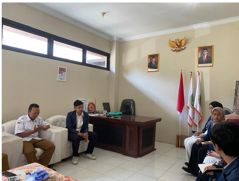
Foto 4. 1 Pertemuan Awal dengan Perangkat Desa Cileuleuy