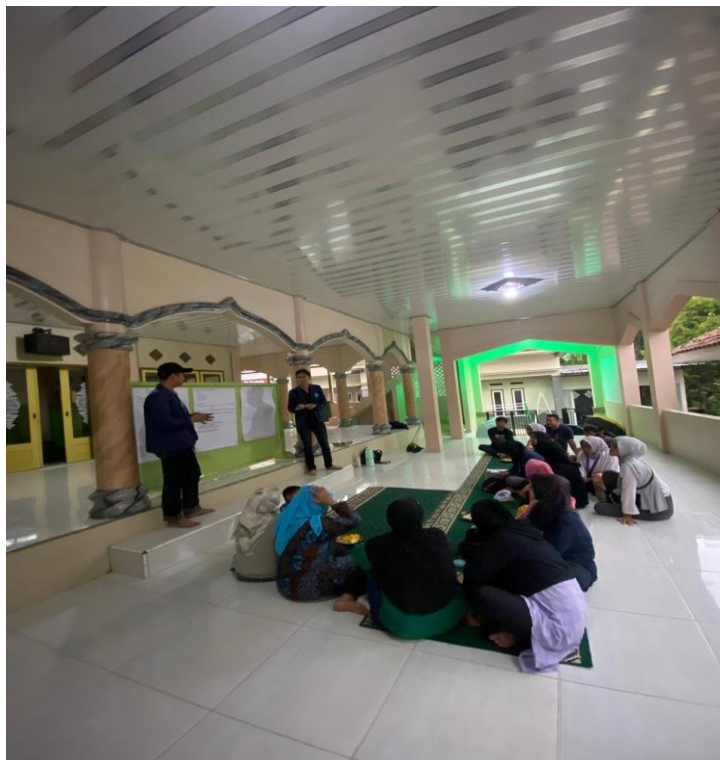
Foto 4. 4 MPA Dusun Kliwon

Dari hasil MPA diatas, diketahui ada 6 klasifikasi masalah yang ada di Dusun Kliwon dengan persetujuan masyarakat terdapat 2 prioritas masalah yaitu fakir miskin dan PRSE.