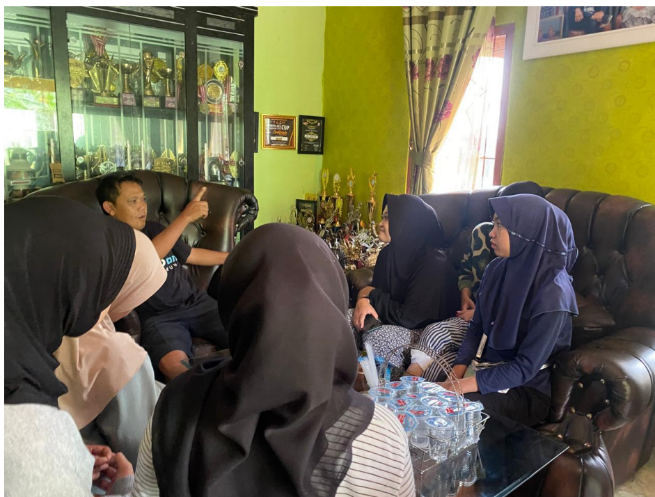
Foto 4. 3 Kunjungan kerumah Ketua Kelompok Tani