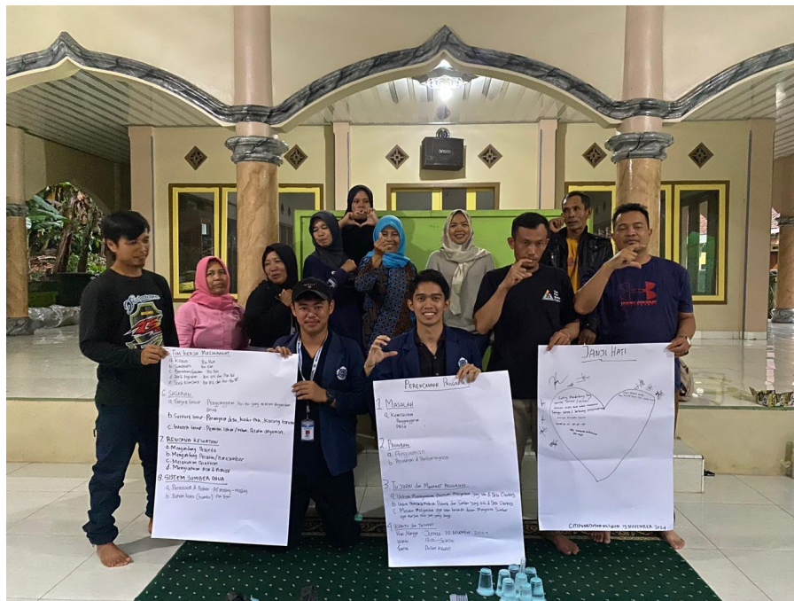
Foto 4. 6 TOP bersama TKM dan Perangkat Desa Cileuleuy Dusun Kliwon

keberlanjutan dalam program yang adakan di lanjutkan oleh pemerintah Desa Cileuleuy.