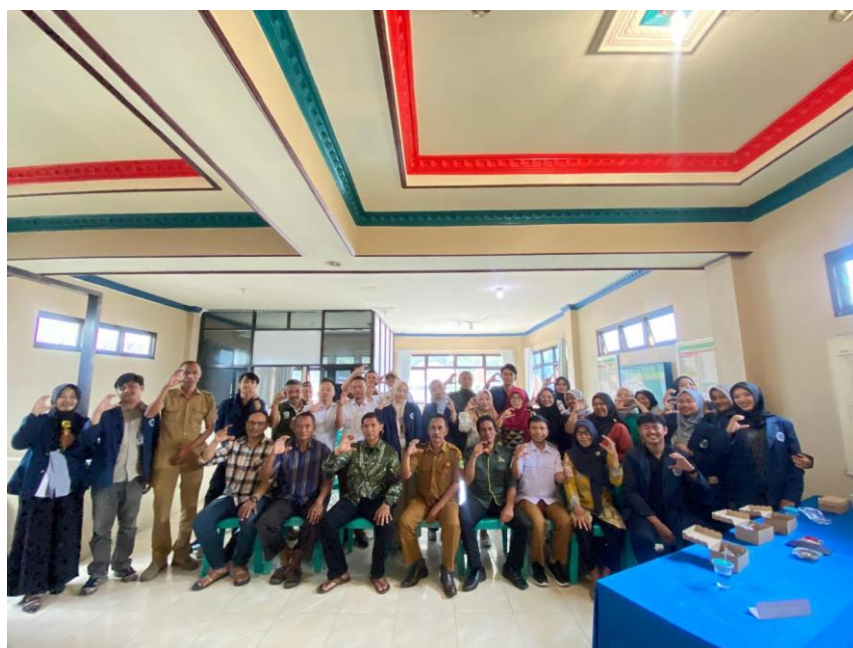
Foto 4. 8 Terminasi dan Rujukan dalam Lokakarya