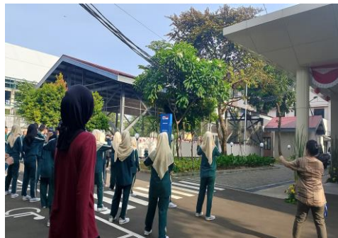
Gambar 20 Senam Pagi

Praktikan mengikuti kegiatan senam pagi bersama seluruh remaja binaan dan pegawai panti. Aktivitas ini berfungsi menjaga kebugaran fisik, membangun disiplin, sekaligus memperkuat ikatan sosial antarwarga panti.