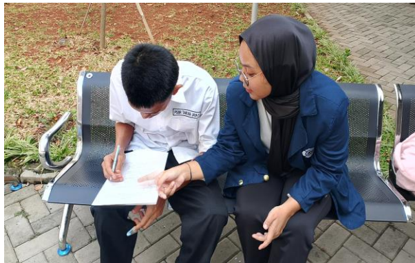
Gambar 4 Penandatanganan Informed consent

Kegiatan penetapan klien dan penandatanganan informed consent serta kontrak dengan klien “P” berhasil dilaksanakan dengan baik. Klien menerima penjelasan dengan penuh perhatian, dan tidak menunjukkan keberatan terhadap isi kontrak. Klien juga menyampaikan kesediaannya untuk mengikuti proses intervensi sesuai kesepakatan.