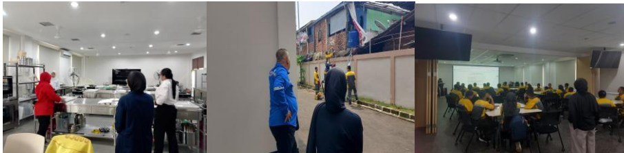
Gambar 19 Pendampingan Kelas Vokasional dan Bimsos