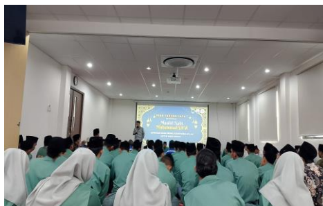
Gambar 21 Peringatan Maulid Nabi

Praktikan ikut serta dalam kegiatan peringatan Maulid Nabi Muhammad SAW yang dilaksanakan di panti. Keterlibatan ini memberikan pengalaman spiritual, sekaligus memperkuat nilai religius yang menjadi bagian dari pembinaan remaja binaan.