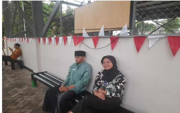
Gambar 7 Asesmen Klien P