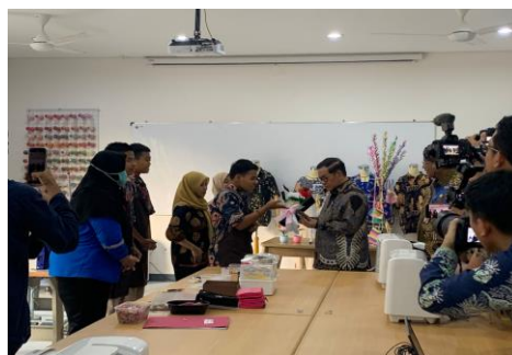
Gambar 25 Kunjungan Gubernur DKI Jakarta

Praktikan turut hadir dan berpartisipasi dalam rangkaian kegiatan kunjungan resmi Gubernur DKI Jakarta ke PSBR Taruna Jaya 1. Kegiatan ini memberikan pengalaman berharga dalam melihat sinergi antara lembaga pemerintah dan panti sosial dalam mendukung pembinaan remaja.