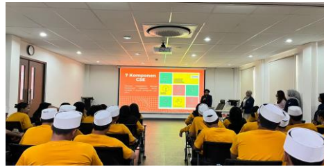
Gambar 24 Kegiatan CSE

Jaya 1. Dalam kegiatan ini, praktikan berperan aktif mulai dari tahap perencanaan, persiapan materi, hingga pelaksanaan kegiatan. Keterlibatan ini memberikan pengalaman penting dalam penyelenggaraan edukasi komprehensif terkait kesehatan reproduksi, kesetaraan gender, dan keterampilan hidup sehat bagi remaja binaan.