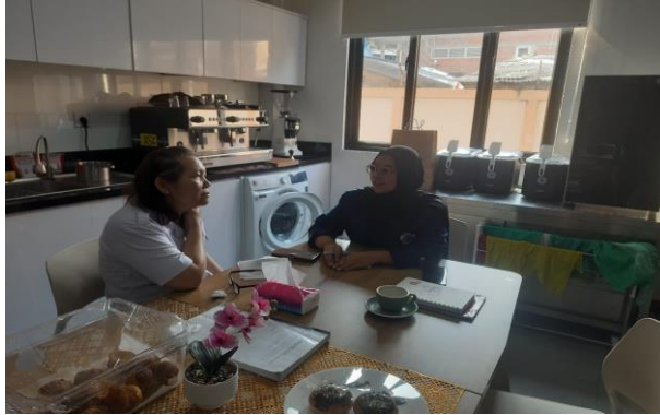
Gambar 8 Validasi Data dengan Pekerja Sosial Klien