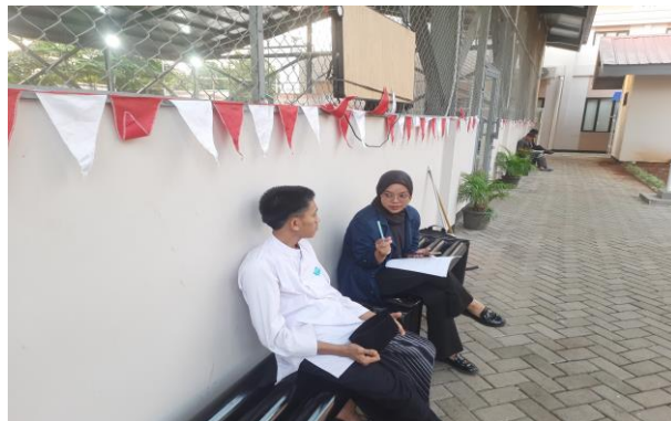
Gambar 5 Asesmen dengan Klien P