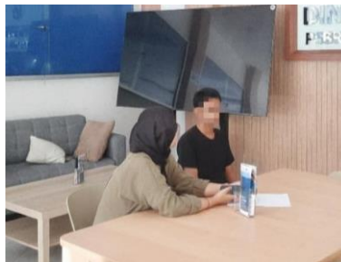
Gambar 14 Kegiatan Edukasi Manajemen Emosi