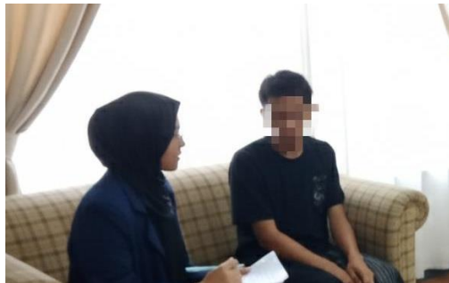
Gambar 12 Konseling