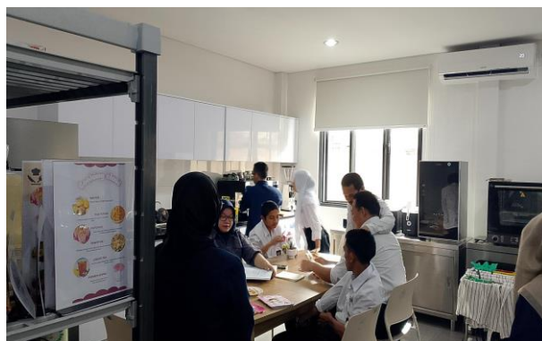
Gambar 3 Praktikan Melakukan Intake dan Enggagment dengan calon klien

Dari pertemuan ini, praktikan memperoleh gambaran awal mengenai karakter klien yang cenderung pemalu namun memiliki potensi untuk lebih berkembang jika diberi dorongan dan pendekatan yang tepat. Hal ini menjadi pijakan penting untuk membangun engagement lebih lanjut pada pertemuan berikutnya.