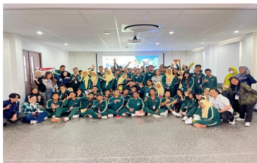
Gambar 23 Kegiatan Beneran Indonesia

Praktikan mendapat kesempatan menjadi fasilitator dalam kegiatan Beneran Indonesia, sebuah program yang mendorong kesadaran sosial, kebangsaan, dan keaktifan remaja binaan dalam kegiatan positif. Kesempatan ini memberikan pengalaman langsung bagi praktikan dalam memimpin, memfasilitasi, dan mengelola dinamika kelompok.