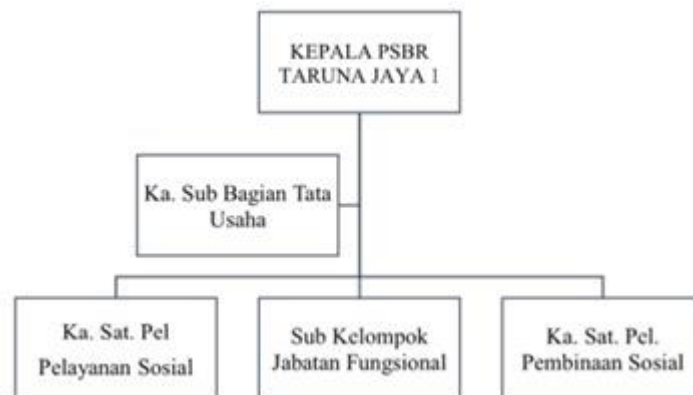
Gambar 1 Struktur Organisasi

Struktur organisasi PSBR Taruna Jaya 1 dirancang untuk mendukung pelaksanaan tugas dan fungsi lembaga secara optimal. Struktur ini terdiri atas unsur pimpinan, unsur pelaksana teknis, dan unsur pendukung. Berikut adalah struktur organisasi PSBR Taruna Jaya 1: