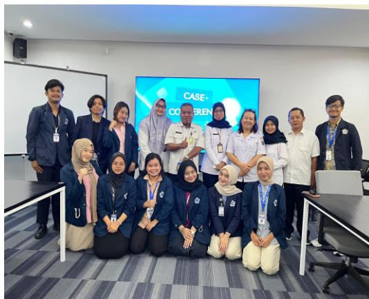
Gambar 16 CC II