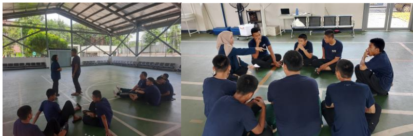
Gambar 15 Recreational Skill Group