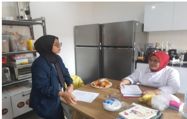
Gambar 6 Asesmen dengan Instruktur dan Pendamping Kelas