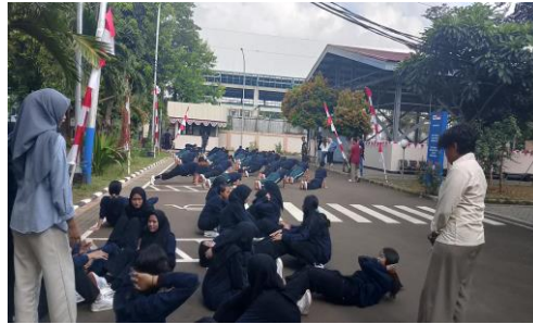
Gambar 22 Kegiatan PBB

Praktikan mendampingi remaja binaan dalam kegiatan latihan fisik dan baris-berbaris. Kegiatan ini bertujuan menumbuhkan kedisiplinan, kekompakan, dan tanggung jawab pada diri remaja binaan.