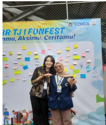
Gambar 18 Fun Festival

Praktikan ikut serta dalam kegiatan Fun Festival yang diselenggarakan sebagai penutupan kerja sama antara PSBR Taruna Jaya 1 dengan KOICA ( Korea International Cooperation Agency ). Acara ini diisi dengan berbagai kegiatan kebersamaan, pertunjukan seni, serta unjuk keterampilan remaja binaan. Praktikan terlibat dalam pendampingan peserta, membantu persiapan acara, dan mendukung kelancaran pelaksanaan kegiatan hingga selesai.