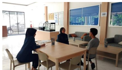
Gambar 13 Role Play