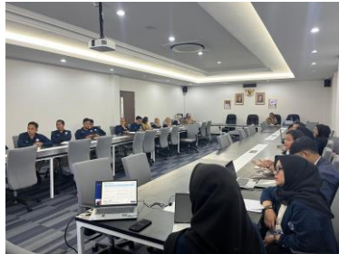
Gambar 11 Case Conference I

intervensi, kemudian mendapatkan masukan terkait penyempurnaan rencana intervensi agar lebih sesuai dengan kebutuhan klien dan kondisi di panti.