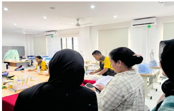
Gambar 2 Praktikan Melakukan Orientasi di Kelas Vokasional dan Bimbingan Sosial

Praktikan mendapatkan informasi awal mengenai kegiatan vokasional dan bimbingan sosial di PSBR TJ 1, pola pembelajaran yang diberikan, serta karakteristik interaksi WBS dengan instruktur dan pendamping. Kegiatan ini juga membantu praktikan mengenal dinamika kelas, memperhatikan minat WBS dalam mengikuti kegiatan, dan mulai membangun relasi awal dengan beberapa WBS melalui percakapan ringan.