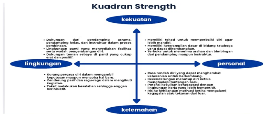
Gambar 10 Kuadran Stength