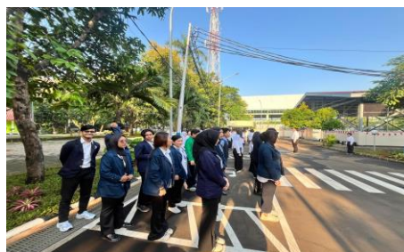
Gambar 17 Apel Pagi

Praktikan mengikuti apel pagi yang dilaksanakan di lapangan utama bersama seluruh remaja binaan, pegawai, dan instruktur. Apel pagi bertujuan untuk mengecek kehadiran, membangun kedisiplinan, serta menumbuhkan rasa kebersamaan di lingkungan panti.