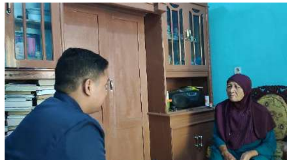
Wawancara dengan Tetangga Lansia