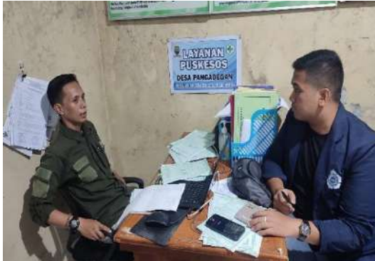
Wawancara dengan Kasie Kesejahteraan Desa Pangadegan