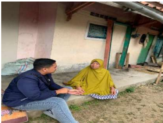
Wawancara dengan Informan R