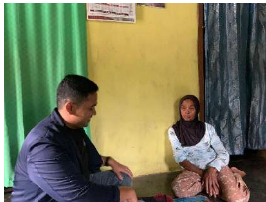
Wawancara dengan Informan S