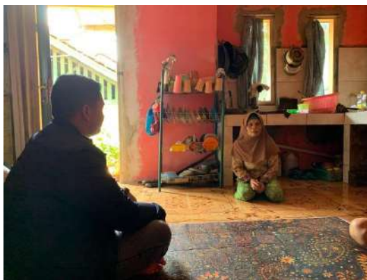
Wawancara dengan Infoman W