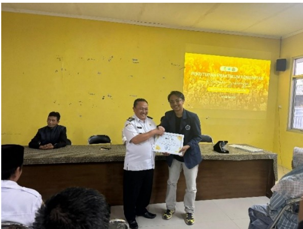
Foto 4. 16 : Serah Terima Sertifikat Praktikum Kelurahan Sukamulya