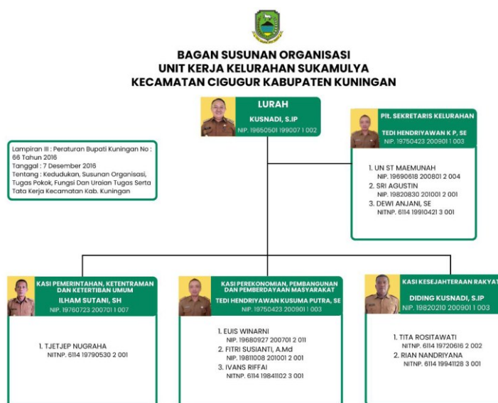
Gambar 3. 2 : Struktur Organisasi Kelurahan Sukamulya