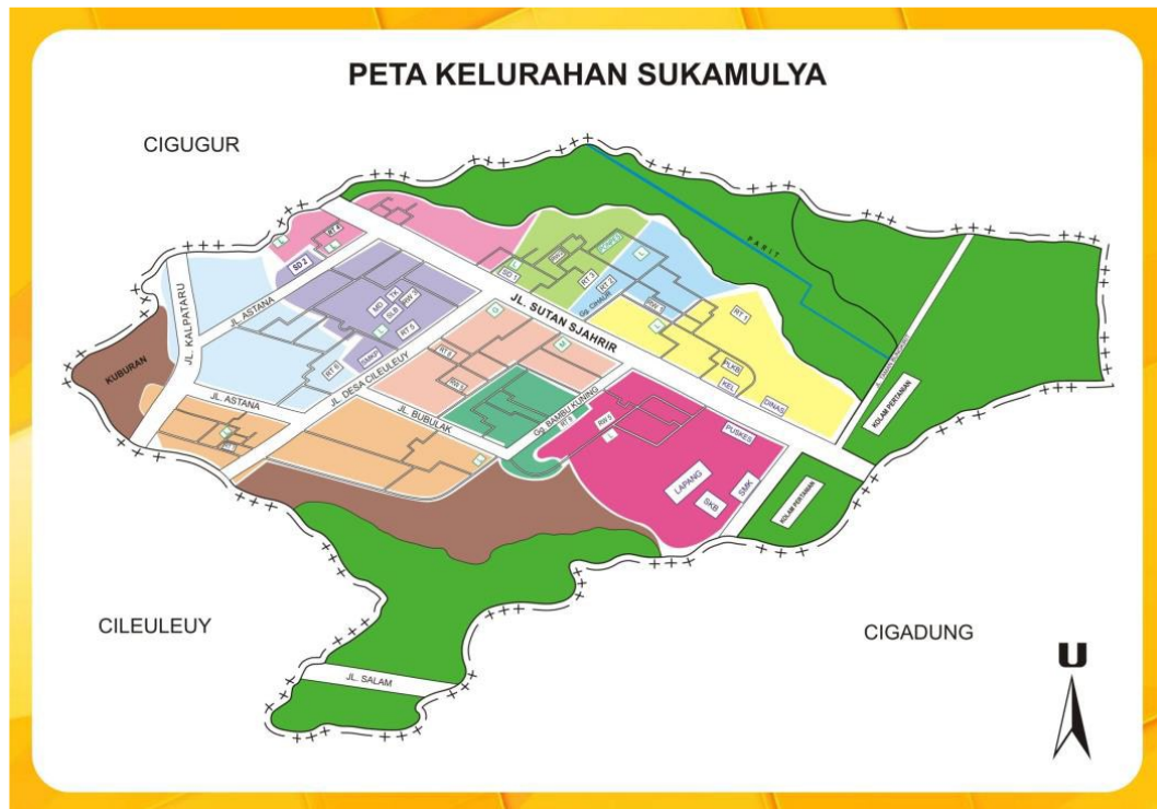
Gambar 3. 1 : Peta Kelurahan Sukamulya

menghubungkan ke pusat kota serta fasilitas umum seperti sekolah, puskesmas, dan pasar tradisional yang memenuhi kebutuhan masyarakat.