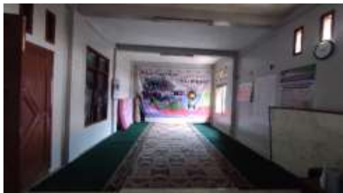
Gambar 4.9 Aula Asrama Putri

orang.” Berikut observasi lapangan peneliti dalam melihat aula di asrama putri dan putra, dapat dilihat pada gambar di bawah ini.