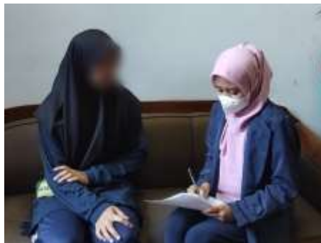
Gambar 4.4 Wawancara Informan SP

Informan SP merupakan anak asuh perempuan berusia 16 tahun yang tinggal di Panti Sosial Asuhan Anak Insan Harapan. SP tinggal di panti selama 6 bulan dan saat ini menempuh pendidikan Sekolah Menengah Kejuruan (SMK). SP merupakan anak yatim, ia anak kedua dari dua bersaudara dan kakaknya sudah lebih dulu tinggal di panti. Ia tinggal di panti karena ibunya sibuk bekerja sehingga tidak ada yang mengurusnya.