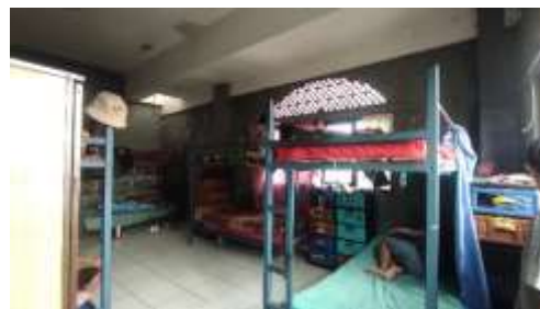
Gambar 4.8 Kamar Asrama Putra