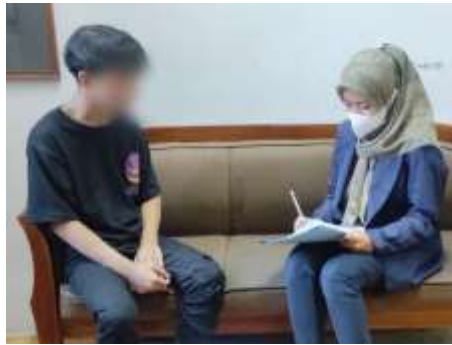
Gambar 4.5 Wawancara Informan KK

Orang tua KK masih lengkap namun keadaan ekonomi yang kurang memadai membuat KK harus berada di panti.