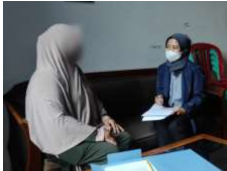
Gambar 4.3 Wawancara Informan RS