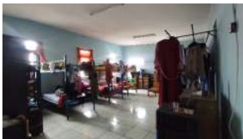
Gambar 4.7 Kamar Asrama Putri

Berdasarkan pemaparan hasil wawancara diketahui bahwa kamar yang ditempati oleh anak asuh perempuan berjumlah 2 (dua) unit yang masing-masing unit ditempati oleh 6 (enam) orang, sedangkan kamar anak asuh laki-laki berjumlah 1 (satu) yang ditempati oleh 5 (lima) orang. Berikut hasil observasi lapangan peneliti melihat kondisi kamar anak asuh perempuan dan laki-laki dituangkan pada gambar di bawah ini.