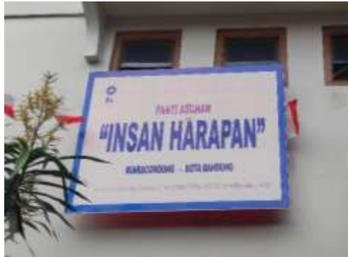
Gambar 4.1 Panti Sosial Asuhan Anak Insan Harapan