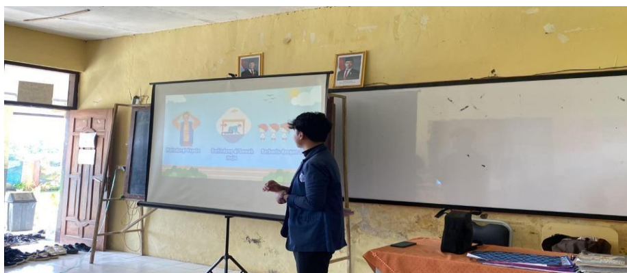
Gambar 4. 17 Praktikan Melakukan Sosialisasi

Setelah briefing, kegiatan dilanjutkan dengan penyampaian materi tentang gempa bumi, yang berlangsung pada pukul 07.30-08.00 WIB. Materi disampaikan oleh praktikan menggunakan pendekatan visual dan komunikatif agar mudah dipahami oleh siswa kelas 4-6. Dalam sesi ini, siswa diajak memahami apa itu gempa bumi, penyebabnya, dan dampaknya.