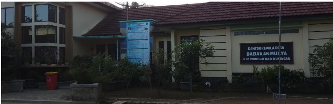
Gambar 3. 1 Desa Babakanmulya

Desa Babakanmulya adalah sebuah Desa di ujung Barat Kabupaten Kuningan, yang merupakan Desa hasil pemekaran dari Desa Puncak Kecamatan Cigugur Kabupaten Kuningan pada Tahun 1984. Berawal dari keinginan Masyarakat yang ingin mendapatkan pelayanan yang prima dari Pemerintah yang lebih dekat, efektif dan efisien maka pada Tahun 1984 dibentuklah Panitia Pemekaran Desa dan pada waktu itu juga langsung mengajukan permohonan pemekaran Desa kepada Pemerintah Kabupaten. Dengan melewati beberapa hal/proses pemekaran yang sesuai dengan aturan Hukum yang berlaku dari mulai penentuan nama Desa, pembagian Wilayah, pembagian kekayaan Desa, dll. Akhirnya pada Bulan Agustus 1984 Babakanmulya resmi menjadi Desa sesuai dengan Peraturan Daerah Tentang Pembentukan Desa – Desa baru hasil Pemekaran Desa di Kabupaten Kuningan.