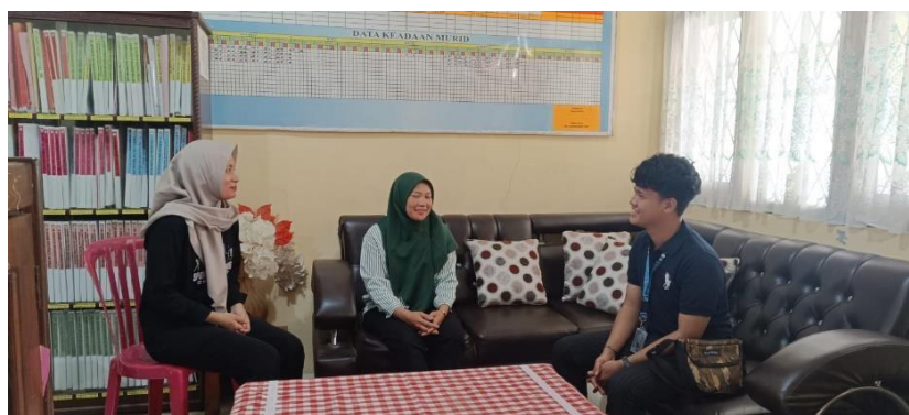
Gambar 4. 14 Melakukan Asesmen dengan Pihak SDN 02 Babakanmulya