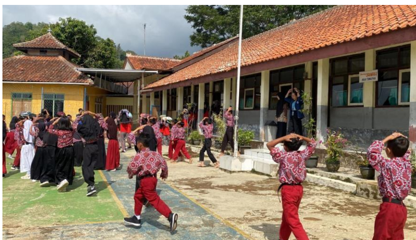
Gambar 4. 19 Melakukan Simulasi Gempa Bumi

Guru juga dilibatkan dalam simulasi untuk memastikan koordinasi berjalan lancar. Praktikan dan TKM bertugas memantau jalannya simulasi, mencatat kekurangan, dan memberikan arahan selama pelaksanaan. Simulasi ini bertujuan melatih respons siswa dan guru terhadap situasi darurat serta meningkatkan kesiapsiagaan mereka.