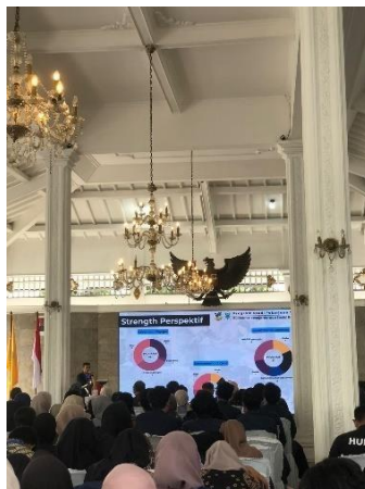
Gambar 4. 23 Lokakarya Kabupaten

Selain melakukan terminasi di desa, praktikan juga melakukan lokakarya sekaligus terminasi di Pendopo Kabupaten Kuningan pada Jumat, 6 Desember 2024 di Pendopo Kabupaten Kuningan. Perwakilan mahasiswa praktikan menyampaikan capaian selama 40 hari melaksanakan praktikum komunitas di kabupaten Kuningan khususnya Kecamatan Cigugur. Terminasi ini juga disertai pembagian bantuan sosial dan Desa Babakanmulya mendapatkan 4 penerima manfaat.