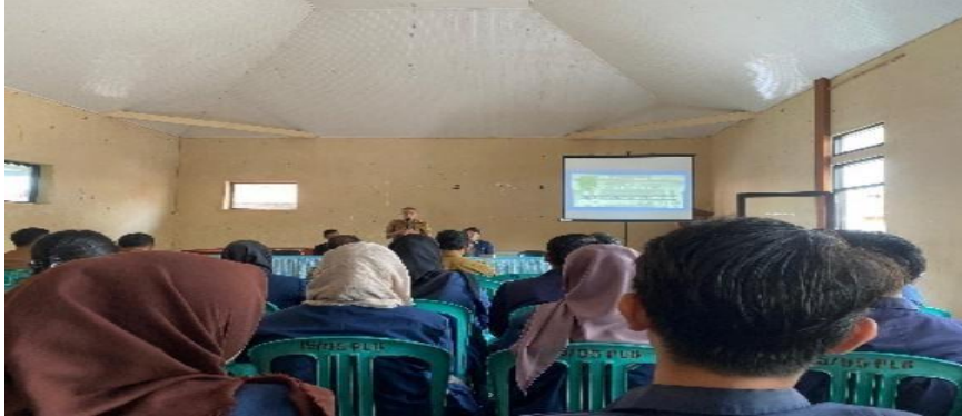
Gambar 4. 2 Penerimaan Di Kecamatan Cigugur

komunitas untuk mencegah kesalahan pemahaman terkait praktikum yang sedang berjalan.