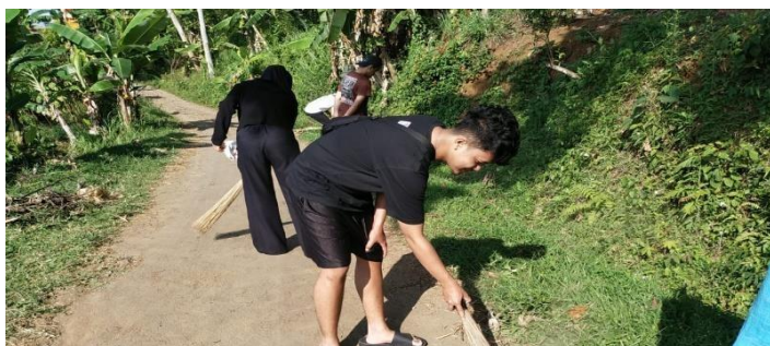
Gambar 4. 9 Mengikuti Kegiatan Kerja Bakti

Para praktikan dengan penuh semangat turut ambil bagian dalam kegiatan kerja bakti yang diselenggarakan di Dusun Pareunca. Dalam kegiatan tersebut, mereka berfokus pada pembersihan lingkungan di area Blok Jengkol, sebuah bagian dari dusun yang membutuhkan perhatian khusus dalam menjaga kebersihan dan keindahan lingkungannya. Melalui kegiatan ini, praktikan tidak hanya menunjukkan kepedulian terhadap lingkungan, tetapi juga menjadikan momen tersebut sebagai kesempatan untuk berinteraksi langsung dengan masyarakat setempat.