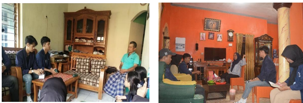
Gambar 4. 5 Kegiatan Home Visit

Kegiatan ini dilakukan untuk bersilahturahmi dengan penduduk Desa Babakanmulya dalam membangun Trusmi Building dengan Masyarakat dan menjelaskan kegiatan praktikum yang dilakukan oleh praktikan.