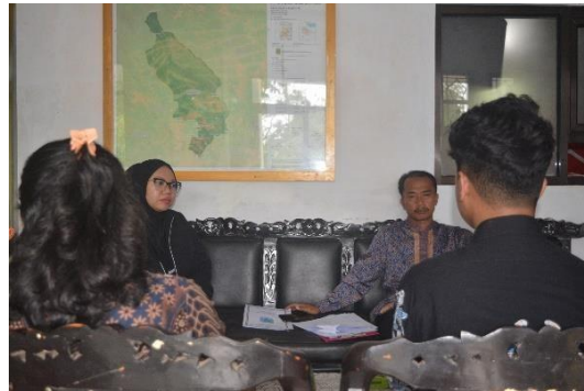
Gambar 4. 13 Melakukan Asesment Lanjutan dengan Kepala Desa