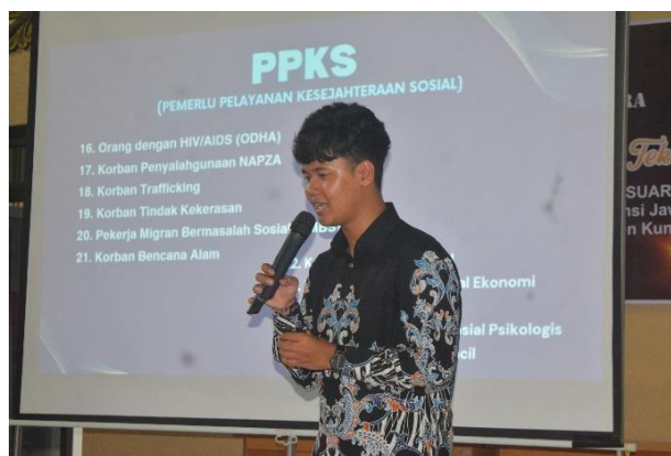
Gambar 4. 7 Pertemuan Warga

Kegiatan ini dilaksanakan bersama dengan masyarakat yang berasal dari tiga dusun yaitu dusun parenca, dusun tari kolot, dan dusun cirabak. Kegiatan ini dilaksanakan pada hari Jumat, 8 November 2024 pukul 13.00 – 14.30 WIB yang dilaksanakan di Kantor Desa Babakanmulya. Pertemuan ini dihadiri oleh ketua RT dan RW, tokoh masyarakat, tokoh agama, tokoh pemuda, dan perwakilan dari organisasi lokal seperti karang taruna, PKK, KWT.