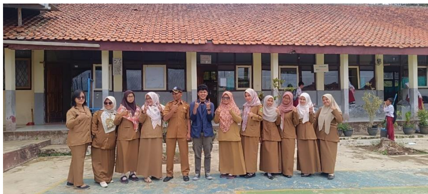
Gambar 4. 21 Teriminasi dengan Pihak SDN 02 Babakanmulya.

Terminasi adalah tahap pengakhiran intervensi pekerjaan sosial. Terminasi merupakan tahap pemutusan hubungan secara formal dengan masyarakat atau kelompok sasaran. Tahap ini harus dilakukan karena program sudah harus dihentikan, sesuai dengan jangka waktu yang telah ditetapkan sebelumnya.