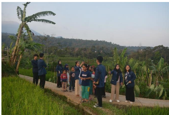
Gambar 4. 4 Kegiatan Transect Walk

Praktikan melaksanakan penjajakan dengan keliling Desa Babakanmulya, yang dilaksanakan mulai pada hari Rabu, 30 Oktober 2024 sampai dengan hari Jumat, 1 November 2024. Tentu dalam hal ini bertujuan untuk mengetahui medan lapangan di Desa Babakanmulya sekaligus berkeliling menyapa masyarakat desa. Kegiatan dilaksanakan praktikan dengan menggunakan motor dan berjalan kaki, menggunakan dengan motor untuk menjagkau dusun yang jauh dari tempat tinggal praktikan dan berjalanan kaki untuk menjangkau masyarakat di sekitar tempat tinggal praktikan yaitu dusun Cirabak.