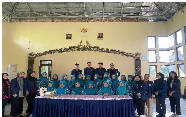
Gambar 4. 8 Mengikuti Kegiatan Rakor Kader PKK

Kegiatan ini berlangsung di gedung serbaguna Balai Desa Babakanmulya dan melibatkan 18 kader PKK serta 12 mahasiswa praktikan. Dalam rapat koordinasi tersebut, berbagai topik penting dibahas, termasuk persiapan untuk program bina wilayah dan upaya pencegahan penyalahgunaan narkoba pada anak. Selain itu, para praktikan juga mendapatkan wawasan baru mengenai struktur organisasi PKK yang terbagi menjadi empat kelompok kerja (pokja). Pokja 1 bertugas di bidang keagamaan, program Gazi Pelangi, serta sosialisasi pencegahan narkoba. Pokja 2 fokus pada sektor pendidikan, pengembangan usaha UP2K, dan pemberdayaan UMKM. Pokja 3 berperan dalam mendukung ketahanan pangan masyarakat, sedangkan Pokja 4 bergerak di bidang kesehatan. Namun, saat ini dapur gizi yang biasanya aktif membantu pemenuhan kebutuhan gizi masyarakat terpaksa berhenti beroperasi karena tidak adanya sumber dana. Sebelumnya, dapur gizi rutin menerima bantuan Program Makanan Tambahan (PMT) dari Rumah Zakat selama tiga bulan terakhir, tetapi dukungan ini kini terhenti sehingga aktivitas dapur tidak dapat dilanjutkan.