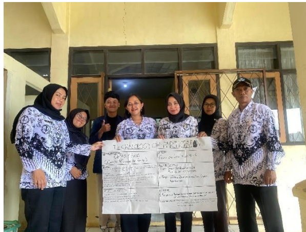
Gambar 4. 16 Hasil TOP bersama TKM