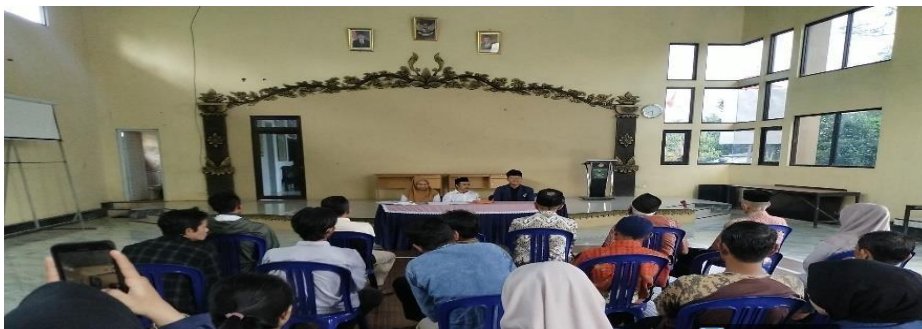
Gambar 4. 6 Pertemuan