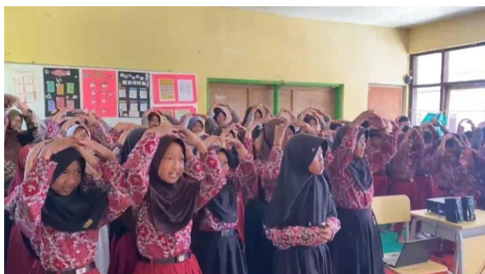
Gambar 4. 18 Siswa sedang mempraktikkan prosedur "Drop, Cover, and Hold On."

Tahapan ini dimulai pukul 08.00-08.45 WIB dan berfokus pada edukasi langkah-langkah keselamatan yang harus dilakukan saat terjadi gempa. Praktikan menjelaskan secara rinci prosedur " Drop, Cover, and Hold On ," yaitu merunduk untuk melindungi diri, berlindung di bawah meja atau struktur kuat, dan berpegangan erat hingga guncangan berhenti. Praktikan memberikan contoh gerakan yang benar di depan kelas, diikuti dengan praktik langsung oleh siswa.