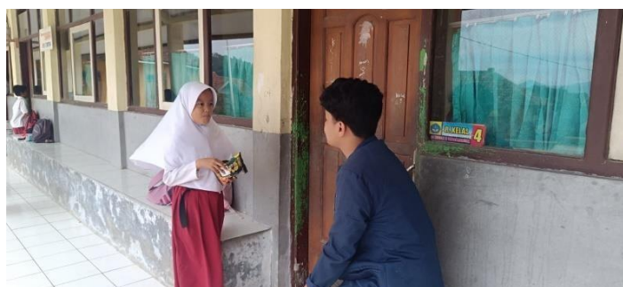
Gambar 4.20 Praktikan melakukan evaluasi dengan teknik wawancara

Evaluasi merupakan suatu proses penilaian akan keberhasilan intervensi yang telah dilaksanakan, baik dari segi proses maupun hasil. Selain itu, evaluasi juga dilakukan untuk melihat perkembangan dan perubahan, serta tercapainya tujuan intervensi yang telah ditetapkan. Hasil evaluasi dapat dijadikan sebagai masukan guna penyempurnaan program ke depan.