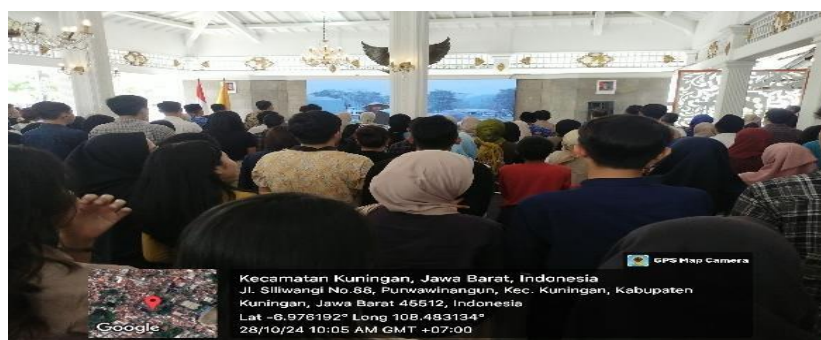
Gambar 4. 1 Penerimaan Praktikan di Pendopo Kuningan

Penerimaan mahasiswa praktikan praktikum komunitas dilakukan di Pendopo Kabupaten Kuningan yang dilaksanakan pada Senin, 28 Oktober 2024 pukul 09.00 – 11.00 WIB.