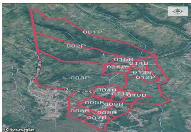
Gambar 3. 2 Peta Babakanmulya

Desa Babakanmulya adalah salah satu Desa di Kecamatan Cigugur yang mempunyai luas Wilayah 221.686 Ha. Jumlah Penduduk Desa Babakanmulya sebanyak 3138 jiwa yang terdiri dari 1629 Laki –laki dan 1509 perempuan dengan jumlah kepala keluarga sebanyak 979 KK dengan presentse 3,2 % dari jumlah keluarga yang ada di Desa Babakanmulya. Batas – batas administratif Pemerintahan Desa Babakanmulya Kecamatan Cigugur sebagai berikut ; - Sebeah Utara : Desa cisantana - Sebelah Timur : Desa Cileuleuy - Sebelah Selatan : Desa Puncak - Sebelah Barat : Gunung Ciremai (TNGC) Dilihat dari topografi dan kontur tanah.