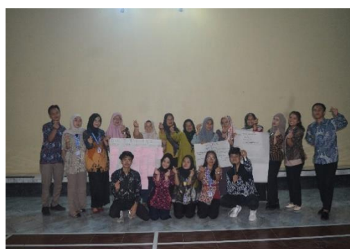
Gambar 4. 10 Kegiatan MPA