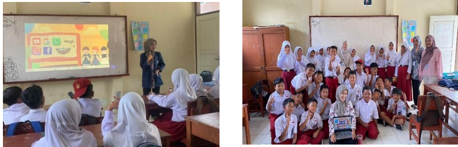
Foto 4.5 Pelaksanaan Penyuluhan