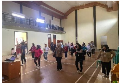
Foto 1 Senam