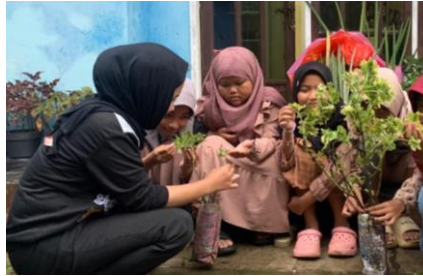
Foto 4.6 Pelaksanaan Pemberdayaan

praktikan memberikan contoh kegiatan yang dapat dilakukan dirumah dan dapat menghasilkan.