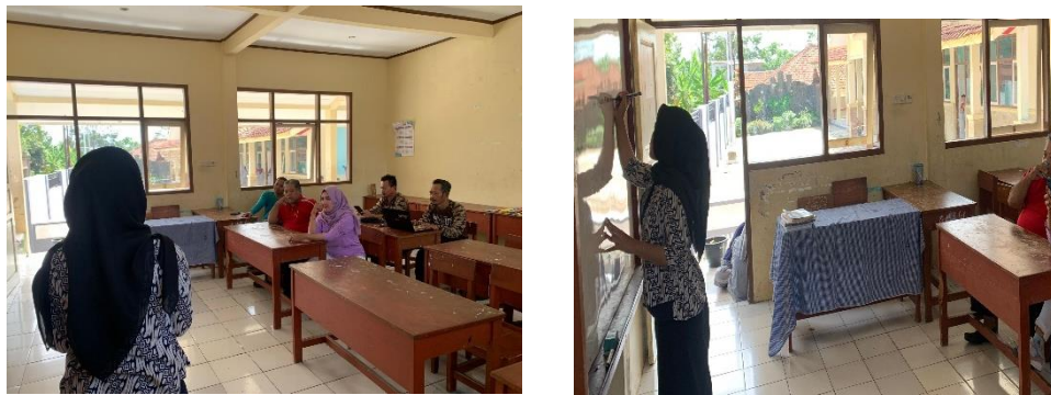
Foto 4.7 Pelaksanaan Focus Group Discussion

Praktikan melaksanakan Focus Group Discussion (FGD) yang dihadiri TKM. FGD ini dilakukan sebagai diskusi lanjutan dari pembahasan pembuatan kebijakan tertulis tentang batasan penggunaan gadget disekolah. Praktikan berperan sebagai fasilitator yang memandu jalannya diskusi. FGD ini membahas terkait pertimbangan pertimbangan diizinkan penggunaannya penggunaan gadget di sekolah.