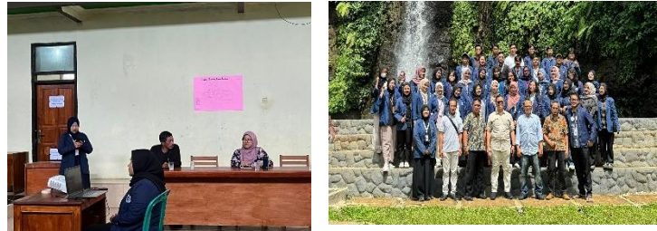
Foto 5.7 Kegiatan Lokakarya