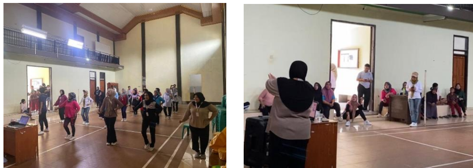
Foto 5.6 Pengabdian Masyarakat

Pengabdian di masyarakat Desa Jambar dilakukan pada tanggal 5 Desember 2024 pukul 08.00 WIB melalui kegiatan senam. Kegiatan senam ini dihadiri oleh masyarakat di Desa Jambar, didalam kegiatan ini juga diadakannya penyuluhan terkait pola hidup bersih dan sehat (PHBS). Penyuluhan ini bertujuan untuk meningkatkan pemahaman dan kepedulian masyarakat Desa Jambar dalam hal kesehatan dan penurunan angka stunting. Pada kegiatan ini juga dilaksanakan pemeriksaan kesehatan yang dilakukan oleh pihak Puskesmas.