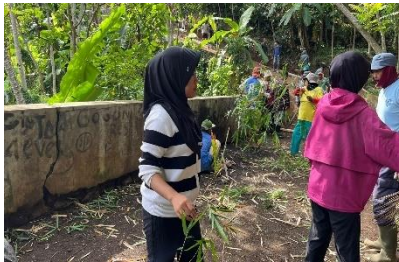
Foto 5.4 Kerja Bakti

Kerja bakti yang dilakukan di Dusun manis yaitu berupa bersih-bersih lingkungan yang ada di sekitar RT 6 sampai 8. Kerja bakti dilakukan pada pukul 07.30 WIB, dalam kegiatannya praktikan melakukan pemotongan rumput yang ada di sekitar RT 8. Kegiatan kerja bakti ini diakhiri dengan dilakukannya botram bersama dengan masyarakat RT 8 yang ada di Dusun Manis.