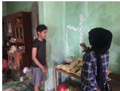
Foto 3 Home Visit UMKM