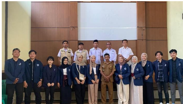
Foto 4.1 Kegiatan Penerimaan di Desa

Tahap ini praktikan memulai dengan berpartisipasi dalam kegiatan penerimaan yang ada di kantor Desa Jambar pada hari Selasa, 29 Oktober 2024. Pada kegiatan awalan ini praktikan menjelaskan maksud dan tujuan, konsep praktikum, dan rencana kegiatan yang akan dilakukan. Setelah itu praktikan melibatkan diri dalam kegiatan rutin yang ada di masyarakat seperti pengajian dan posyandu ( community involving ), pertemuan non formal ( home visit ), pertemuan warga ( community meeting ). Praktikan melakukan home visit kepada beberapa aparat Dusun dan stakeholders/shareholders yang direkomendasikan oleh Kepala Dusun.