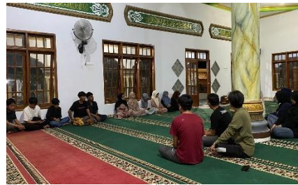
Foto 2 Pertemuan dengan IRMAS