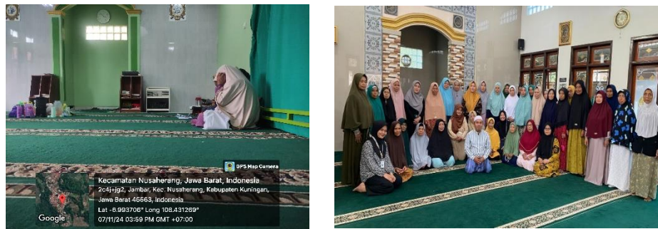
Foto 5.3 Kegiatan pengajian

Praktikan mengikuti kegiatan pengajian yang bertempat di musola musola yang ada di Desa Jambar. Kegiatan pengajian ibu-ibu dimulai setelah ashar yaitu pada pukul 16.00 WIB. Kegiatan pengajian ini merupakan kegiatan rutin yang biasa dilakukan oleh ibu-ibu di Desa Jambar dengan mendatangkan penceramah seorang Ustadz yang berasal dari pondok pesantren yang ada di Desa Jambar. Praktikan memperkenalkan diri sekaligus melakukan pendekatan, membangun relasi dan trustbuilding kepada masyarakat.