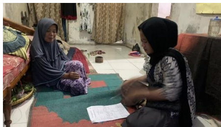
Foto 6 Asesmen Terintegrasi