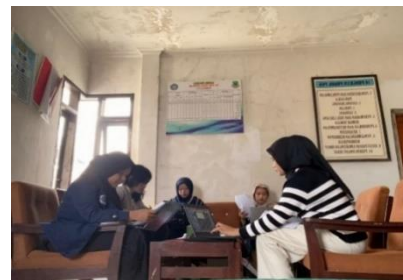
Foto 5.1 Kegiatan Entry Data