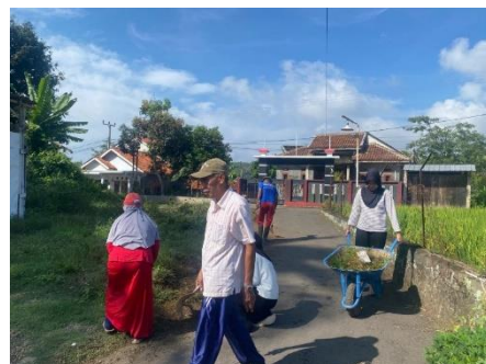
Foto 4.2 Kegiatan Community Involvement