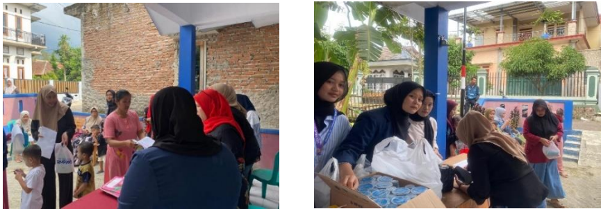
Foto 5.2 Kegiatan Posyandu