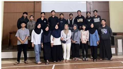
Foto 5.5 Kegiatan Pertemuan KarangTaruna

Praktikan mengadakan pertemuan dengan karang taruna Dusun Pahing yang bernama BADAY (Barydak Dayeuh). Kegiatan ini dilakukan untuk melakukan pendekatan dengan sistem sumber desa untuk membangun relasi. Kegiatan pertemuan membahas terkait keberadaan karang taruna di Desa Jambar dan hal-hal yang berkaitan dengan karang taruna lainnya. Pertemuan dihadiri oleh seluruh praktikan dan seluruh karang taruna, kegiatan dimulai pada pukul 20.00 WIB.