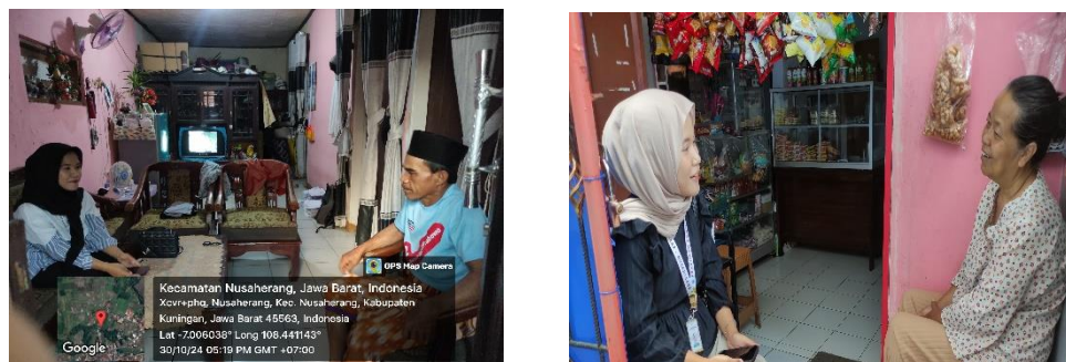
Gambar 4.4 Kegiatan Home Visit

Praktikan mengetahui data jumlah kepala keluarga yang ada di Dusun Pahing yaitu 238 KK, jumlah anak yatim 9 Orang, jumlah data PPKS 5 orang disabilitas. Praktikan juga melakukan home visit yang bertujuan untuk penggalan potensi di UMKM yang ada di Dusun Kliwon dan Dusun Manis yaitu UMKM gemblok, keripik pisang, semprong, dan bolen.