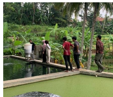
Foto 4.3 Kegiatan Transect Walk