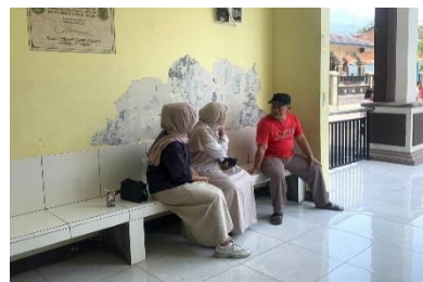
Foto 7 Wawancara Kepala Dusun Pahing