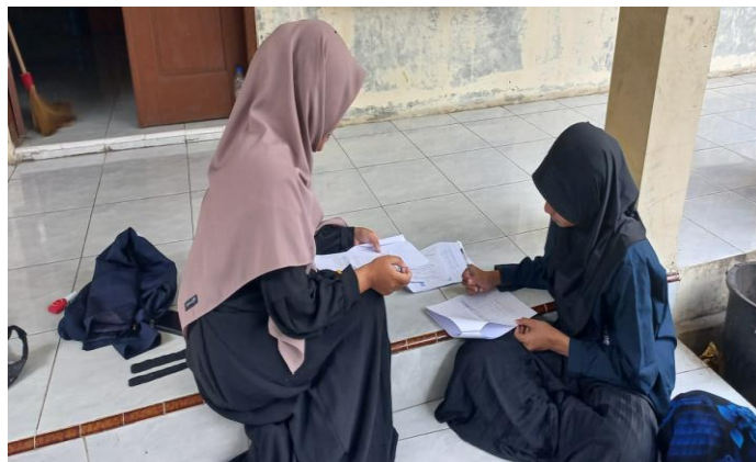
Foto Bersama Ibu Panti