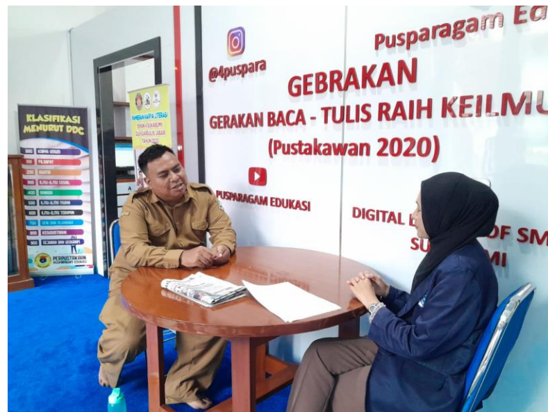
Wawancara informan DW (wali kelas AM)