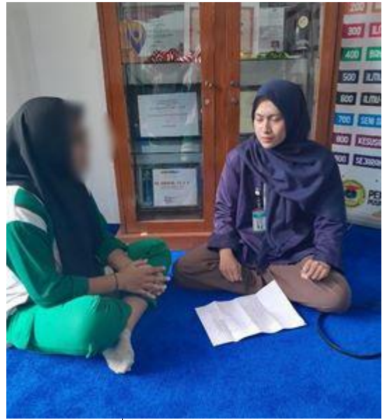
Wawancara informan FT