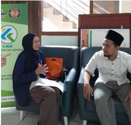
Wawancara dengan informan QD (wali kelas FS)