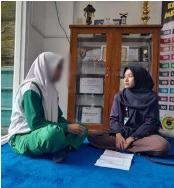
Wawancara informan FS