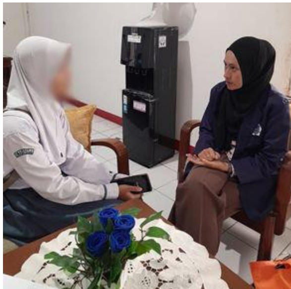
Wawancara informan AM