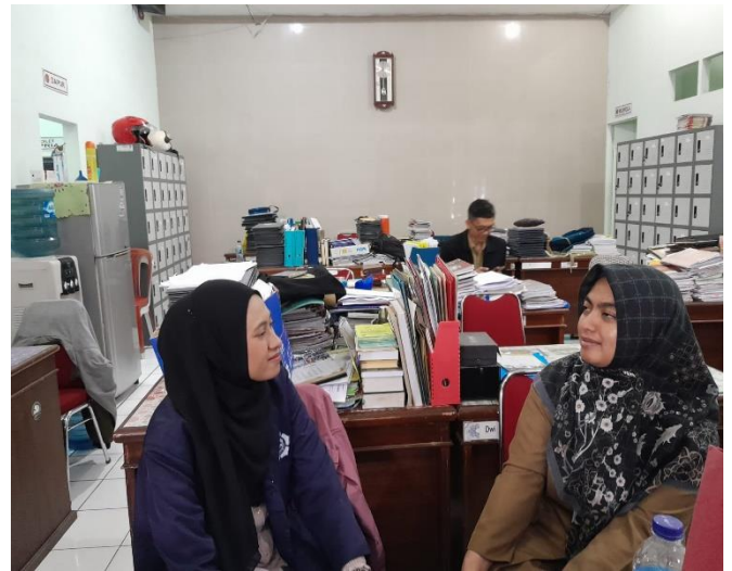
Wawancara dengan informan YN (wali kelas FT)