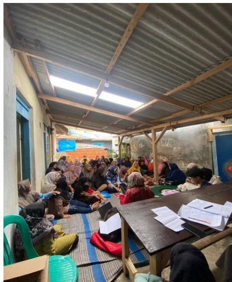
Foto 5. 6 Kegiatan P2K2 Bersama Pendamping PKH