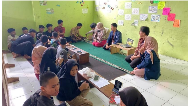
Foto 5. 2 Kegiatan Posyandu Remaja