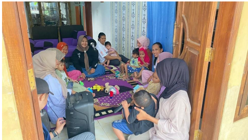
Foto 4. 12 Kegiatan Play Therapy Anak Balita

Play therapy adalah pendekatan terapi menggunakan permainan sebagai media untuk membantu anak balita menekspresikan perasaan., mengembangkan keterampilan, dan mengatasi berbagai tantangan emosional atau perilaku. Tujuan play therapy yang dilaksanakan oleh praktikan yaitu untuk membantu anak mengekspresikan perasaan dengan keterampilan menggambar. Kegiatan ini dilaksanakan pada hari Rabu, 04 Desember 2024. Kegiatan ini diikuti oleh anak balita yang didampingi oleh orang tuanya sebanyak 6 orang. Adapun teknis pelaksanaannya sebagai berikut: