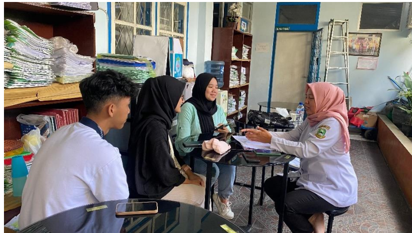
Foto 4. 9 Kegiatan Identifikasi Kebutuhan dan Penyusunan Modul

Dalam upaya meningkatkan kualitas pelayanan posyandu, khususnya dalam mendukung perkembangan anak balita, penting untuk memberikan pelatihan kepada para kader posyandu mengenai pengasuhan anak. Proses ini diawali dengan identifikasi kebutuhan dan dilanjutkan dengan penyusunan modul pelatihan yang relevan dan aplikatif. Agar pelaksanaan pelatihan berjalan lancar, perlu persiapan mengenai kebutuhan apa saja yang harus disiapkan dalam hal ini mengenai persiapan tempat, makanan, peralatan apa saja yang harus dibutuhkan, serta kegiatan kepada kader sebagai penginformasian kegiatan pelatihan yang akan dilakukan. Pada tahap ini diperlukan juga pengumpulan data mengenai jumlah kader posyandu, mengidentifikasi kemampuan kader posyandu, pemetaan komunikasi yang efektif untuk diterapkan serta penentuan tujuan yang spesifik untuk pelaksanaan kegiatan. Setelah kebutuhan teridentifikasi, penyusunan modul pelatihan dilakukan untuk memastikan materi pelatihan pelatihan sistematis, menarik, dan mudah dipahami.