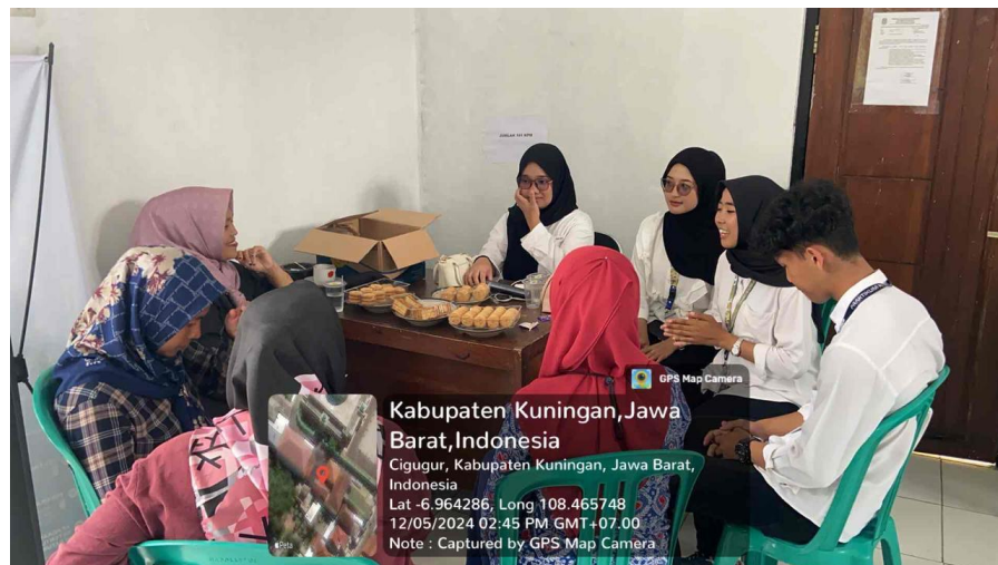
Foto 4. 13 Kegiatan Evaluasi Program Bersama TKM

Sumber : Hasil kegiatan evaluasi praktikan