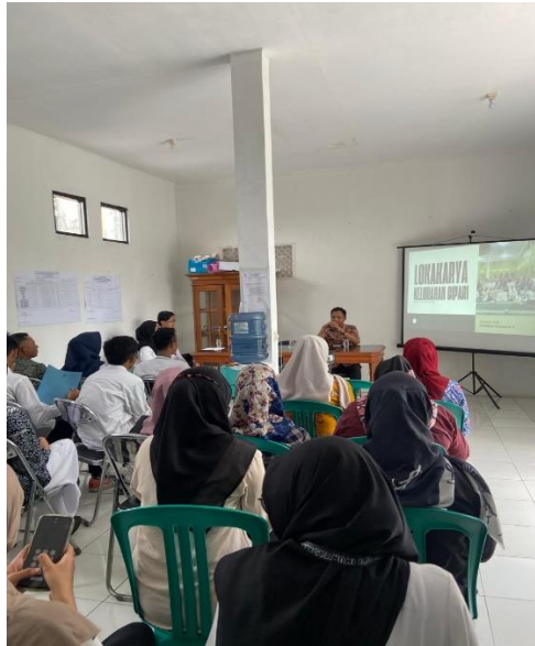
Foto 4. 14 Kegiatan Lokakarya di Kelurahan Cipari