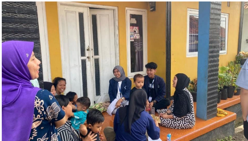
Foto 4. 11 Kegiatan Penyuluhan Kepada Orang Tua

Setelah dilakukannya pemberian materi dan pelatihan kepada para kader posyandu, selanjutnya dilaksanakan penyuluhan oleh kader posyandu kepada para orang tua di posyandu Sukarame. Kegiatan ini dilaksanakan pada hari Jum'at, 29 November 2024. Kegiatan penyuluhan ini dilakukan setelah pemeriksaan kesehatan anak balita, para orang tua dikumpulkan di dalam ruangan