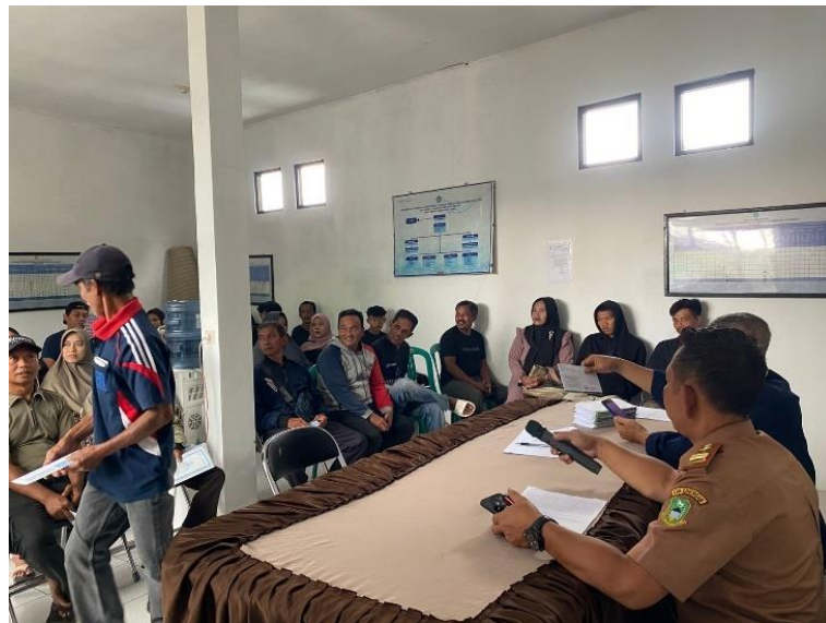
Foto 5. 7 Kegiatan Verifikasi Data dan Penyaluran BPJS

Kegiatan ini dihadiri oleh pendamping TKSK, Lurah, Kasi Kestra serta peserta penerima BPJS. Kegiatan ini sekaligus sosialisasi mengenai kartu BPJS elektronik sehingga masyarakat harus mencetak kartu BPJS sendiri. Kegiatan ini juga menjadi wadah masyarakat untuk berkonsultasi terkait Kendal-kendala yang ditemui di lapangan. Praktikan berperan sebagai bagian dari dokumentasi kegiatan.