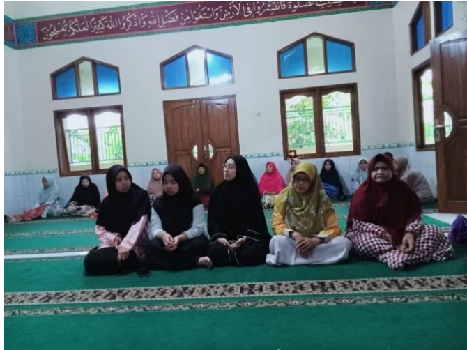
Foto 5. 4 Kegiatan Pengajian di Lingkungan Sukamanah

Kegiatan pengajian ini rutin dilaksanakan di setiap musholla lingkungan Kelurahan Cipari. Pengajian ini dibuka dengan pembacaan shalawat serta puji – pujian dan dilanjutkan dengan ceramah yang dilakukan oleh Ustadz di lingkungan tersebut. Praktikan dalam kegiatan ini sebagai jamaah pengajian.