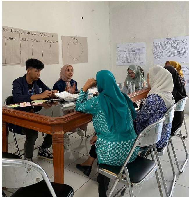
Foto 4. 8 Kegiatan Pelaksanaan ToP