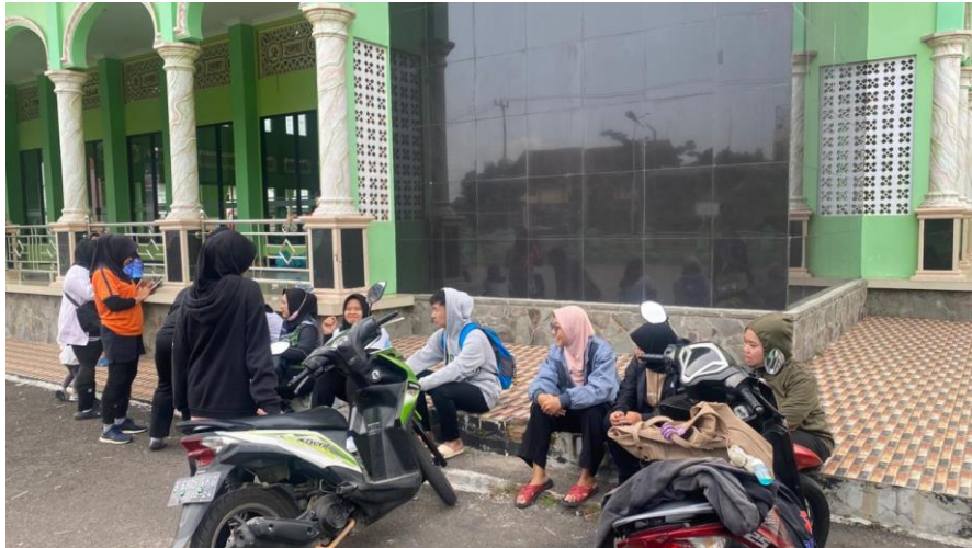
Foto 4. 3 Community Involvement Olahraga Bola Voly