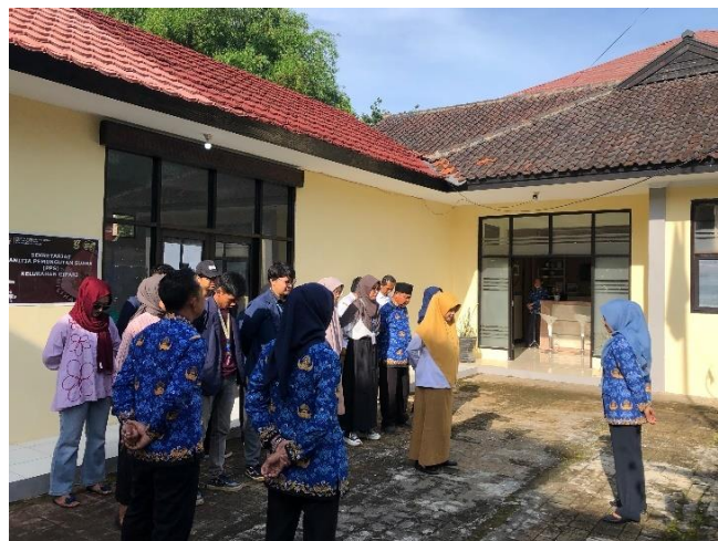
Foto 5. 5 Kegiatan Apel Pagi

Kegiatan apel pagi ini dilaksanakan setiap hari Senin di Kantor Kelurahan Cipari dengan dihadiri oleh perangkat kelurahan. Praktikan dalam kegiatan berperan sebagai peserta apel pagi.