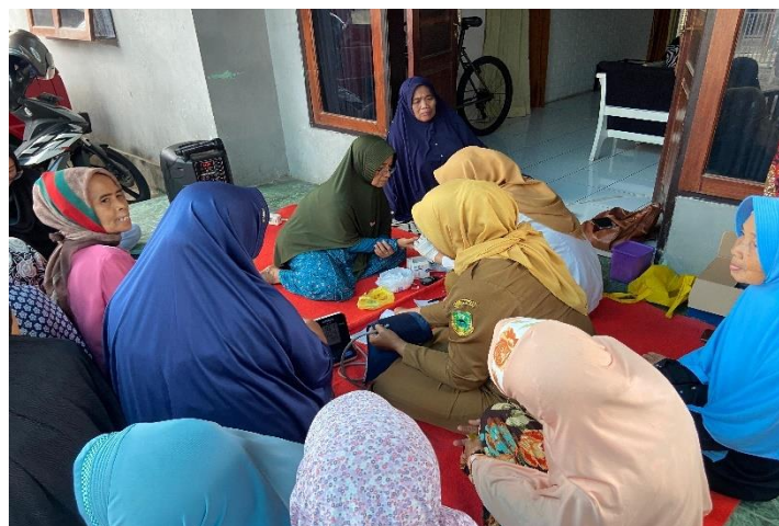
Foto 5. 3 Kegiatan Posyandu Lansia

Kegiatan ini di laksanakan di lingkungan Sukasari dan Sukarame. Pelaksanaan kegiatan ini meliputi praktikan, bidan kelurahan serta kader Posbindu. Kegiatan ini berupa pemeriksaan kesehatan lansia yang meliputi pengukuran tinggi badan, berat badan, lingkar pinggang serta cek gula darah. Praktikan melakukan penyuluhan mengenai Penyakit Tidak Menular kepada para lansia. Selanjutnya kegiatan ditutup dengan gerakan sehat lansia yaitu Senam Lansia untuk mengajak lansia bergerak sehat. Praktikan berperan sebagai seksi dokumentasi kegiatan posyandu lansia.