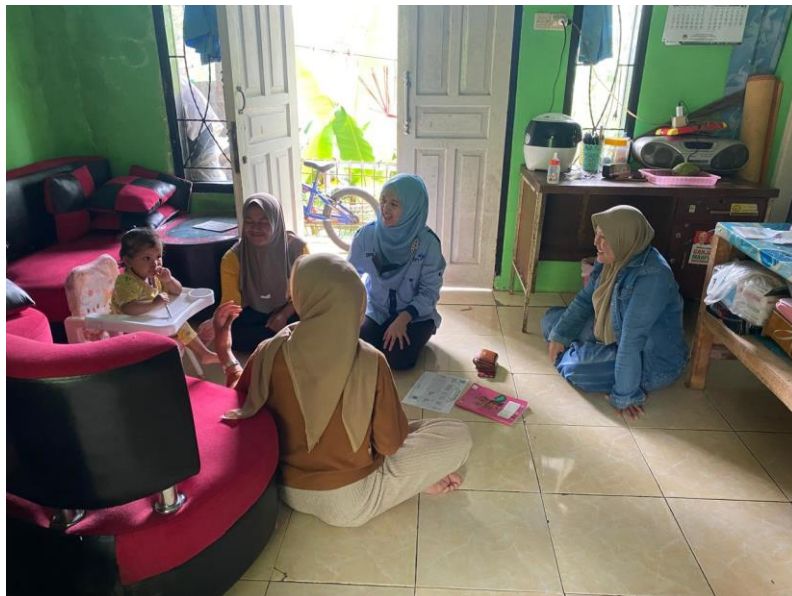
Foto 4. 7 Kegiatan Wawancara dan Observasi ke Rumah Orang Tua Bersama PLKB

tua yang mempunyai anak balita sebanyak 25% dengan jumlah 13 orang dari total jumlah 55 orang bersama dengan kader posyandu dan PLKB. Kunjungan ini dilakukan sekaligus memberikan pemahaman dan pengenalan mengenai pengasuhan anak.