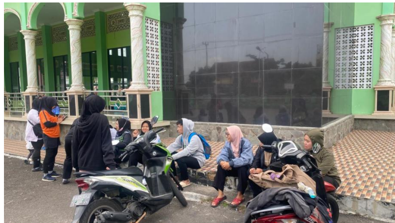
Foto 5. 8 Kegiatan Olahraga Bola Volly

Kegiatan ini merupakan kegiatan rutin olahraga para remaja sekaligus ibu-ibu di lingkungan Sukarame. Kegiatan ini merupakan salah satu bentuk aktivitas olahraga yang bertujuan untuk membangun semangat kebersamaan, mempererat tali silaturahmi antarwarga, serta mendukung gaya hidup sehat. Praktikan dalam kegiatan ini ikut berpartisipasi bermain bola voli dengan masyarakat.