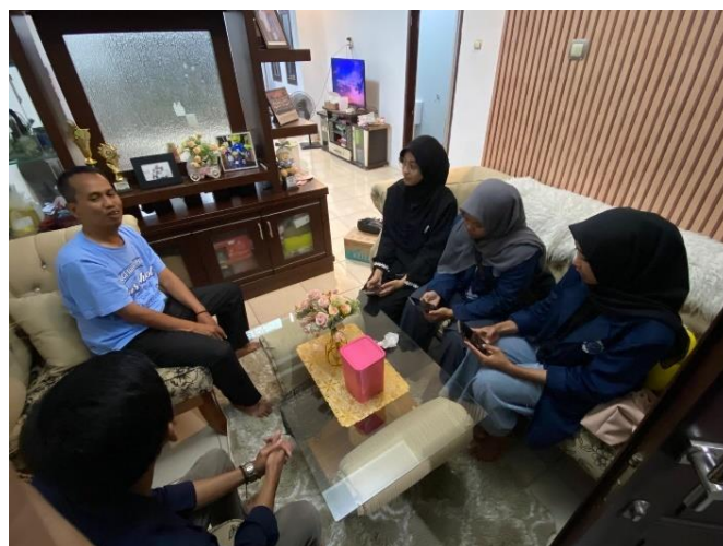
Foto 4. 1 Kegiatan Home Visit di Rumah Ketua RW 7