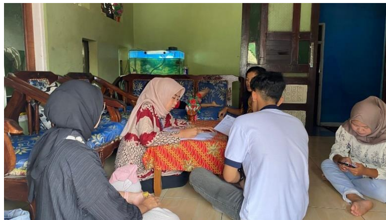
Foto 5. 9 Kegiatan Home Visit ke Rumah Orang Tua

Kegiatan ini bertujuan untuk mehami langsung keluarga, mengidentifikasi kebutuhan, dan memberikan edukasi tentang pengasuhan anak. Kunjungan dimulai dengan pendekatan ramah untuk membangun kepercayaan dan kenyamanan keluarga. Praktikan menanyakan poin – poin yan terdapat di dalam form asesmen audit kepada para orang tua. Praktikan juga melakukan observasi terhadap kondisi lingkungan rumah seperti keberhasilan, ketersediaan air bersih, dan pengasuhan yang diterapkan orang tua.