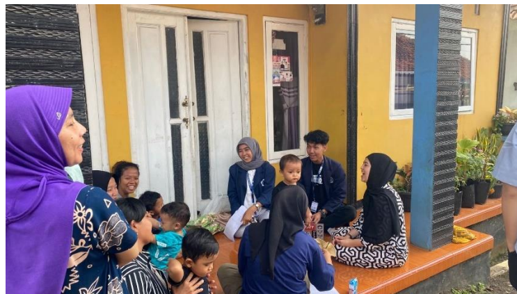
Foto 5. 1 Kegiatan Posyandu Balita

Kegiatan ini rutin dilaksanakan setiap bulan di setiap lingkungan yang ada di Kelurahan Cipari. Praktikan mengikuti kegiatan posyandu balita di lingkungan Musium, Sukarame, dan Sukamanah. Kegiatan ini meliputi kegiatan pemeriksaan kesehatan berupa pengukuran tinggi badan, berat badan, lingkaran lengan, lingkaran kepala serta penyuluhan mengenai KB kepada ibu-ibu yang mempunyai anak balita. Praktikan berperan sebagai fasilitator kegiatan penyuluhan pengasuhan anak.