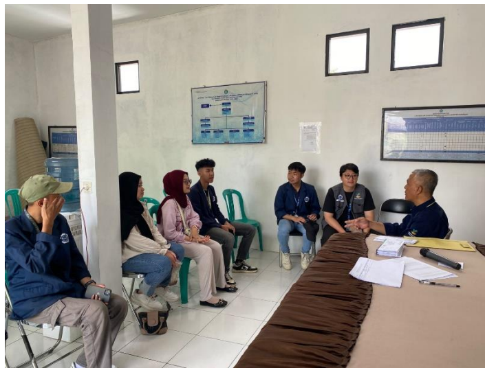
Foto 4. 2 Percakapan Sosial Bersama Pendamping TKSK

2. Percakapan Sosial, bertujuan untuk membangun hubungan, memahami situasi, serta mendorong partisipasi dan kolaborasi serta menggali informasi mengenai permasalahan, kebutuhan dan potensi. Kegiatan ini tidak hanya berfokus pada pengumpulan informasi, tetapi juga bertujuan untuk membangun akses serta kepercayaan ( trust building ) dengan berbagai elemen masyarakat setempat. Dengan pendekatan yang terbuka dan partisipatif, praktikan berharap dapat mempererat hubungan dengan tokoh masyarakat dan memperoleh dukungan yang diperlukan untuk kelancaran pelaksanaan praktikum komunitas di Kelurahan Cipari.