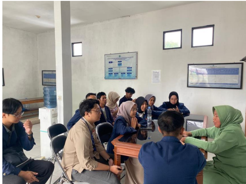
Foto 4. 6 Studi Dokumentasi Bersama Bidang Kelurahan

Praktikan melakukan wawancara, observasi dan studi dokumentasi untuk verifikasi dan validasi berdasarkan hasil dari permasalahan yang sudah diperoleh dari kegiatan rembug warga kepada beberapa pihak terkait. Praktikan juga membagi kategori masalah untuk ditangani oleh setiap praktikan yang nantinya akan dijadikan sebagai rencana tindak lanjut.. Praktikan juga mendapatkan data melalui studi dokumentasi data yang sudah ada.