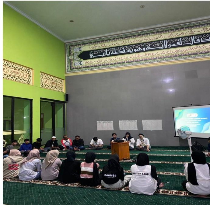
Foto 4. 5 Kegiatan Community Meeting di Kelurahan Cipari

Sasaran kegiatan asesmen meliputi perangkat Kelurahan, Kepala Dusun, RT/RW, kader PKK, dan tokoh masyarakat di Kelurahan Cipari. Pelaksanaan asesmen dilakukan pada hari Sabtu, 9 November 2024, di aula Kelurahan Cipari dengan menggunakan pendekatan Methodology Participatory Assessment (MPA) dan Sustainability Livelihood Asset (SLA) . Praktikan memulai kegiatan dengan penjelasan mengenai permasalahan sosial yang ada di kelurahan, serta tujuan dan teknik pelaksanaan MPA, menekankan bahwa asesmen ini hanya untuk masalah dan potensi yang relevan dengan komunitas, bukan masalah pribadi.