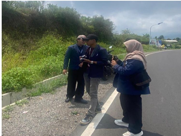
Foto 5. 10 Kegiatan Pembuatan Video Profil Kelurahan

Sebagai bagian dari kegiatan praktikum komunitas, praktikan turut berperan aktif dalam proses pembuatan video profil Kelurahan. Tujuan utama pembuatan video ini adalah untuk menggambarkan potensi, kegiatan, dan inovasi Kelurahan dalam mendukung pembangunan berbasis masyarakat, sekaligus sebagai media promosi untuk menarik perhatian berbagai pihak, termasuk pemerintah daerah dan mitra swasta. Peran praktikan dalam kegiatan adalah sebagai tim produksi baik pengambilan footage, editing, sampai pembuatan voice over.