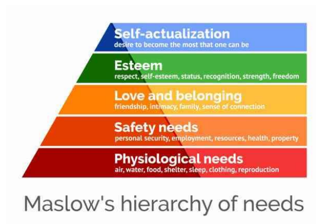
Gambar 2. 1 Hierarki Kebutuhan Menurut Abraham Maslow