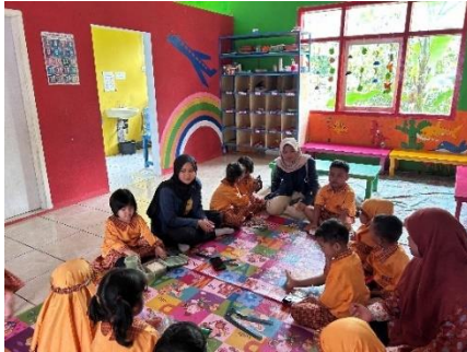
Kunjungan ke PAUD