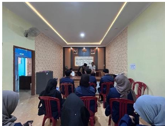
Foto 4.1 Penerimaan di Kantor Desa Ciketak

Kegiatan ini dilaksanakan pada tanggal 29 Oktober 2024 di Kantor Desa Ciketak, dimana dalam acara ini praktikan disambut oleh Kepala Desa Ciketak sendiri. Kepala desa Ciketak menyambut baik kedatangan praktikan, selain itu juga kepala desa Ciketak menjelaskan kondisi desa Ciketak itu sendiri seperti tentang kehidupan warganya, permasalahan di Desa, dll. pada tahap ini juga mahasiswa menyampaikan kepada aparat desa tentang tujuan dari praktikum komunitas ini.