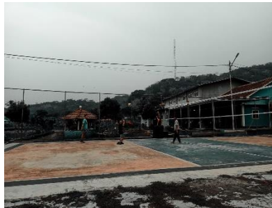
Foto 5.6 Berolahraga Voli

Kegiatan ini merupakan kegiatan refreshing yang dilaksanakan oleh remaja-remaja di Desa Ciketak setiap sore hari. Praktikan disini turut serta bermain dengan remaja-remaja. Hal itu dapat membangun relasi dengan para remaja di Desa Ciketak.