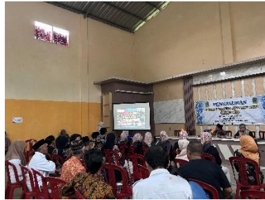
Foto 4.4 Sosialisasi PMKS dan PSKS

Kegiatan ini, praktikan bersama-sama melakukan kegiatan sosialisasi PPKS dan PSKS. Selain itu praktikan juga menjelaskan tujuan praktikum komunitas kepada Masyarakat. Kegiatan ini dilaksanakan pada tanggal 5 November 2024. Kegiatan ini dihadiri oleh 17 peserta dari PKK, Rt, dan aparat desa.