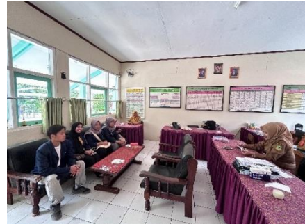
Kunjungan Ke SDN Ciketak