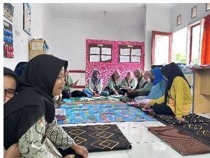
Foto 5.5 kelas Ibu Hamil

Kelas ibu hamil merupakan salah satu kegiatan yang diadakan oleh posyandu Desa Ciketak yang bertempat di Poskesdes. Kegiatan ini