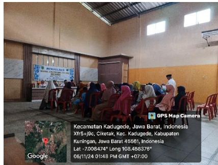
Foto 5.2 Pembagian BLT-DD

Kegiatan ini adalah salah satu program dari Desa Ciketak untuk membantu warga yang masih membutuhkan bantuan. Untuk program ini difokuskan untuk warga yang belum mendapatkan bantuan dari pihak lain dan memang membutuhkan. Disini praktikan mengikuti kegiatan tersebut untuk mengetahui tentang program bantuan yang diberikan dari Desa Ciketak. Kegiatan ini dilaksanakan pada hari Selasa, tanggal 5 November 2024.