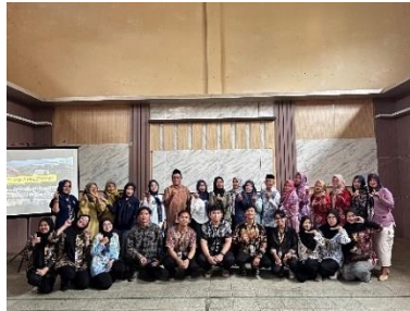
Foto 4.9 Lokakarya Desa

Terminasi merupakan tahap pengakhiran atau pemutusan hubungan dengan Masyarakat secara formal. Praktikan melakukan rujukan untuk melanjutkan proses perubahan kepada pihak-pihak yang berpengaruh dan berkompeten untuk melanjutkan intervensi. Pada tahap ini terbagi menjadi dua tahap yaitu: