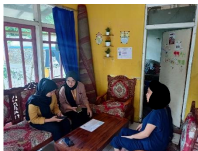
Foto 5.7 Pembagian Bantuan Sosial

Pemberian bantuan Sosial merupakan salah satu program yang Kementerian Sosial yang dititipkan ke mahasiswa praktikan yang sedang menjalani praktikum komunitas di Desa Ciketak untuk mencari calon penerima manfaat untuk nantinya akan diasesmen. Proses kegiatan tersebut antara lain: