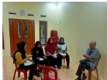
Bimbingan dengan Supervisor