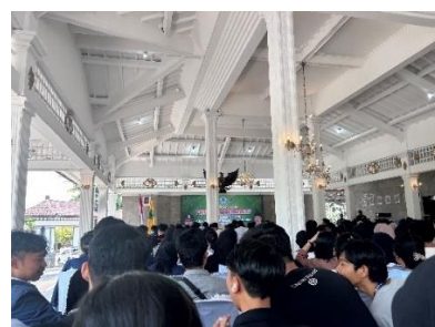
Penerimaan di Kabupaten