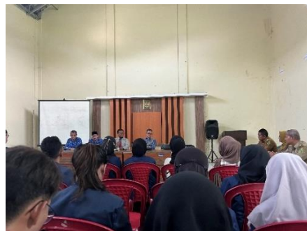
Penerimaan di Kecamatan Kadugede