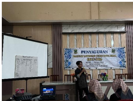
Foto 4.5 Asesmen Lanjutan Bersama Warga