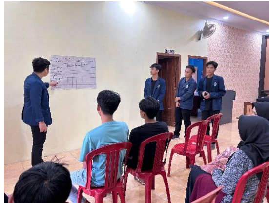
Foto 4.6 Asesmen Lanjutan Bersama Karang Taruna

Setelah melakukan asesmen awal yang dimana telah didapati berbagai permasalahan, maka praktikan memilih salah satu permasalahan yaitu masalah Karang taruna yang kurang efektif dengan target groupnya yaitu karang taruna Desa Ciketak itu sendiri. Asesmen lanjutan dilakukan oleh praktikan dengan bertujuan untuk mendalami lagi permasalahan yang dialami oleh karang taruna sehingga disebut kurang efektif oleh warga Desa Ciketak. Kegiatan ini dilaksanakan pada tanggal 21 November 2024. Dalam kegiatan ini praktikan mengumpulkan perwakilan dari karang taruna itu sendiri untuk mendiskusikan terkait penyebab yang membuat karang taruna berjalan kurang efektif. Dalam melakukan asesmen lanjutan, praktikan menggunakan teknik Community meeting , setelah melakukan asesmen didapati permasalahan yang menyebabkan karang taruna berjalan kurang efektif yaitu Inovasi Kegiatan, Kapasitas SDM, dan Keberlanjutan organisasi. Pada tahap ini praktikan mengambil focus permasalahan tentang kapasitas SDM Karang Taruna Desa Ciketak.