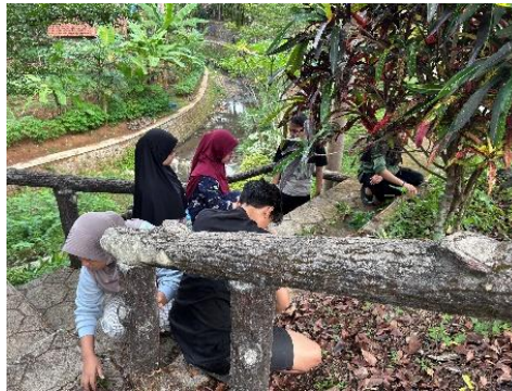
Foto 5.1 Jum'at Bersih

Kegiatan jum'at bersih merupakan kegiatan rutin di Desa Ciketak yang dilaksanakan setiap dua minggu sekali. Dimana warga akan membersihkan halaman sekitar rumah mereka masing-masing, setelah itu Sebagian bapak-bapak yang merupakan warga Desa Ciketak akan membersihkan lingkungan sekitar balai desa Ciketak bersama aparat desa lain.