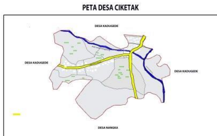
Gambar 3.1 Peta Wilayah Desa Ciketak

Desa Ciketak merupakan Desa Ciketak adalah salah satu desa di Kecamatan Kadugede, Kabupaten Kuningan, Jawa Barat. Desa ini memiliki luas wilayah sekitar 66,4 hektare lahan penduduk 20,4 Ha, Lahan Pertanian 22 Ha, dan lahan hutan rakyat 24 Ha. Desa Ciketak terbagi menjadi 2 dusun dengan 8 RT dan 2 RW. Jumlah penduduknya sekitar 1.512 jiwa, yang terdiri dari 759 laki-laki dan 752 perempuan. Desa ini memiliki 602 kepala keluarga.