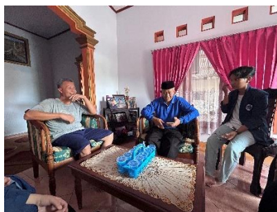
Foto 4.3 Transect Walk

Setelah melaksanakan kegiatan penerimaan di Kantor Desa Ciketak, praktikan melakukan transect walk dan home visit ke setiap wilayah Desa Ciketak, selain itu praktikan juga mengunjungi stackholder