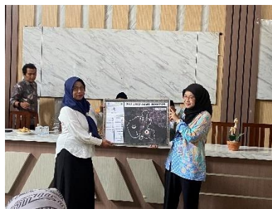
Foto 5.8 Pengabdian Masyarakat

Kegiatan ini merupakan kegiatan pengabdian Masyarakat, dimana pembuatan peta persebaran sistem sumber yang ada di Desa Ciketak yang bertujuan agar aparat dan warga desa mengetahui persebaran system sumber yang ada di Desa Ciketak dan dapat memanfaatkannya. Dalam prosesnya praktikan menemui aparat desa untuk meminta data-