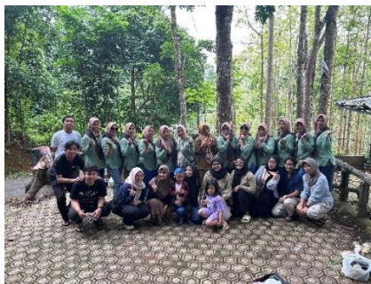
Kegiatan dengan ibu PKK