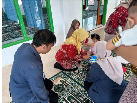
Foto 5.4 Posyandu

Kegiatan ini merupakan kegiatan rutin yang dilaksanakan oleh Poskesdes Desa Ciketak, dimana kegiatan ini berlangsung selama 2 hari yaitu pada tanggal 12 dan 13 November 2024. Dihari pertama kegiatan posyandu difokuskan untuk balita yang terbagi di dua wilayah yaitu di dusun Ciketak dan dusun Bojong. Dihari pertama praktikan turut serta membantu untuk mengukur tinggi badan balita, menginput data, memberikan obat cacing ke balita, dll. untuk dihari kedua kegiatan posyandu dilaksanakan di Pendidikan Anak Usia Dini Desa Ciketak, kegiatan in difokuskan untuk anak-anak yang ada di PAUD. Praktikan disini turut mengikuti kegiatan untuk membangun relasi dengan anak-anak PAUD.