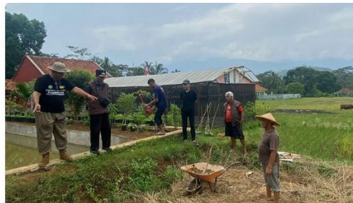
Foto 5.3 Kelompok Wanita Tani

Kegegiatan tersebut merupakan salah satu program dari Desa Ciketak untuk memperdayakan petani Desa Ciketak. Kegiatan ini mengundang narasumber yang merupakan ahli dalam bidang pertanian, disini petani diberi penyuluhan tentang pertanian dan peternakan, setelah melaksanakan penyuluhan lalu dilanjutkan pelatihan pembuatan pupuk dari kotoran hewan dan mikroorganisme yang dapat membantu penyuburan tanah. Disini praktikan mengikuti kegiatan tersebut agar praktikan mendapatkan ilmu tambahan mengenai pertanian dan agar