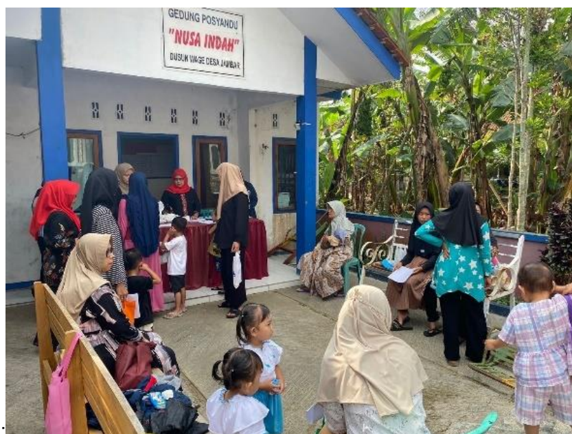
Foto 4. 3 Community Involvement

Kegiatan ini bertujuan untuk memperkenalkan diri secara langsung, menjalin relasi, berbaur dan membangun kepercayaan dari masyarakat. Dalam kegiatan ini, praktikan secara aktif ikut terlibat dalam berbagai kegiatan masyarakat yang ada di Desa Jambar, Melalui keterlibatan langsung dalam berbagai kegiatan ini, praktikan tidak hanya belajar tentang dinamika sosial yang terjadi di Desa Jambar, tetapi juga membangun hubungan yang kuat dengan masyarakat. Dengan cara ini, praktikan dapat meningkatkan kepercayaan dan menciptakan ruang yang aman bagi masyarakat untuk berbagi masalah dan mencari solusi bersama. Selain itu, kegiatan ini juga menjadi sarana untuk mengedukasi masyarakat mengenai pentingnya kebersihan dan pengelolaan sampah yang berkelanjutan demi terciptanya lingkungan yang lebih bersih dan sehat. Berikut rincian dari kegiatan yang diikuti oleh praktikan :