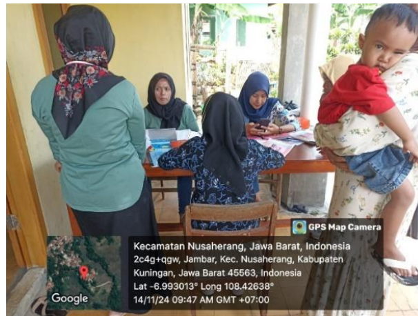
Foto 5. 3 Kegiatan Posyandu