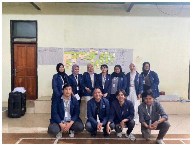
Foto 4. 5 Rembug Warga

Praktikan melakukan community meeting atau rembug warga di Aula Desa Jambar. Kegiatan rembug warga ini dihadiri oleh beberapa stakeholder dan warga di 5 Dusun yang ada di Desa Jambar. Rembug warga ini dilaksanakan menggunakan teknik Method of Participation Assesment (MPA). Teknik ini bertujuan untuk mengidentifikasi atau menemukan kebutuhan dan potensi yang ada didalam maupun diluar masyarakat. Teknik ini dilakukan dengan melakukan rembug warga pada Kamis, 09 November 2024. Fokus dari pelaksanaan kegiatan rembug warga ini adalah untuk mencari tahu masalah, kebutuhan, dan PSKS yang ada di Desa Jambar yang kemudian hasil dari asesmen awal ini di rekap oleh kelompok praktikan, di didapati PPKS dan PSKS secara detail sebagai bahan penentuan fokus intervensi.