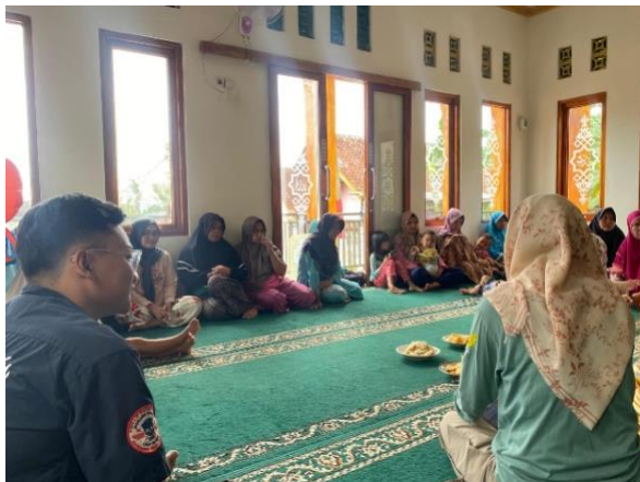
Foto 4. 8 kegiatan penyuluhan II dilaksanakan oleh pihak Dinas terkait yaitu UPTD Dinas Pertanian