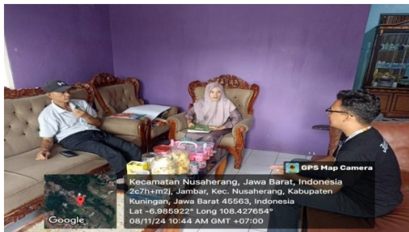
Foto 4. 1 Proses Dialog

Pelaksanaan Praktikum komunitas praktik pekerjaan sosial makro di Desa Jambar dimulai dengan tahap dialog. Tujuan dari dialog adalah memahami karakteristik masyarakat, membangun relasi dengan masyarakat, sehingga terbangun kepercayaan, penerimaan serta kesiapan dan kesepakatan untuk bekerja sama dalam melakukan perubahan masyarakat. Kegiatan dilaksanakan pada tanggal 28 hingga 3 november 2024. Kegiatan-kegiatan yang dilakukan oleh praktikan antara lain: