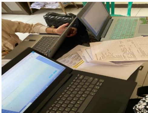
Foto 5. 2 Menginput Data SDGs

Praktikan diminta untuk menginput data SDGs di balai desa Jambar. Praktikan melaksanakan penginputan data setiap hari secara bergantian dijam kerja dari jam 09.00-12.00 Wib. Terdapat banyak KK yang hampir belum terinput dan terupdate dari 3 tahun sebelumnya.