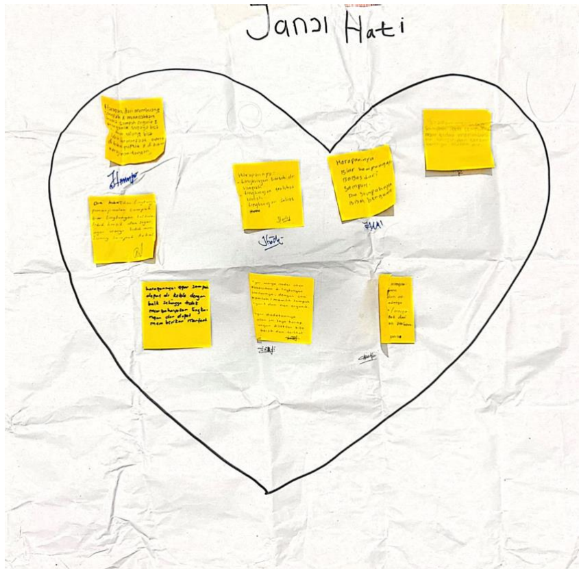
Lampiran 1. 6 Janji Hati