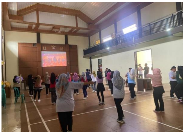
Foto 5. 1 Kegiatan Senam