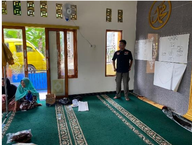
Foto 4. 7 Penyusunan Rencana Intervensi bersama ibu KWT