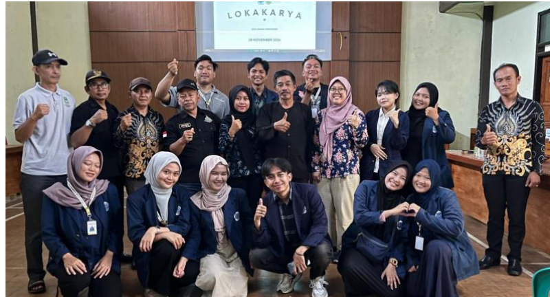
Foto 5. 5 Lokarya Desa