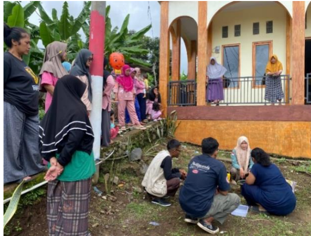
Foto 4. 9 Pemberdayaan mengenai pengelolaan sampah organik menjadi kompos.

Didalam kegiatan pemberdayaan tersebut peran praktikan sebagai broker dengan menghubungkan ke Dinas terkait yaitu UPTD Dinas Pertanian dan juga kegiatan pemberdayaan tersebut dihadiri oleh berbagai kelompok masyarakat, seperti TKM, Lansia, Pemuda, Kelompok Wanita Tani, dan juga orang tua dan adapun untuk jadwal kegiatan yang akan dilaksanakan sebagai berikut: