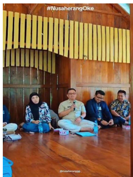
Foto 5. 6 Lokarya Kecamatan