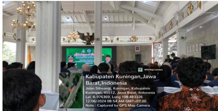
Foto 5. 7 Lokarya Kabupaten

Kegiatan ini adalah bentuk Tanggung jawab Praktikan yang telah berkegiatan selama 40 hari di Kabupaten Kuningan, dengan memaparkan Program dan Hasil program yang telah dilakukan, kegiatan ini dilakukan di Kantor Bupati Kuningan pada hari Jumat 06 Desember 2024, kegiatan ini sekaligus Menjadi penutu Praktikum Komunitas 2024.