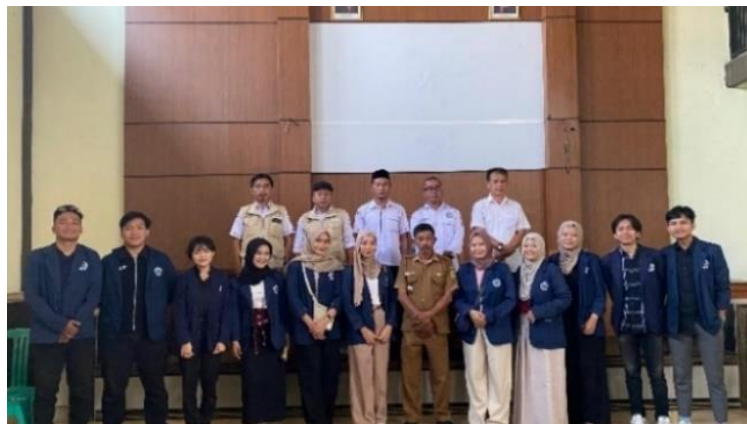
Foto 4. 2 Kunjungan ke desa

tersebut berupa profil desa, data warga miskin yang tercantum dalam Basis Data Terpadu (BDT), data tersebut diperoleh dari Kasi Kestra Desa.