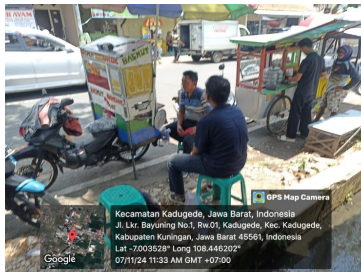
Foto 4. 4 Home Visit

rasa kepercayaan dan keakraban serta menjelaskan maksud dan tujuan praktikan selama 40 hari kedepan dalam rangka persiapan dalam bekerjasama dan mendefinisikan tujuan bersama.