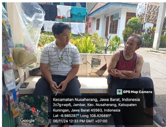
Foto 4. 6 Wawancara dengan masyarakat desa

Selain dengan melakukan rembug warga, praktikan juga melakukan asesmen awal melalui wawancara dengan tokoh masyarakat, aparat desa maupun masyarakat. Praktikan melakukan wawancara disela-sela kegiatan Masyarakat seperti gotong royong, saat kegiatan posyandu, pengajian, rapat dan lain-lain. Wawancara bertujuan untuk memperoleh informasi mengenai permasalahan dan potensi/sumber yang terdapat di Desa Jambar. Praktikan melakukan wawancara dengan bertanya langsung kepada tokoh masyarakat, aparat desa maupun masyarakat khususnya ketua RT dan kepala dusun mengenai masalah sosial dan potensi apa yang ada di Desa Jambar