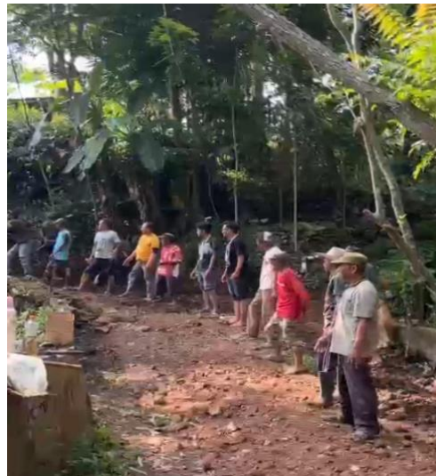
Foto 5. 4 Kerja Bakti Bersama warga

Praktikan melakukan kegiatan Kerja Bakti bersama warga di Dusun Kliwon, kegiatan tersebut diikuti oleh praktikan dan juga masyarakat yang ada di Dusun Kliwon, kegiatan Kerja Bakti tersebut diikuti oleh praktikan agar bisa menjalin kedekatan antara praktikan dan juga masyarakat yang ada di Dusun Kliwon.