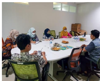
9 Februari 2023