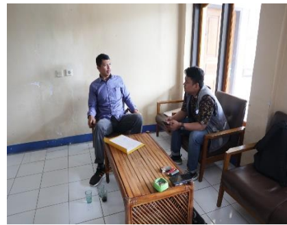
2 Februari 2023