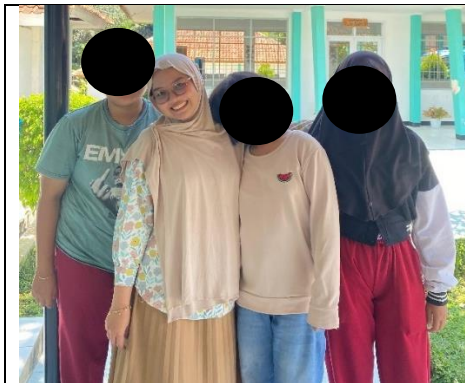
Keterangan : Foto Bersama Subjek Penelitian