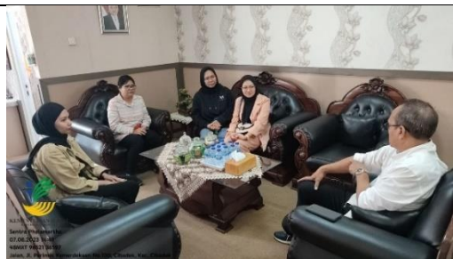
Keterangan : Kegiatan Perizinan dengan Kepala Sentra