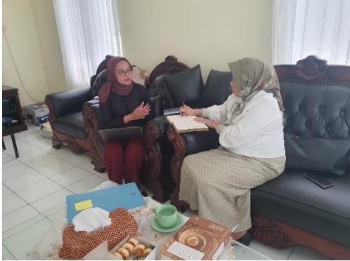
Keterangan : Kegiatan Bimbingan