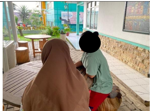
Keterangan : Evaluasi dengan Subjek Penelitian