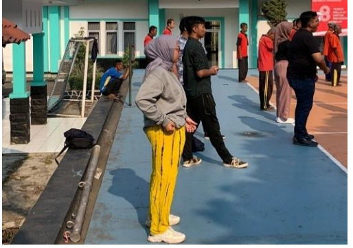
Keterangan : Kegiatan Observasi Penelitian