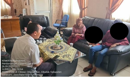
Keterangan : Kegiatan Monitoring Intervensi dengan Peksos