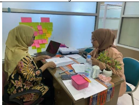
Keterangan : Kegiatan Bimbingan