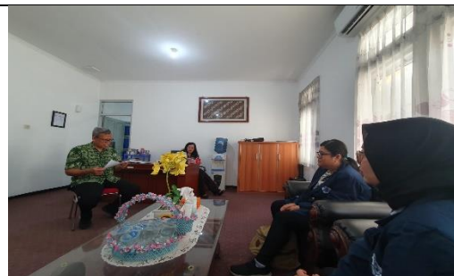
Keterangan : Kegiatan Perizinan dengan Kasubag TU