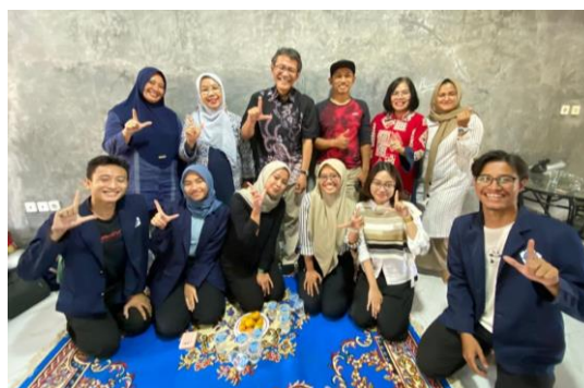
Gambar 1.3 Supervisi Lapangan Pertama

Supervisi pertama dilaksanakan pada Selasa, 31 Oktober 2023, bertepatan pada hari pertama praktikan sampai di lokasi Praktikum Komunitas, yaitu Desa Cihaurkuning. Supervisi pertama ini meliputi pemberian wejangan-wejangan dari dosen pembimbing terhadap kelompok praktikan.