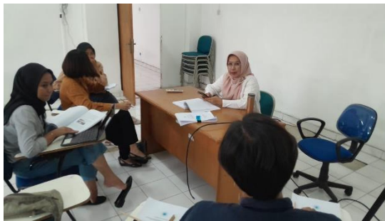
Gambar 1.7 Supervisi Pasca Lapangan

Supervisi pasca lapangan dilaksanakan pada Kamis, 14 Desember 2023 di Kampus Poltekesos Bandung. Supervisi ini meliputi penyerahan draft laporan yang sebelumnya sudah disusun oleh praktikan untuk selanjutnya diperiksa oleh dosen pembimbing. Pada kegiatan ini praktikan mendapatkan masukan untuk melakukan beberapa penyempurnaan pada laporan praktikum sebelum lanjut ke tahap ujian.