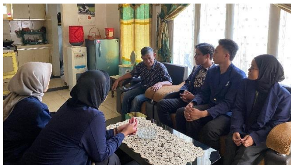
Gambar 4.4 Mengunjungi Rumah Bapak RW 01

Home Visit dilakukan dengan mengunjungi rumah tokoh masyarakat seperti ketua RW, Ketua RT dan Kepala Desa. Pada tahapan pengorganisasian sosial melalui home visit praktikan memperkenalkan diri terlebih dahulu kemudian melakukan penggalian informasi mengenai kegiatan atau tugas, fungsi dan struktur dari organisasi yang ada di Desa Cihaurkuning. Praktikan juga menyampaikan kepada tokoh masyarakat atau perwakilan organisasi untuk meminta dukungan dan kerjasama menggerakkan masyarakat dalam pelaksanaan praktikum komunitas.