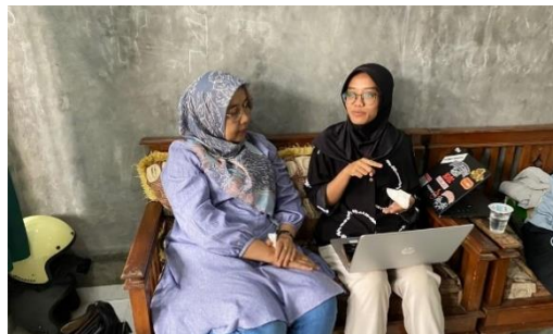
Gambar 1.5 Supervisi Lapangan Ketiga

Supervisi ketiga dilaksanakan pada Sabtu, 25 November 2023 di basecamp praktikan yang berlokasi di Desa Cihaurkuning. Supervisi meliputi pembahasan dari rencana intervensi yang telah disusun serta perencanaan pelaksanaan intervensi yang akan dilakukan oleh praktikan.