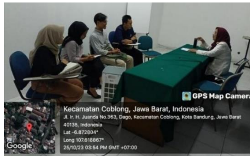
Gambar 1.1 Bimbingan Pra-Lapangan 1

Selanjutnya pelaksanaan bimbingan pra-lapangan kedua dilaksanakan pada tanggal 30 Oktober 2023 secara daring melalui Zoom . Pembekalan ini ditujukan untuk memeriksa kesiapan praktikan sebelum berangkat ke Kabupaten Garut. Kesiapan mengenai pemahaman praktikan tentang kajian literatur yang sudah disusun serta kebutuhan-kebutuhan lain yang perlu dibawa ke Garut.