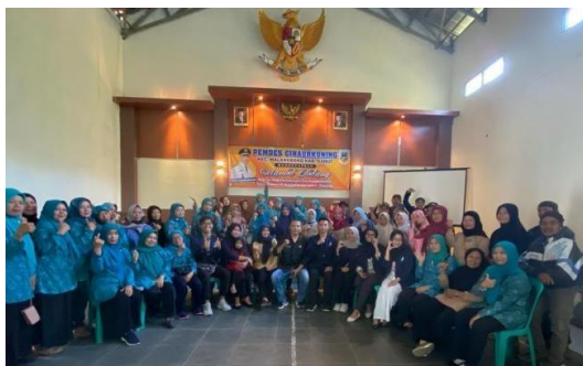
Gambar 1.11 Kegiatan Inisiasi Sosial

Inisiasi sosial merupakan tahap awal pada proses kegiatan Praktikum Komunitas praktik pekerjaan sosial. Inisiasi Sosial yaitu kegiatan yang dilakukan agar praktikan dapat diterima di dalam komunitas atau masyarakat untuk membangun kepercayaan masyarakat sehingga nantinya dapat diajak untuk bekerjasama untuk membangun kesepakatan bersama masyarakat dan stakeholders dalam rangka mengidentifikasi masalah, serta kebutuhan. Praktikan melakukan perkenalan secara formal di kantor Desa Cihaurkuning yang dihadiri oleh lembaga masyarakat, kader dan PKK Desa Cihaurkuning.