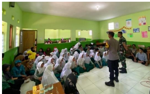
Gambar 1.15 Pelaksanaan Intervensi

Proses pelaksanaan intervensi dilakukan pada tanggal 29 November 2023 di MIS An-Nur. Kegiatan pelaksanaan intervensi ini melibatkan seluruh Masyarakat RW 04 untuk turut berpartisipasi aktif dalam seluruh rangkaian kegiatan yang dilaksanakan.