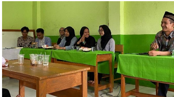
Gambar 4.3 Kegiatan Pengajian Rutin

Setelah kegiatan pengajian selesai, acara selanjutnya adalah praktikan memperkenalkan diri dan melakukan pendekatan melalui bincang-bincang santai dengan warga yang hadir dalam acara pengajian tersebut.