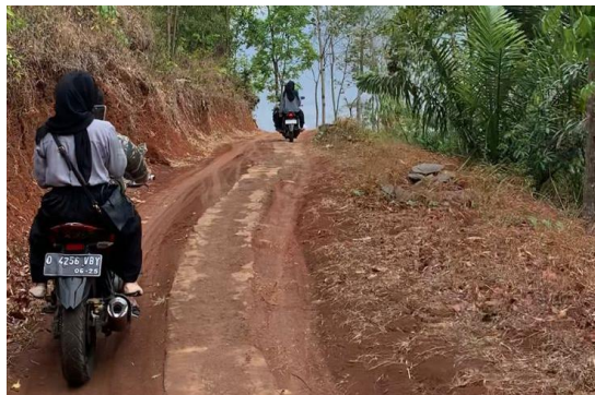
Gambar 4.5 Menelusuri Desa Cihaurkuning

Transect walk dilakukan dengan cara menelusuri wilayah Desa Cihaurkuning dengan tujuan untuk mengenal wilayah serta potensi dan sumber yang ada di wilayah Desa Cihaurkuning. Transect walk dilakukan dengan didampingi oleh Bapak Burhanudin selaku Kesra Desa Cihaurkuning. Melalui kegiatan ini, praktikan mendapatkan banyak informasi mengenai keadaan wilayah disetiap RW yang berbeda serta informasi-informasi lebih mendalam mengenai lokasi yang didatangi.