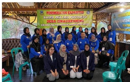
Gambar 4.2 Kegiatan Peningkatan Kapasitas di Pangandaran

Kegiatan peningkatan kapasitas ini merupakan salah satu trobosan kegiatan dari pemerintahan kecamatan Malangbong untuk meningkatkan kualitas kelembagaan. Kegiatan ini diikuti oleh RW, RT, Kepala Dusun, Kader dan PKK Desa Cihaurkuning Praktikan disini turut membantu jalannya kegiatan seperti membantu pada sesi ice breaking maupun pada saat pemberian materi dan diskusi.