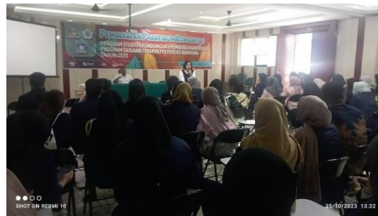
Gambar 1.8 Pembekalan Pertama