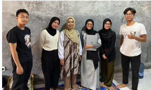
Gambar 1.4 Supervisi Lapangan Kedua

Supervisi kedua dilaksanakan pada Senin, 13 November 2023 di basecamp praktikan yang berlokasi di Desa Cihaurkuning. Supervisi ini meliputi pembahasan hasil pelaksanaan Teknik MPA dan penentuan isu bagi praktikan,