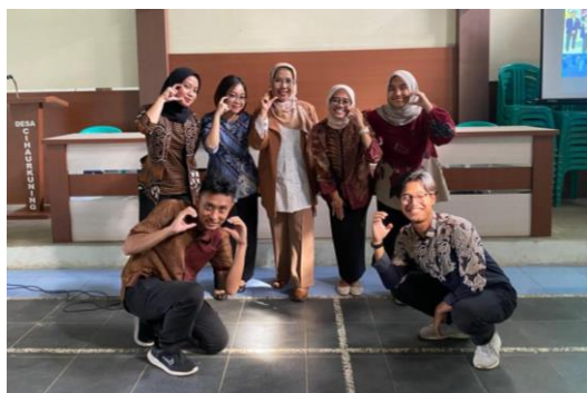
Gambar 1.6 Supervisi Lapangan Keempat

Supervisi keempat dilaksanakan pada Rabu, 7 Desember 2023. Supervisi ini meliputi kegiatan lokakarya di Kantor Desa Cihaurkuning.