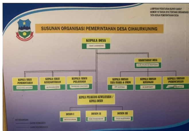
Gambar 3.2 Susunan Organisasi Pemerintahan Desa Cihaurkuning

Berdasarkan Peraturan Menteri Dalam Negeri Republik Indonesia Nomor 84 tahun 2015 tentang Susunan Organisasi dan Tata Kerja Pemerintah Desa, gambar di atas merupakan struktur kepemimpinan di Desa Cihaurkuning.