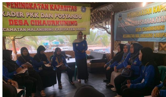
Gambar 1.12 Kegiatan Pengorganisasian Sosial