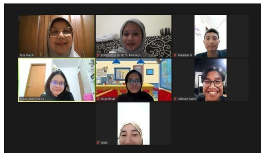
Gambar 1.2 Bimbingan Pra-Lapangan 2

Selanjutnya pelaksanaan bimbingan pra-lapangan kedua dilaksanakan pada tanggal 30 Oktober 2023 secara daring melalui Zoom . Pembekalan ini ditujukan untuk memeriksa kesiapan praktikan sebelum berangkat ke Kabupaten Garut. Kesiapan mengenai pemahaman praktikan tentang kajian literatur yang sudah disusun serta kebutuhan-kebutuhan lain yang perlu dibawa ke Garut.