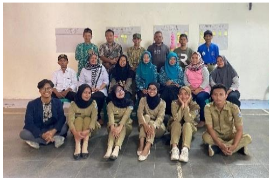
Gambar 1.13 Pelaksanaan MPA

Asesmen sosial merupakan proses dalam mennggali lebih lanjut kendala, kebutuhan, dan juga potensi dansumber yang dimiliki oleh masyarakat. Tahap asesmen terdiri atas asesmen awal dan asesmen lanjutan. Asesmen awal dilaksanakan melalui teknik Methodology Participatory Assesment (MPA) key person dan juga perangkat desa. Asesmen awal dilaksanakan pada tanggal 8 November 2023 di Aula Desa Cihaurkuning.