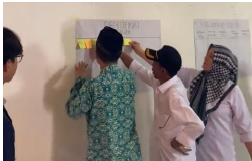
Gambar 4.6 Tahap Pelaksanaan MPA di Desa Cihaurkuning

Praktikan memberikan arahan kepada partisipan untuk bersama-sama menyampaikan permasalahan-permasalahan yang termasuk ke dalam permasalahan sosial yang ada di Desa Cihaurkuning. Selanjutnya, praktikan membagikan meta card yang akan menjadi media untuk menyampaikan permasalahan sosial kepada para partisipan yang hadir, kemudian partisipan diarahkan untuk menuliskan permasalahan yang ada pada meta card yang sudah diberikan oleh praktikan. Setelah menuliskan permasalahan pada meta card , partisipan diarahkan untuk menempelkan meta card tersebut pada kertas plano yang sudah disediakan.