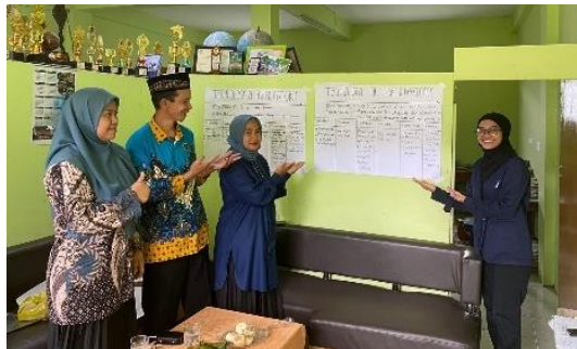
Gambar 1.14 Pelaksanaan ToP