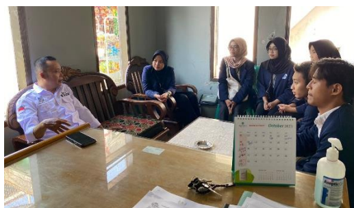
Gambar 4.1 Proses Inisiasi Sosial

Penjajakan dilakukan pada tanggal 1 November 2023 dengan menggunakan teknik wawancara dan observasi di Kantor Desa Cihaurkuning. Pada pertemuan tersebut praktikan menyampaikan maksud dan tujuan dari Pelaksanaan Praktikum Komunitas yang akan dilaksanakan di Desa Cihaurkuning.