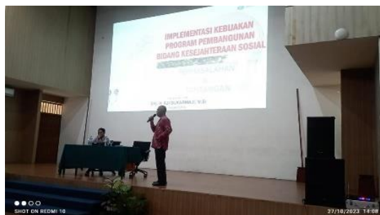
Gambar 1.10 Pembekalan Ketiga

Pembekalan ketiga dilaksanakan pada tanggal 27 Oktober 2023 di Gedung Auditorium Poltekesos. Materi disampaikan oleh Dinas Sosial Kabupaten Garut yang menjelaskan mengenai implementasi kebijakan program pembangunan bidang kesejahteraan sosial, masalah dan tantangan di Kabupaten Garut.