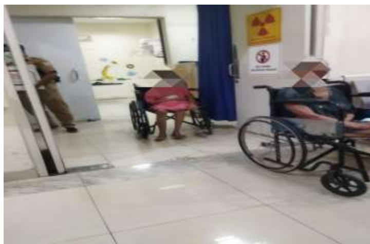
Gambar 21 kegiatan pendampingan rawat jalan

Pada tanggal 10 Juni, praktikan mengikuti kegiatan pendampingan rawat jalan bersama perawat panti ke Rumah Sakit Umum Daerah Duren