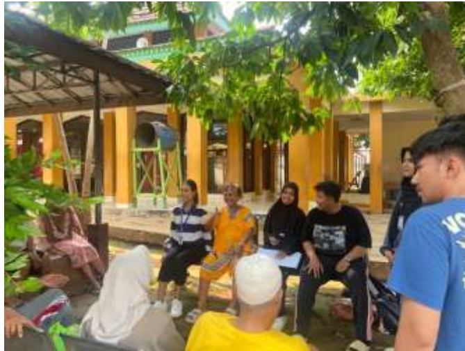
Gambar 18 Mandiri membuat dinamika kelompok bersama WBS

Pada fase mandiri, praktikan diberikan kepercayaan untuk menjalankan proses penilaian kelompok secara lebih mandiri pada tanggal 3 Juni 2025. Praktikan melaksanakan penilaian kelompok dengan pendekatan rekreasi dan diskusi sosial, yang bertujuan untuk mengamati kondisi psikososial para lansia dalam konteks interaksi kelompok. Aktivitas utama yang dilakukan adalah permainan sederhana dengan memutar spidol sambil diiringi musik. Ketika musik terhenti, peserta yang memegang spidol diminta untuk berbagi pengalaman menyenangkan yang pernah dilalui. Keterampilan yang Digunakan oleh Praktikan meliputi: