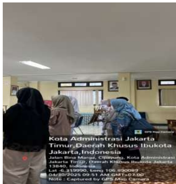
Gambar 17 Melakukan dinamika kelompok bersama WBS

Pada fase penilaian mezzo dengan metode tandem, peserta praktik mulai berperan aktif dalam observasi dan evaluasi aktivitas komunitas lansia di panti. Peserta praktik tidak hanya menjadi pengamat pasif, melainkan turut serta dalam