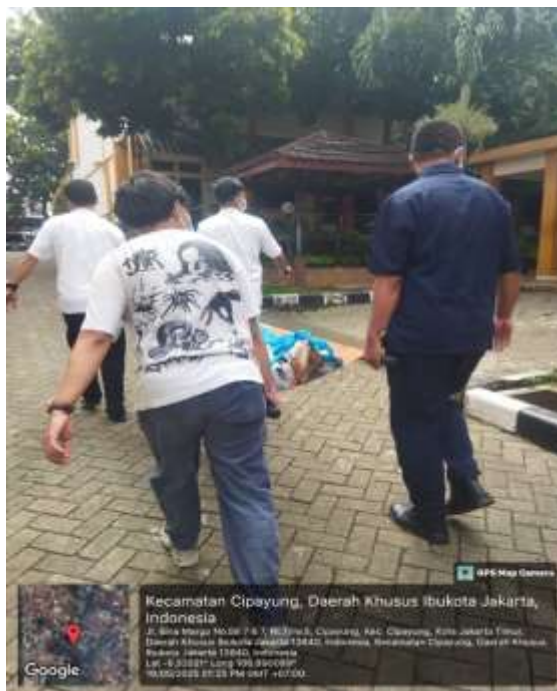
Gambar 24 membantu pegawai mengurus jenazah