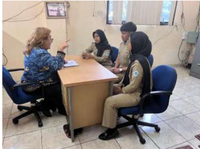
Gambar 19 Asesmen lanjutan terhadap lembaga terkait organisasi bersama Kasubag TU

Selama berlangsungnya praktikum di PSTW, praktikan diberikan tugas untuk terlibat dalam kegiatan evaluasi di tingkat mikro, serta mendapatkan wawasan awal mengenai potensi evaluasi di area komunitas yang ada di sekitar panti. Namun, sampai proses penulisan laporan ini, praktikan belum mendapat peluang untuk melakukan kegiatan observasi atau bekerja sama secara langsung di tingkat masyarakat. Hal ini diakibatkan oleh belum dilaksanakannya evaluasi makro oleh pekerja sosial di lingkungan PSTW selama periode praktikum berlangsung. Pelaksanaan evaluasi di tingkat makro oleh pekerja sosial hingga saat ini masih terfokus pada konteks internal organisasi, seperti pemetaan kebutuhan lansia, pengumpulan informasi, serta penguatan kapasitas pelayanan dalam panti. Situasi ini berpengaruh pada terbatasnya kesempatan praktikan untuk mengamati secara langsung proses evaluasi yang melibatkan masyarakat di sekitar panti, khususnya pada level RT/RW, kelurahan, atau komunitas eksternal yang lainnya. Meskipun demikian, praktikan tetap berusaha mengumpulkan data sekunder dan meneliti konteks sosial lingkungan melalui studi dokumentasi yang ada, serta