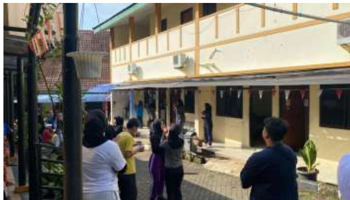
Gambar 20 Senam Pagi

Senam pagi dilaksanakan secara rutin setiap hari Selasa dan Jumat pukul 08.00 WIB sebagai bagian dari program menjaga kesehatan fisik dan meningkatkan kesejahteraan lansia di Panti Sosial Tresna Werdha Budi Mulya 1. Kegiatan ini dipandu oleh instruktur senam profesional yang telah berpengalaman dalam membimbing lansia, sehingga setiap gerakan yang diberikan disesuaikan dengan kemampuan dan kebutuhan para peserta. Pelaksanaan senam berlangsung selama