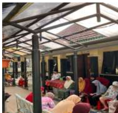
Gambar 7 shadowing terhadap peksos dalam kegiatan berdzikir pagi

Pada fase shadowing di tingkat mezzo yang dilakukan pada 30 April 2025 di depan Wisma Cempaka, praktikan berperan sebagai pengamat reflektif dalam