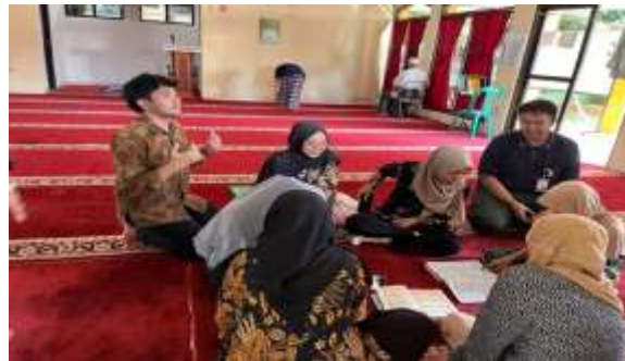
Gambar 9 mandiri membentuk kelompok bersama WBS

Pada kegiatan mandiri yang dilaksanakan Masjid pada tanggal 14 Mei 2025, praktikan memimpin terbentuknya kelompok kecil nonformal yang terdiri dari beberapa warga binaan sosial (WBS) untuk berpartisipasi dalam kegiatan spiritual. Kelompok ini bertujuan untuk memperdalam pengetahuan spiritual dan kegamaan khususnya agama Islam. Praktikan berperan sebagai fasilitator, menggunakan pendekatan inklusif untuk menciptakan suasana yang nyaman agar para lansia merasa dihargai. Dalam pelaksanaan, praktikan berkesempatan untuk menjadi imam sholat dhuha. Kegiatan kerohanian seperti ini dapat menumbuhkan suasana hati yang tenang serta menjadikan amal bagi para lansia di akhirat nanti. Melalui kegiatan kelompok ini, ikatan antara lansia semakin kokoh, dan praktikan mendapatkan pemahaman yang lebih mendalam tentang peranan signifikan intervensi kelompok dalam mendukung kesejahteraan psikososial lansia di dalam lingkungan panti. Praktikan menyadari bahwa kegiatan sederhana seperti sholat