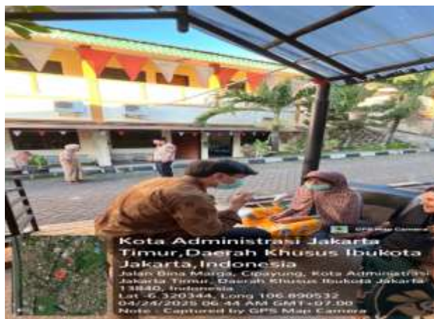
Gambar 6 mandiri small talk dan asesmen awal

Pada tahap pelaksanaan praktik mandiri, praktikan mulai mengaplikasikan berbagai keterampilan dasar pekerja sosial untuk menjalin hubungan profesional dengan klien, terutama dalam konteks keterlibatan awal. Salah satu keterampilan yang diterapkan adalah melakukan percakapan ringan, yang bertujuan untuk menciptakan suasana santai dan membangun kedekatan emosional. Praktikan