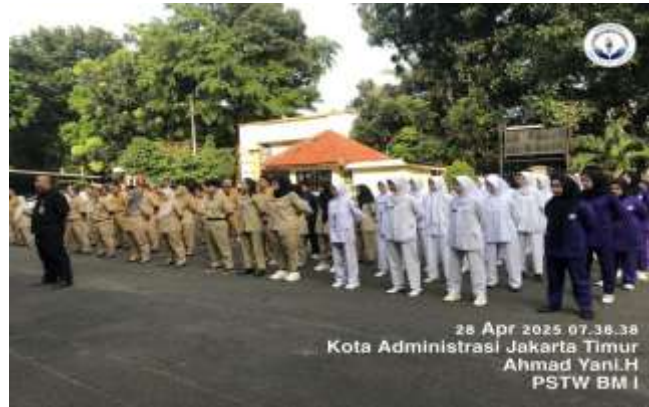
Gambar 11 Apel pagi bersama pegawai dan peksos

Selain melalui metode shadowing , para praktikan juga melaksanakan keterlibatan di tingkat makro dalam format tandem , yang berarti partisipasi langsung dalam aktivitas kelembagaan bersama elemen struktural di Panti Sosial Tresna Werdha Budi Mulia 1. Salah satu contoh kegiatan tersebut adalah keterlibatan aktif para praktikan dalam apel pagi rutin yang diadakan setiap hari Senin di area lapangan utama panti. Kegiatan apel ini diikuti oleh seluruh pihak yang terlibat di panti, mulai dari pekerja sosial, staf administrasi, hingga petugas yang melayani klien secara langsung. Partisipasi para praktikan dalam apel ini dianggap sebagai engagement makro secara tandem karena melibatkan hubungan dengan struktur dan budaya organisasi serta membangun keterlibatan yang bersifat sistemik dalam dinamika kelembagaan. Engagement dalam tandem merujuk pada keterlibatan praktikan yang terjadi bersamaan atau berdampingan dengan pekerja sosial dalam waktu dan ruang yang sama, tanpa mengambil alih peran, melainkan berkolaborasi dalam proses pembelajaran yang bersifat partisipatif. Melalui partisipasi ini, praktikan mengasah berbagai kemampuan penting dalam praktik pekerjaan sosial pada tingkat makro, termasuk kemampuan beradaptasi dengan budaya organisasi, pemahaman tentang struktur dan dinamika kelembagaan, serta keterampilan observasi kontekstual. Praktikan juga menerapkan etika profesional,