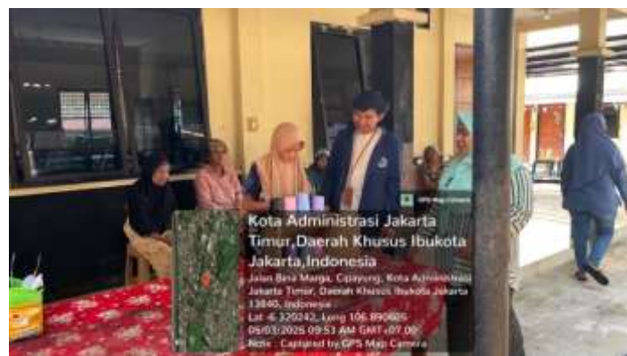
Gambar 16 Shadowing terhadap peksos dalam kegiatan aktivitas kelompok

Pada 24 Mei 2025, praktikan mengamati TAK, yaitu sebuah sesi penilaian kelompok yang dipimpin oleh pekerja sosial untuk menganalisis fungsi sosial dan juga pola interaksi antara WBS.