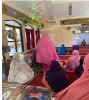
Gambar 23 kegiatan bimbingan rohani

Dalam kegiatan bimbingan rohani, praktikan mendampingi WBS mengikuti ceramah dan membaca Asmaul Husna setiap hari senin dan kamis pada pukul 10.00 WIB sampai 11.30 WIB. Kegiatan ini bertujuan memperkuat aspek spiritual lansia dan membantu mereka menemukan ketenangan batin. Praktikan juga membangun kedekatan spiritual dengan lansia melalui kegiatan ini.