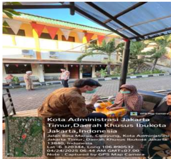
Gambar 15 Mandiri melakukan asesmen lanjutan terhadap WBS GS