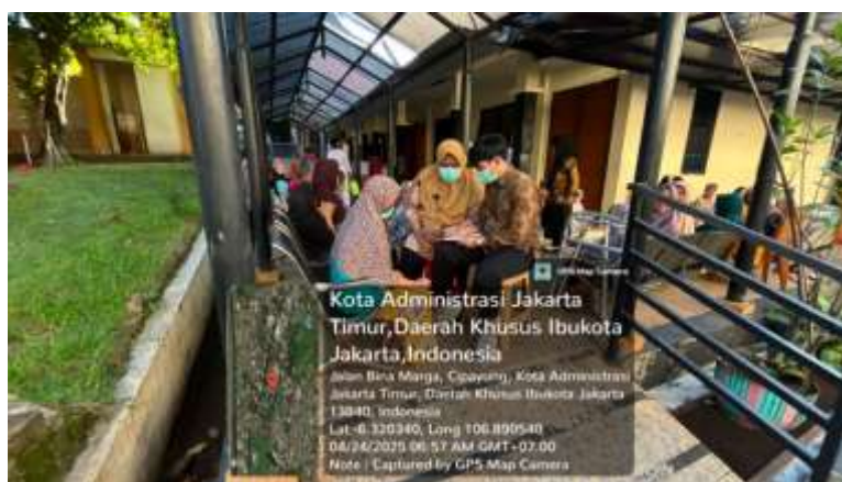
Gambar 5 Tandem Mencatat hasil asesmen awal dari peksos

Tahapan tandem dilakukan dalam sesi lanjutan yang masih berlangsung di Wisma Cempaka dengan Bu Ririn dan Nenek GS. Pada tahap ini, praktikan mulai dilibatkan secara aktif dalam proses engagement, dengan tetap mendapatkan arahan dari pekerja sosial.