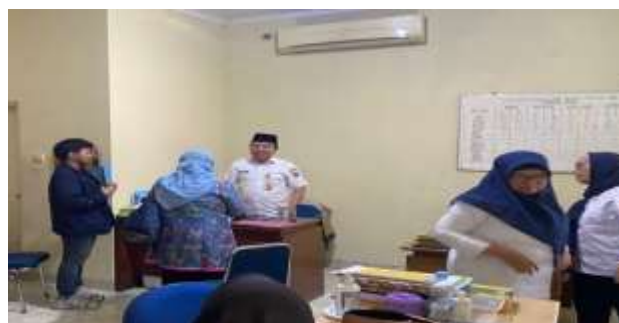
Gambar 4 Pertemuan dengan Pekerja Sosial