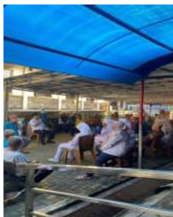
Gambar 8 Tandem Menyiapkan Kegiatan dzikir pagi bersama peksos

Pada fase tandem pada tingkat mezzo yang dilaksanakan pada 7 Mei 2025 di depan Wisma Flamboyan, praktikan mulai berpartisipasi lebih intensif dengan membantu pekerja sosial dalam menyiapkan sesi dzikir pagi. Peran praktikan meliputi bantuan dalam menyediakan perlengkapan yang dibutuhkan, mengatur tempat duduk para lansia, serta menyambut WBS dengan sapaan yang hangat dan bersahabat. Di samping itu, praktikan juga mulai melakukan komunikasi sederhana dengan beberapa WBS sambil mengamati interaksi sosial yang terjadi selama kegiatan. Kehadiran praktikan dalam acara ini berkontribusi pada pengembangan