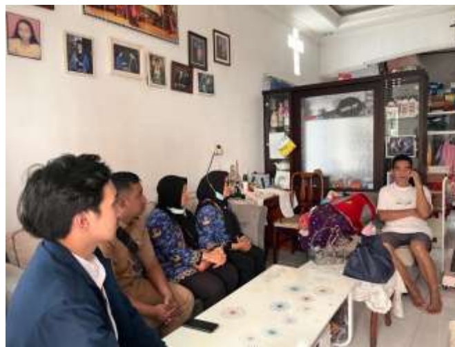
Gambar 22 mendampingi pekerja sosial dalam kunjungan rumah (home visit)

Pada tanggal 20 Mei 2025 praktikan turut serta mendampingi pekerja sosial dalam kunjungan rumah (home visit) terhadap lansia yang masih memiliki keluarga atau untuk melakukan asesmen lanjutan di lapangan. Praktikan mencatat kondisi lingkungan sosial, pola komunikasi keluarga, serta kebutuhan lanjutan lansia.