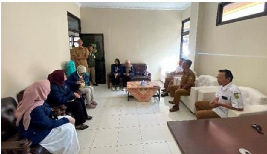
Gambar 4. 1 Praktikan melakukan percakapan sosial di Kantor Desa Cileuleuy Tanggal 29 Oktober 2024