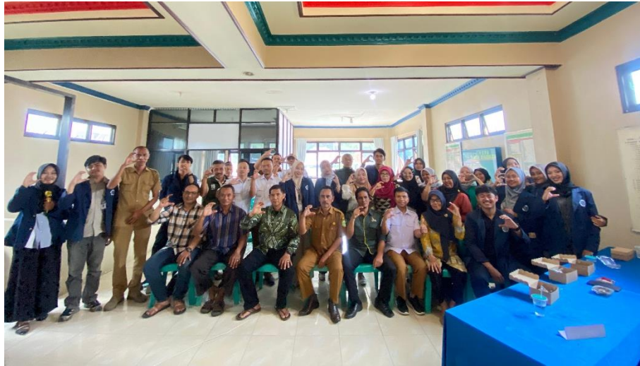
Gambar 4. 14 Praktikan melaksanakan lokakarya penutupan di Kantor Desa Cileuleuy Tabggal 2 Desember 2024