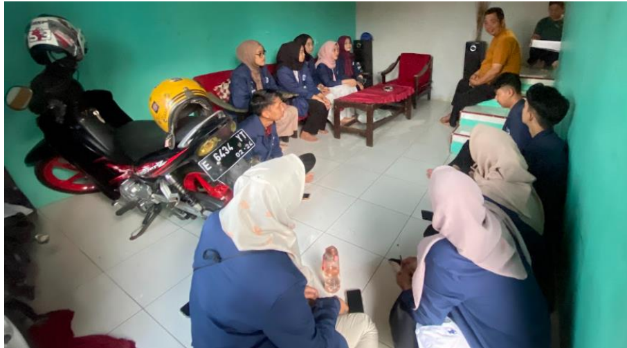
Gambar 4. 7 Praktikan melakukan kunjungan ke Rumah Kepala Dusun Puhun Tanggal 6 November 2024