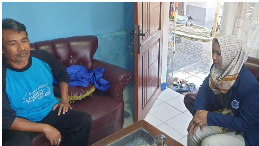
Gambar 4. 8 Praktikan melakukan kunjungan ke Rumah Ketua RW 01 6 November 2024