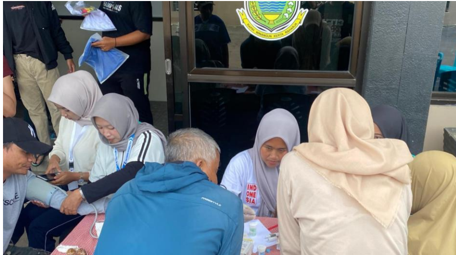
Gambar 5. 7 Praktikan melakukan pemeriksaan Kesehatan di Halaman Kantor Desa Cileuleuy Tanggal 1 Desember 2024