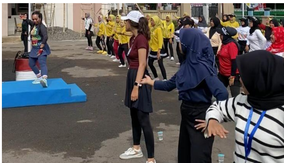
Gambar 5. 6 Praktikan mengikuti kegiatan senam sehat di Halaman Kantor Desa Cileuleuy Tanggal 1 Desember 2024

Praktikan mengadakan kegiatan senam sehat sebagai bentuk pengabdian masyarakat dimana di Desa Cileuleuy sendiri minat Ibu-Ibu untuk mengikuti senam cukup tinggi, Sebagian sudah masuk dalam suatu club dan memiliki seragam, serta di Desa Cileuleuy sendiri memiliki instruktur senam yang dapat dimanfaatkan untuk melaksanakan senam dengan berbagai jenis senam yaitu senam lansia, aerobik, dan kreasi. Pemerintah Desa melihat besarnya antusias masyarakat sehingga menghendaki keberlanjutan kegiatan senam.