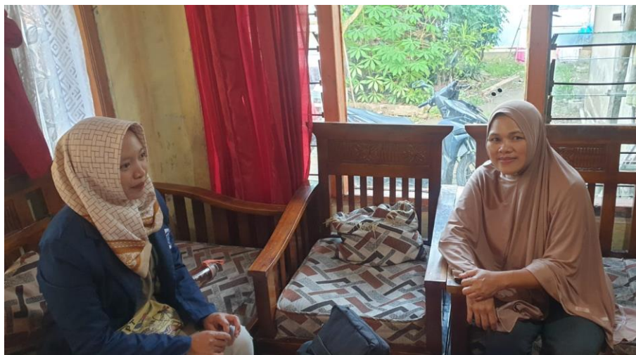
Gambar 4. 9 Praktikan melakukan asesmen ke Rumah Ketua RT 03 Tanggal 6 November 2024