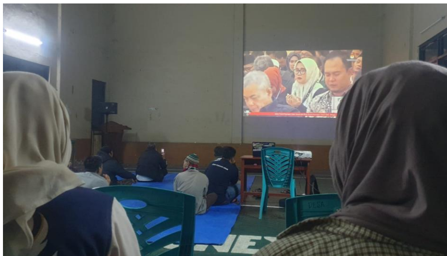
Gambar 5. 2 . Praktikan mengikuti kegiatan nonton bersama Debat Bupati di Gedung Serbaguna Desa Cileuleuy Tanggal 3 November 2024