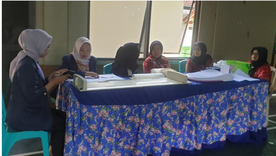
Gambar 5. 4 Praktikan mengikuti kegiatan Posyandu Balita di Gedung Serbaguna Desa Cileuleuy Tanggal 6 November 2024

seperti penimbangan balita, pengukuran lingkaran perut dan lengan, dan administrasi.