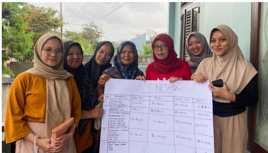
Gambar 4. 13 Praktikan melakukan monitoring dan evaluasi di Dusun Puhun Tanggal 2 Desember 2024