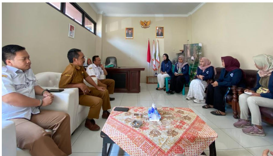
Gambar 4. 6 Praktikan melakukan pengorganisasian di Kantor Desa Cileuleuy Tanggal 2 November 2024

Kader PKK, Kader Posyandu, Pengajian, dan Senam. Karang Taruna ada tetapi kegiatan hanya saat HUT RI dan Maulid Nabi. Kelompok Wisata sudah ada tetapi belum berjalan. Kelompok Tani sudah ada dan berjalan dengan baik. Kelompok Wanita Tani dulunya ada tetapi tidak berjalan. Organisasi atau kelompok yang belum ada adalah kelompok penyandang disabilitas dan kelompok/ organisasi yang mempertemukan warga.