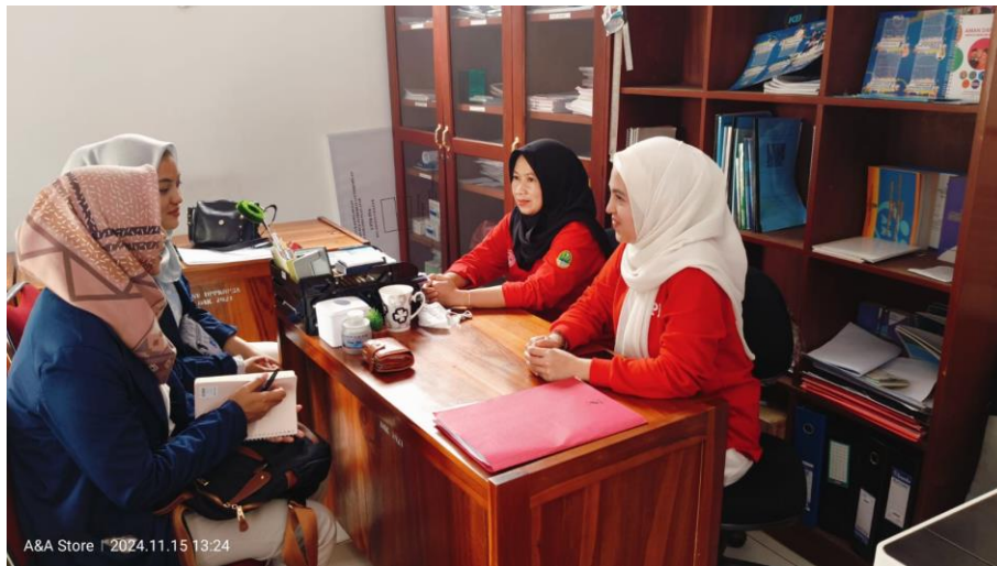
Gambar 4. 16 Praktikan melakukan rujukan kepada petugas BKKBN di Kantor BKKBN Tanggal 2 Desember 2024