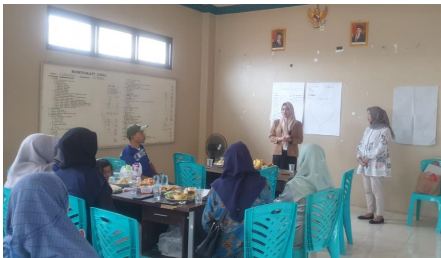
Gambar 4. 11 Praktikan Menyusun Tim Kerja Masyarakat di Kantor Desa Cileuleuy Tanggal 16 November 2024