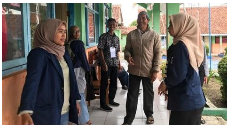
Gambar 5. 3 Praktikan mengikuti kegiatan pemilihan umum di TPU 2 Desa Cileuleuy Tanggal 27 November 2024

Keterlibatan praktikan dalam memeriahkan pemilihan umum kepala daerah dengan turut hadir dalam TPU 2 Dusun Manis sebagai pengarah alur pemilihan. Praktikan juga memberikan dukungan dan dorongan kepada masyarakat untuk menggunakan hak pilihnya.