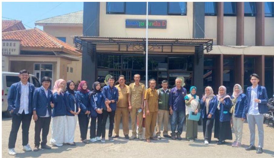
Gambar 3. 2 Kantor Desa Cileuleuy Tanggal 29 Oktober 2024

Desa Cileuleuy terletak di kaki gunung Ciremai. Kontur wilayahnya berbukit di sebelah dan juga rata sedikit berbukit. Keadaan iklim Desa Cileuleuy dipengaruhi oleh iklim tropis dan angin muson, dengan temperature bulanan berkisar antara 18°C-32°C serta curah hujan berkisar antara 2.000 mm - 2.500 mm per tahun. Pergantian musim terjadi antara bulan November - Mei adalah musim hujan dan antara bulan Juni – Oktober adalah musim kemarau.