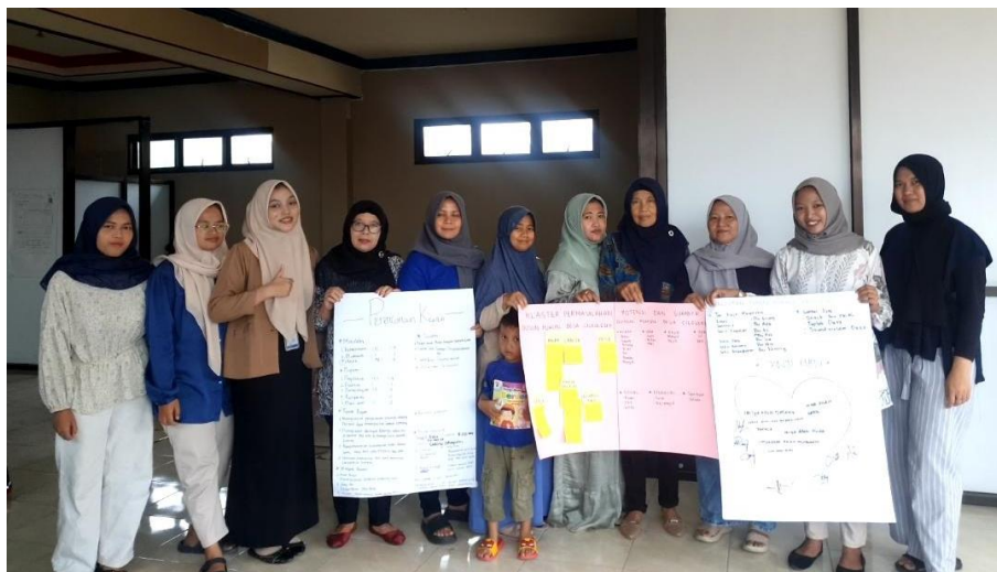
Gambar 4. 10 Praktikan melakukan Asesmen MPA dan SLA di Kantor Desa Cileuleuy Tanggal 16 November 2024