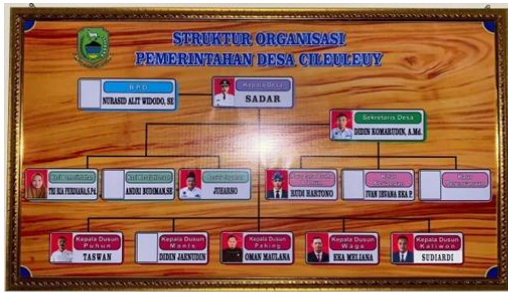
Gambar 3. 3 Susunan Organisasi dan Tata Kerja Pemerintahan Desa Cileuleuy Tahun 2023