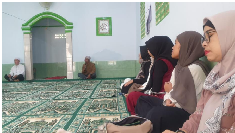
Gambar 4. 2 Praktikan mengikuti kegiatan pengajian di Masjid Al Hikmah Tanggal 3 November 2024