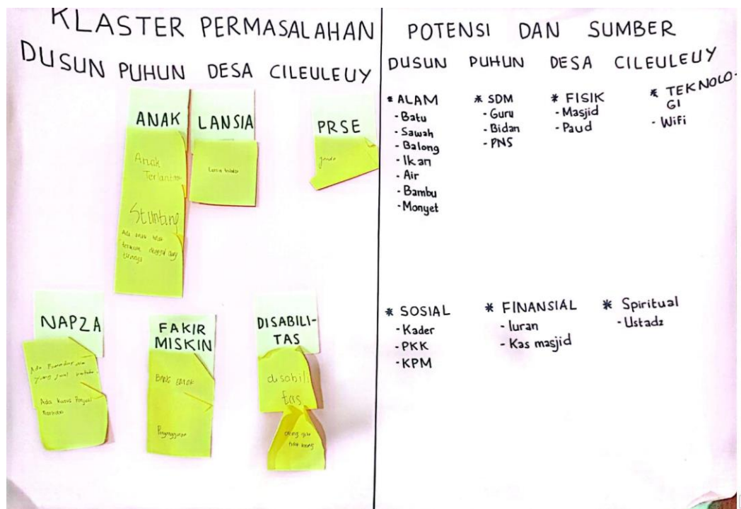
Lampiran 9 Kluster permasalahan Potensi dan Sumber