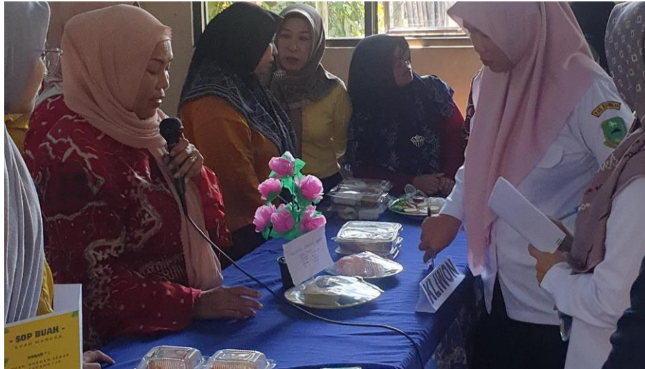
Gambar 4. 12 Praktikan melakukan kegiatan Penyuluhan dan Pemberdayaan di Gedung Serbaguna Desa Cileuleuy Tanggal 20 November 2024