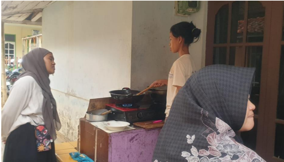
Gambar 4. 3 Praktikan community involvement di penjual makanan Dusun Wage Tanggal 3 November 2024