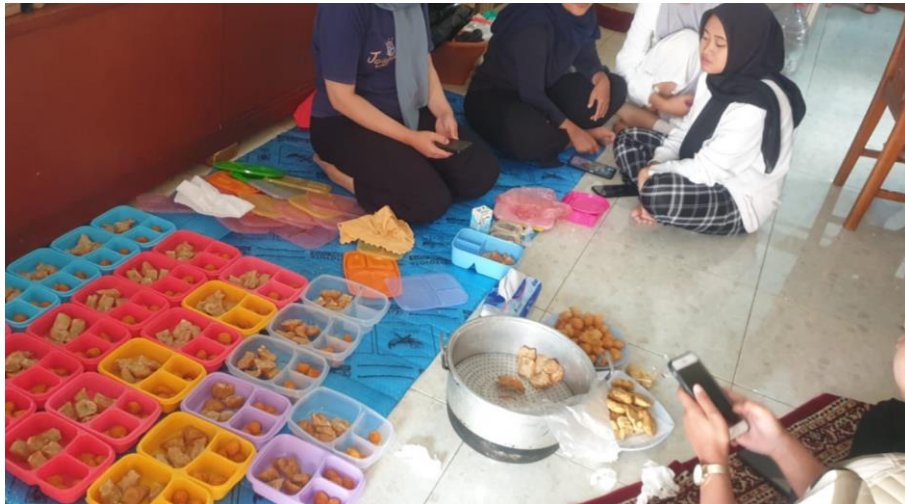
Gambar 4. 15 Kader Posyandu menerapkan inovasi PMT di Dapur Gizi Desa Cileuleuy Tanggal 2 Desember 2024

Menyusun dan menerapkan inovasi PMT yang menarik bagi anak-anak.