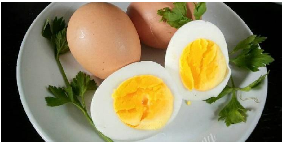
Lampiran 7 Sebelum Inovasi PMT