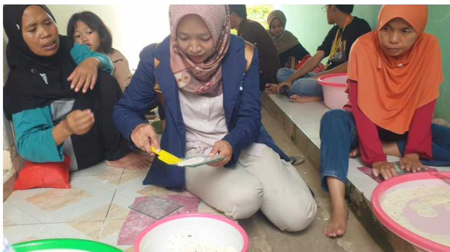
Gambar 5. 5 Praktikan sedang membuat makanan Gemblong di Dusun Pahing Tanggal 23 November 2024

Keterlibatan praktikan dalam kegiatan pembuatan gemblong sebagai salah satu UMKM andalan di Kabupaten Kuningan dengan bahan dasar Ketela yang sudah di giling. Praktikan membuat gemblong dengan menggunakan kaca dan cetakan dari bekas air mineral kemasan gelas.