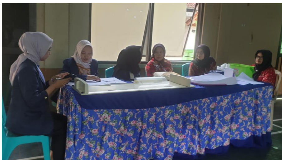
Gambar 4. 5 Praktikan mengikuti kegiatan Posyandu di Gedung Serbaguna Desa Cileuleuy Tanggal 6 November 2024