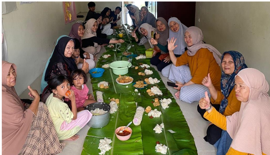
Gambar 5. 8 Praktikan mengikuti kegiatan Ngaliwet di Dusun Manis Tanggal 3 Desember 2024

Praktikan bersama-sama dengan Kader PKK dan karang taruna mengadakan ngaliwet bareng untuk menjalin keakraban dan kemudahan dalam melaksanakan komunikasi serta memahami tata cara makan bersama menggunakan daun pisang, memasak nasi liwet secara bersama-sama.