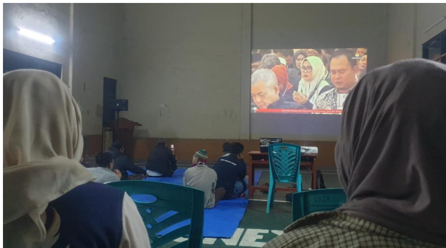
Gambar 4. 4 Praktikan mengikuti nonton bersama debat calon bupati di Gedung Serbaguna Desa Cileuleuy Tanggal 3 November 2024