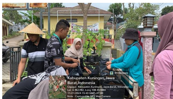
Foto 8 Kegiatan Penyusunan Rencana Intervensi