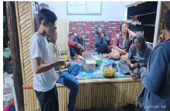
Pos Ronda dengan Warga RT 04