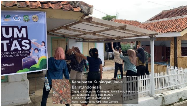
Senam pagi Bersama Warga RT 04