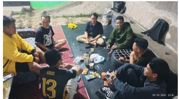
Berkumpul dengan Kepemudaan Dusun