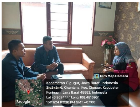
Foto 11 Kegiatan Terminasi terhadap Pendamping PKH

Praktikan menyampaikan maksud dan tujuan kepada semua pihak terkait pemutusan hubungan karena telah selesainya penyelenggaraan praktikum komunitas. Praktikan menyampaikan terima kasih yang sebesar-besarnya serta permohonan maaf jika dalam pelaksanaan intervensi komunitas tidak dapat dilakukan secara maksimal. Kegiatan terminasi yang dilakukan oleh praktikan dengan beberapa tahapan antara lain sebagai berikut: