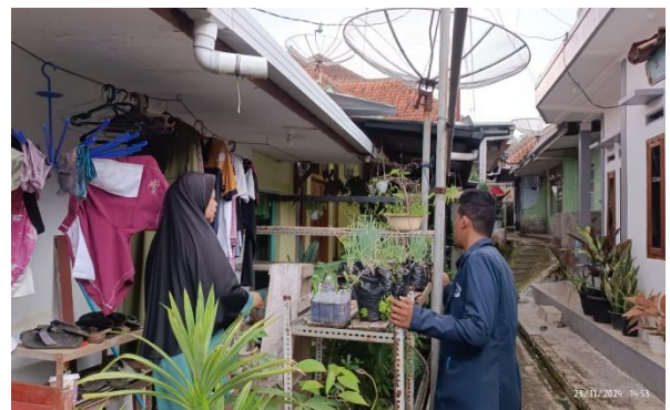
Monitoring hasil intervensi