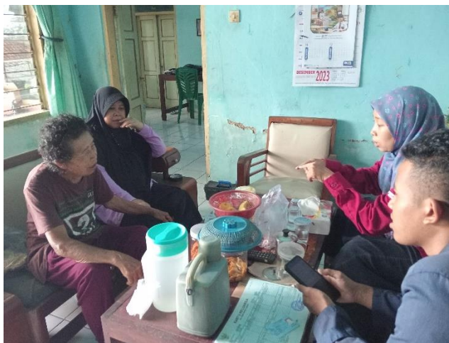
Mendata PM untuk Permakanan Lansia