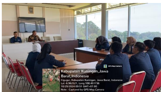
Foto 1 Kegiatan Pertemuan Dengan kepala Desa

Kontak awal yang dilakukan praktikan ialah melalui penjajagan ke lokasi yang akan dijadikan lokasi Praktikum Komunitas. Praktikan bersama anggota kelompok