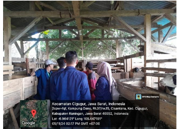
Berkunjung ke peternakan Domba