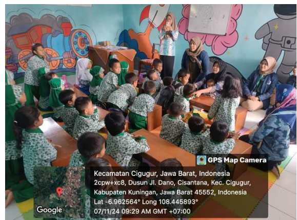
Kunjungan ke Paud