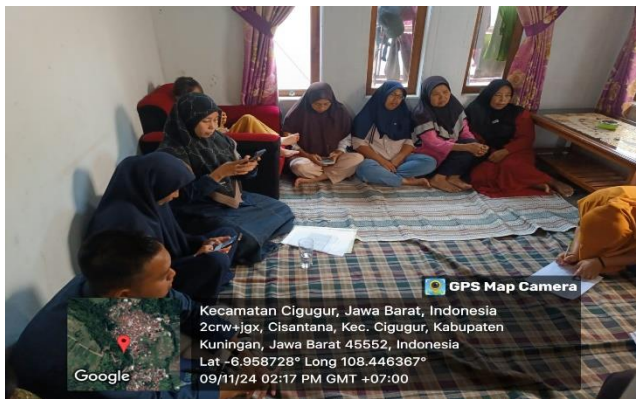
Ikut serta kegiatan PKH