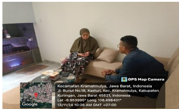
Foto 12 Kegiatan Rujukan Kepada PKH

Rujukan merupakan langkah terakhir praktikan untuk menindaklanjuti program yang ditujukan kepada seluruh pihak baik kepada Lembaga Kesejahteraan Sosial maupun stakeholder yang dapat mengembangkan program. Untuk itu, praktikan melakukan rujukan terhadap: