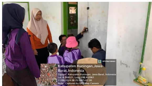
Foto 4 Mengikuti Kegiatan Kesehatan Posyandu

Praktikan turut berpartisipasi dalam kegiatan kesehatan di Desa Cisantana, termasuk pelayanan Posyandu di Dusun Cisantana, Dusun Dano, maupun di Dusun Malaraman. Kegiatan posyandu ini mencakup pemberian Makanan Pendamping ASI (PMT) serta pemeriksaan kesehatan untuk ibu dan anak. Melalui keterlibatan ini, praktikan dapat berinteraksi langsung dengan bidan, kader posyandu, dan warga yang merupakan penerima manfaat layanan. Selain itu, praktikan juga mendapatkan data terkait stunting dan ibu hamil di desa tersebut. Kegiatan pelayanan posyandu ini dimulai pada Selasa, 5 November 2024.