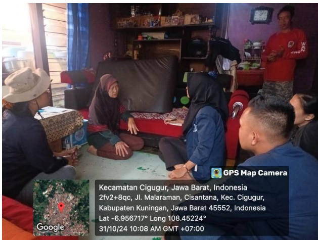
Kunjungan Ke UMKM kue cucur