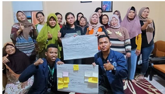
Foto 7 Kegiatan Penyusunan Rencana Intervensi

Perencanaan intervensi dilakukan setelah tahap asesmen selesai untuk merancang program dan kegiatan yang ditujukan sebagai solusi atas permasalahan yang dihadapi komunitas. Pada kasus ini, fokus perencanaan intervensi adalah menangani permasalahan Pemanfaatan Lahan Pekarangan bagi Keluarga Penerima Manfaat PKH. Teknik yang digunakan dalam perencanaan intervensi adalah Technology of Participation (TOP) , yang menekankan partisipasi aktif dari seluruh peserta. Praktikan berperan sebagai fasilitator dalam proses ini,