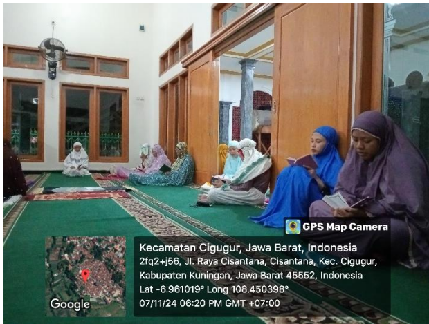
Pengajian Rutin Malam Jum'at