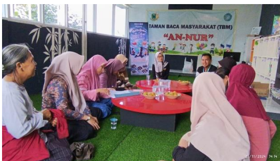
Foto 10 Kegiatan Sosialisasi Pemanfaatan Tanaman Teras Hejo yang Efektif

Kegiatan berikutnya adalah sosialisasi tentang Pemanfaatan Teras Hejo , yang bertujuan meningkatkan kesadaran dan kepedulian masyarakat terhadap