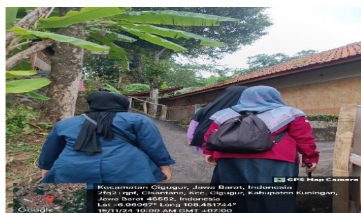
Foto 3 Kegiatan Observasi untuk Identifikasi