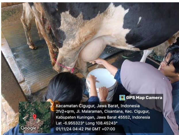
Kunjungan ke Peternakan Sapi perah