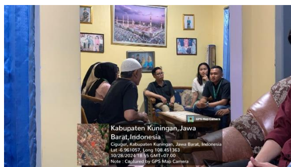
Foto 2 Melakukan Home Visit Kepada Stakeholder

Home visit dilakukan dengan cara mengunjungi sasaran yang telah ditetapkan sebelumnya sesuai dengan jadwal yang telah ditetapkan. Tujuan dari kegiatan ini adalah untuk melakukan kontak pendahuluan secara personal sehingga memperoleh dukungan dan informasi awal khususnya dari tokoh masyarakat setempat dalam rangka pelaksanaan kegiatan praktikum. Home Visit mulai dilakukan pada Kamis, 31 Oktober 2024 yang bertujuan untuk mensosialisasikan teknis, tujuan dan kegiatan praktikum komunitas yang dilaksanakan oleh mahasiswa Poltekesos Bandung. Home Visit yang dilakukan berupa kunjungan ke rumah para perangkat desa, seperti ke rumah Ketua RW, Ketua RT setempat, dan beberapa Stakeholder.