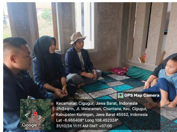
Kunjungan ke UMKM tempe