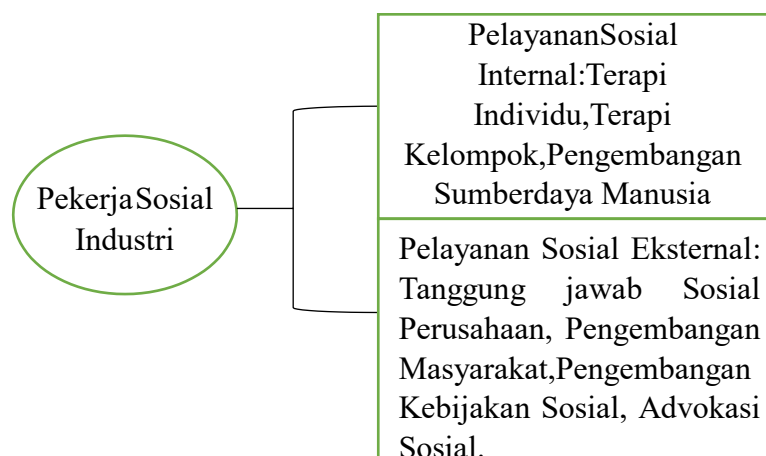
Bagan 2.1. Pelayanan Sosial dan Eksternal Peksos Industri

Dalam menjalankan tiga bidang tugas dalam ranah industri, Pekerja Sosial dapat menggunakan dua pendekatan baik mikro maupun makro. Dalam pendekatan mikro, terdapat beberapa pelayanan yang berhubungan dengan masalah yang dihadapi individu dalam perusahaan, seperti dengan konseling dan terapi pada individu. Untuk pendekatan makro, pelayanan yang diberikan kepada kelompok melalui terapi kelompok, serta pelatihan dan pengembangan. Bentuk pelayanan dari pekerja sosial industri di perusahaan tidak hanya mencakup bagian internal perusahaan saja tapi juga mencakup bagian eksternal dari perusahaan, karena di masa sekarang tidak dapat dipungkiri bahwa kesuksesan lingkungan dari suatu perusahaan sama dengan kesuksesan komersil.