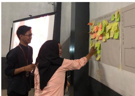
Foto 4. 12 Kegiatan Rembug Warga

Setelah sosialisasi dilakukan, kegiatan dilanjutkan dengan penggunaan teknik Method of Participation Assesment (MPA). Penggunaan teknik ini melibatkan masyarakat untuk berpartisipasi secara langsung dengan cara menuliskan permasalahan yang ada di wilayah Desa Gunungkeling pada metacard yang dibagikan kepada masing-masing partisipan. Setelah selesai penulisan, partisipan akan diminta untuk menempelkan masing-masing metacard yang telah diisi pada kolom yang sudah disediakan dalam kertas plano. Setelah seluruh metacard terkumpul, praktikan membantu partisipan dalam mengkategorikan permasalahan sesuai dengan tabel yang telah disediakan (klaster lingkungan, sosial, kesehatan, ekonomi, kemiskinan, organisasi, dan pendidikan).