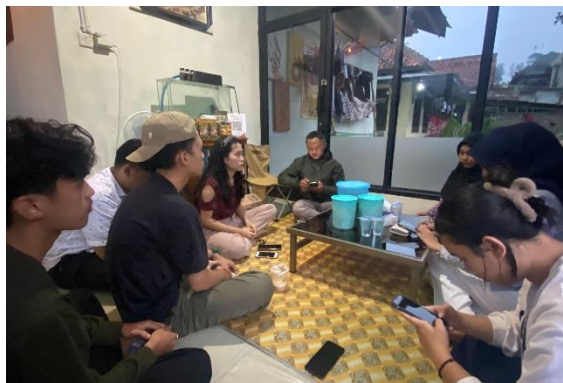
Foto 4. 9 Diskusi bersama Pendamping Lapangan

Praktikan mendiskusikan rencana kegiatan bersama dengan teman kelompok dan dikonsultasikan kepada pendamping lapangan untuk mendapatkan arahan dalam melaksanakan rencana kegiatan.