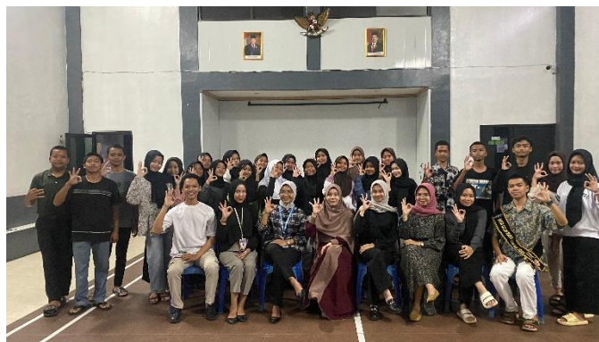
Foto 4. 17 Kegiatan Intervensi