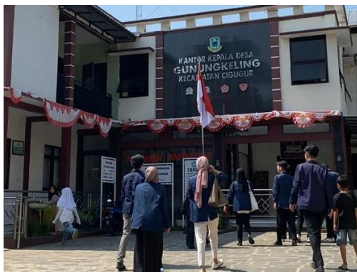
Foto 4. 2 Penerimaan Mahasiswa di Kantor Desa Gunungkeling