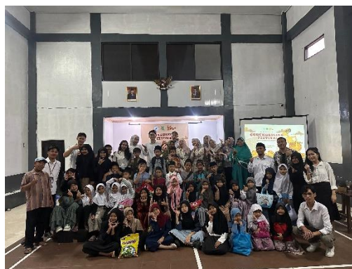
Foto 4. 18 Kegiatan Terminasi