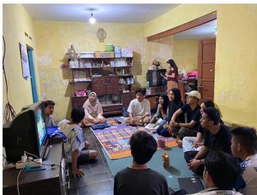
Foto 4. 3 Home Visit ke Rumah Kepala Dusun