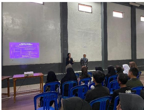
Foto 4. 14 Kegiatan Sosialisasi Bahaya Penyalahgunaan Napza

Kegiatan sosialisasi terkait bahaya penyalahgunaan Napza di Desa Gunungkeling 21 November 2024 dilaksanakan mulai pukul 19.30 – 21.00 yang bertempat di gedung serbaguna Desa Gunungkeling. Praktikan melakukan sosialisasi bahaya penyalahgunaan Napza bersama dengan Kader PIK-R dan remaja Desa Gunungkeling sebagai kelompok sasaran dari program kegiatan ini. Dalam acara ini dihadiri 15 orang. Kegiatan di mulai dari pembukaan sambutan singkat dari praktikan dan dilanjutkan ke penjelasan terkait dengan sosialisasi bahaya penyalahgunaan Napza bagi remaja. Praktikan melakukan kegiatan sosialisasi ini tujuannya untuk meningkatkan kesadaran terkait pencegahan penyalahgunaan Napza di kalangan remaja Desa Gunungkeling. Pada tahap ini peserta diberikan kesempatan untuk mengajukan pertanyaan atau berbagi pandangan.