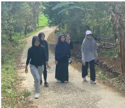
Foto 4. 10 Kegiatan Transect Walk

ini dilakukan agar praktikan tidak hanya mendapatkan informasi dari masyarakat, namun juga melihat kondisi lapangan secara langsung agar informasi yang didapatkan bisa divalidasi. Pelaksanaan transect walk ini bertujuan untuk mengamati, mengenali, serta mengetahui kondisi sosio-geografis wilayah dan situasi masyarakat Desa Gunungkeling, termasuk mengidentifikasi potensi dan sistem sumber. Praktikan mengelilingi Desa Gunungkeling dengan berjalan kaki, rute pertama adalah melihat lahan peternakan dan pertanian. Pada lahan peternakan, sebagian besar warga memiliki ternak sapi, kambing, ayam, dan entog. Sementara pada lahan pertanian, praktikan menemukan potensi sumber daya alam yang dimiliki warga Desa Gunungkeling berupa kebun bawang yang nantinya diolah menjadi bawang goreng, terdapat juga kebun singkong, dan area persawahan. Adapun aset yang dimiliki Desa Gunungkeling di antaranya Masjid, SDN 1 Gunungkeling, pos ronda, sanggar seni Astagiri, lapangan, rageman, dan gedung serbaguna Balai Desa. Selain itu, praktikan melakukan transec walk secara bertahap mulai dari wilayah RW 01 sampai dengan RW 05 untuk melakukan pengenalan wilayah dan pengenalan dengan masyarakat agar masyarakat di Desa Gunungkeling mengetahui keberadaan praktikan yang sedang melaksanakan praktikum komunitas di wilayahnya.