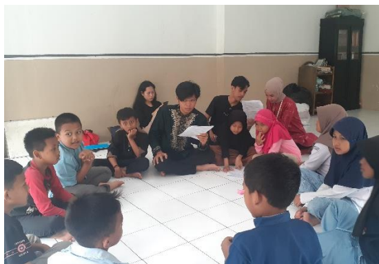
Foto 5. 4 Kegiatan Melatih Drama Ciung Wanara