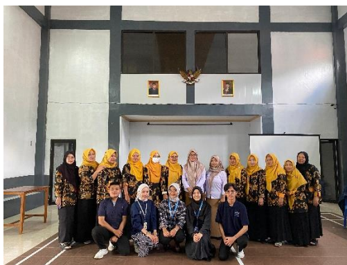
Foto 5. 1 Kegiatan Posyandu

kesehatan masyarakat, berinteraksi dengan warga, dan bekerja sama dengan kader Posyandu serta tenaga kesehatan, sekaligus menerapkan prinsip pekerjaan sosial di tingkat komunitas.