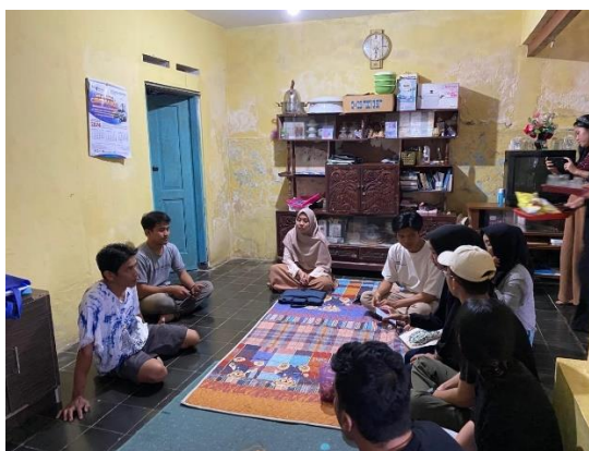
Foto 4. 11 Home Visit

Praktikan setelah melakukan community meeting , praktikan kembali melakukan kunjungan untuk melakukan verifikasi dan validasi masalah berdasarkan hasil MPA kepada pihak desa dan tokoh masyarakat sehingga diharapkan informasi yang didapat dari kegiatan rembuk warga merupakan informasi yang valid dan dapat dipertanggungjawabkan dikemudian hari berkaitan dengan kebenarannya. Selain itu pula, praktikan meminta arahan dan dukungan kepada tokoh masyarakat dalam setiap implementasi program yang nantinya akan dijalankan oleh praktikan.