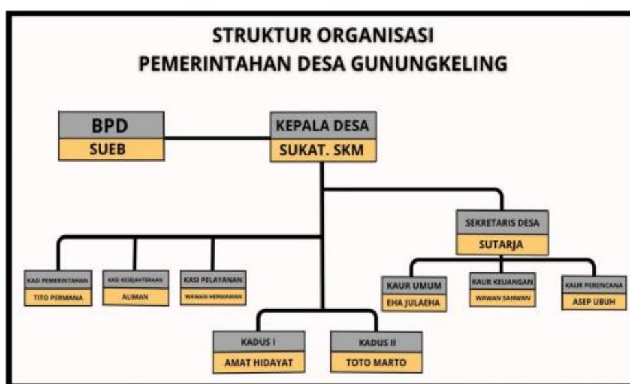
Gambar 3. 2 Struktur Organisasi Desa Gunungkeling