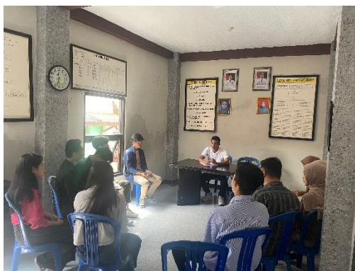
Foto 4. 8 Kegiatan diskusi terkait hambatan dan tantangan

Setelah terjalannya trush building antara praktikan warga masyarakat serta didapkannya hasil dari wawancara dan observasi tentang potensi desa, pada tanggal 4 November 2024, praktikan bersama perangkat desa dan elemen masyarakat ( stakeholder ) menyepakati komitmen ( stakeholder engagement ) untuk bekerja sama dalam mengupayakan perubahan di Desa Gunungkeling. Kegiatan ini melibatkan warga, tokoh masyarakat, dan kepala desa yang turut mendiskusikan tantangan serta hambatan yang dihadapi masyarakat. Pemanfaatan potensi desa juga menjadi fokus pembahasan untuk mengatasi hambatan tersebut dan mendorong perubahan yang positif.