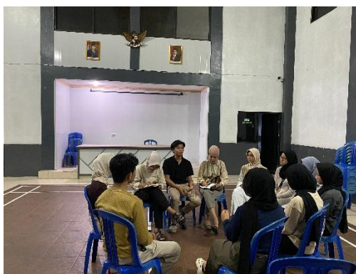
Foto 4. 13 Kegiatan Asesmen Lanjutan