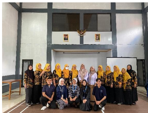
Foto 4. 5 Kegiatan Posyandu

Praktikan ikut serta dalam kegiatan posyandu anak tanggal 4 November 2024 yang diadakan oleh PKK dan Puskesmas Gunungkeling. Kegiatan posyandu ini mencakup pengukuran berat badan, tinggi badan, tekanan darah, vaksinasi, pemberian makanan tambahan, dan pemantauan perkembangan anak. Dalam kegiatan ini praktikan ikut serta dalam membantu mengukur berat badan dan tinggi badan anak sedangkan untuk pengecekan kesehatan dilakukan oleh Bidan Desa Gunungkeling. Keikutsertaan praktikan dalam kegiatan posyandu ini juga merupakan salah satu bentuk community involvement dalam proses membangun relasi dengan warga Desa Gunung Keling. Secara keseluruhan, kegiatan posyandu di Gunung Keling memberikan pengalaman bagi praktikan mengenai pentingnya peran posyandu dalam menjaga kesehatan masyarakat.