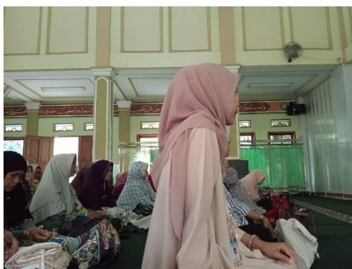
Foto 5. 5 Kegiatan Pengajian

Kegiatan pengajian bersama ibu-ibu warga Desa Gunungkeling dilaksanakan sebagai bagian dari upaya membangun kebersamaan di kalangan ibu-ibu desa. Pengajian ini diadakan secara rutin, setiap minggu pada hari Ramis, dan bertempat di mushola Balai Desa Gunungkeling. Kegiatan ini bertujuan untuk mempererat silaturahmi, meningkatkan pemahaman agama, serta mendorong ibu-ibu untuk lebih aktif dalam kegiatan sosial di komunitas mereka. Materi pengajian yang diberikan meliputi pembacaan ayat suci Al-Qur'an dan Surat Yassin, ceramah agama, serta diskusi seputar isu-isu keseharian yang relevan dengan kehidupan masyarakat. Melalui partisipasi ini, praktikan juga dapat memperluas jaringan dengan warga desa dan memahami kebutuhan serta aspirasi mereka secara langsung.