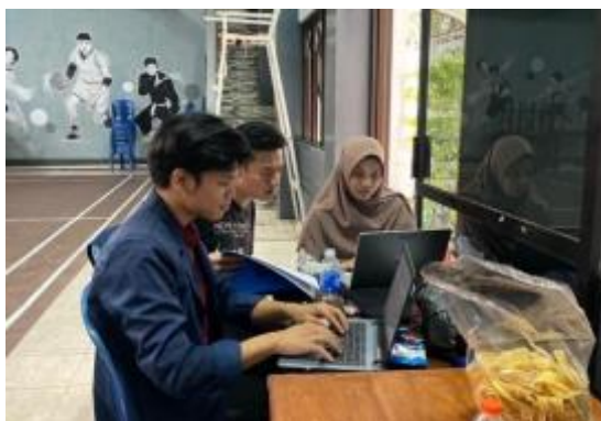
Foto 5. 3 Kegiatan Input Data Dasawisma

Kegiatan Penginputan Data Dasawisma dilakukan sebagai bagian dari proses pelaporan akhir tahun yang berkaitan dengan pemantauan dan evaluasi program pemberdayaan masyarakat di Desa Gunungkeling. Kegiatan ini melibatkan pengumpulan data mengenai kondisi keluarga dan rumah tangga, termasuk status kesehatan, pendidikan, dan kesejahteraan ekonomi. Praktikan turut serta dalam membantu penginputan data Dasawisma yang dikumpulkan oleh kader PKK desa. Data tersebut akan digunakan untuk menyusun laporan tahunan yang menggambarkan perkembangan dan kebutuhan masyarakat desa.