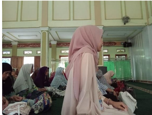
Foto 4. 4 Pengajian bersama Lansia