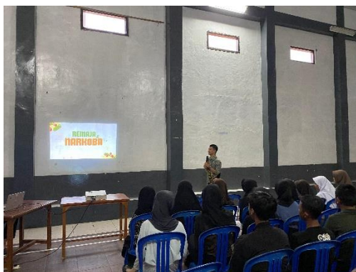
Foto 4. 16 Pemberdayaan oleh Kader PIK-R

serta cara-cara pencegahannya. Selama penyuluhan, kader memanfaatkan alat bantu seperti poster dan brosur untuk mempermudah pemahaman peserta. Selain pemaparan materi, kegiatan juga mencakup sesi diskusi, tanya jawab, dan simulasi sederhana. Peserta diberikan kesempatan untuk bertanya mengenai situasi di lingkungan mereka yang berkaitan dengan penyalahgunaan NAPZA. Kader PIK-R menjawab pertanyaan tersebut dengan memberikan penjelasan dan solusi yang relevan, sesuai dengan kondisi lokal.