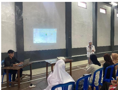
Foto 4. 15 Kegiatan Peningkatan Kapasitas Kader PIK-R