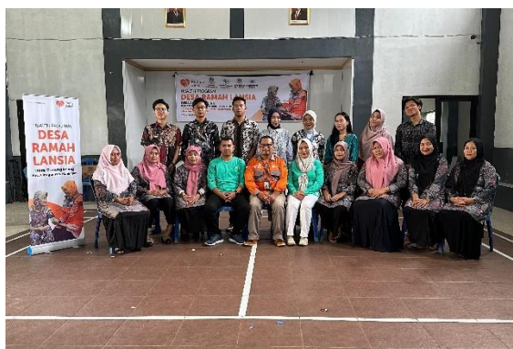
Foto 5. 6 Kegiatan Posbindu

Posbindu (Pos Pembinaan Terpadu) Lansia adalah salah satu program kesehatan masyarakat yang berfokus pada pencegahan dan pengelolaan kesehatan lansia di tingkat desa atau kelurahan. Kegiatan Posbindu Lansia bertujuan untuk meningkatkan kualitas hidup lansia melalui pemeriksaan kesehatan rutin, edukasi kesehatan, dan penguatan dukungan sosial. posbindu dilakukan secara rutin 1 bulan sekali yang dilaksanakan di balai desa. selain pemeriksaan kesehatan lanjut usia juga mengikuti senam lansia dan lansia yang memiliki keluhan yang harus diperiksa lebih lanjut pihak desa akan merujuk lansia ke rumah sakit. selain posbindu juga diadakan penyuluhan tentang lansia yang dilakukan oleh praktikan. dalam hal ini praktikan berperan dalam membantu kader memeriksa kesehatan lansia, membantu pelaksanaan kegiatan seperti pencatatan hasil pemeriksaan atau memberikan edukasi dan memberikan semangat kepada lanjut usia.