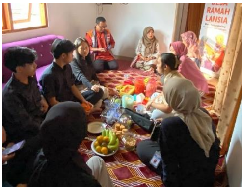
Foto 4. 7 Kegiatan Rapat Koordinasi Lansia