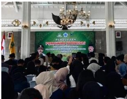
Foto 4. 1 Kegiatan Penerimaan Mahasiswa Pendopo Kab.Kuningan

pemerintah Kecamatan Cigugur dan kemudian akan diterima dan melaksanakan proses praktikum komunitas di desa masing-masing. Terdapat enam desa yang menjadi lokasi praktikum komunitas di Kecamatan Cigugur yaitu Desa Gunungkeling, Desa Cipari, dan Desa Cileleuy.