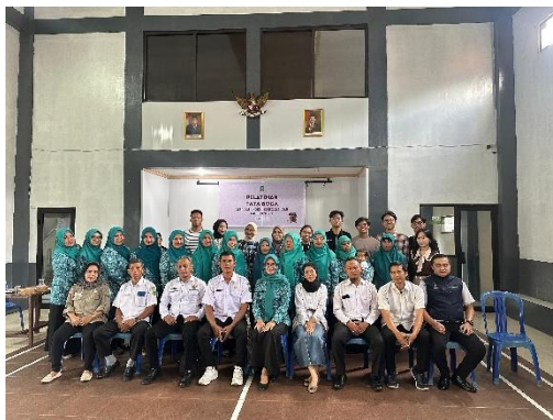
Foto 5. 7 Kegiatan Pelatihan Tata Boga Kader PKK

persiapan, praktikan juga mengamati langkah-langkah pembuatan kue, mulai dari mencampur adonan hingga memanggang kue. Seluruh peserta terlihat antusias dalam mengikuti setiap tahapan, saling bertukar tips memasak, dan berbagi pengalaman. Ibu-Ibu PKK merasa senang dan puas karena dapat menghasilkan kue yang lezat serta berpotensi untuk dijadikan usaha kecil-kecilan.