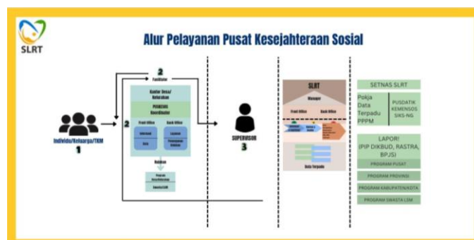
Gambar 3. 2 Alur Pelayanan Puskesmas

Fasilitator dapat mengunjungi atau bertemu langsung dengan masyarakat untuk melakukan pencatatan keluhan dan menganalisis permasalahan masyarakat yang kemudian hasil dari pencatatan tersebut diperiksa oleh supervisor untuk mendapatkan persetujuan serta dapat ditindaklanjuti dengan dirujuk kepada SLRT Dinas Sosial daerah kabupaten/kota. Berikut ini adalah alur pelayanan Puskesmas: