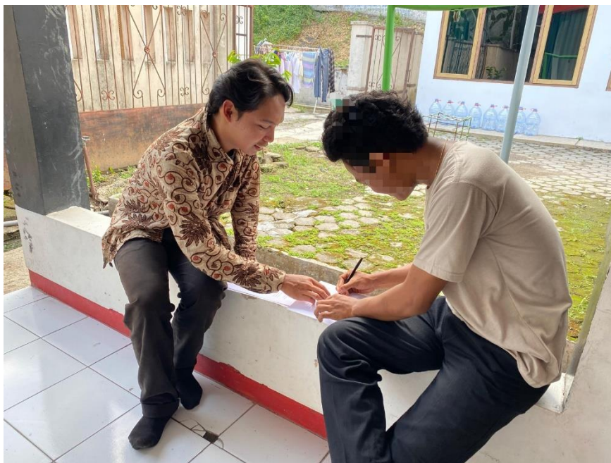
Foto 4. 8 TTD form Terminasi