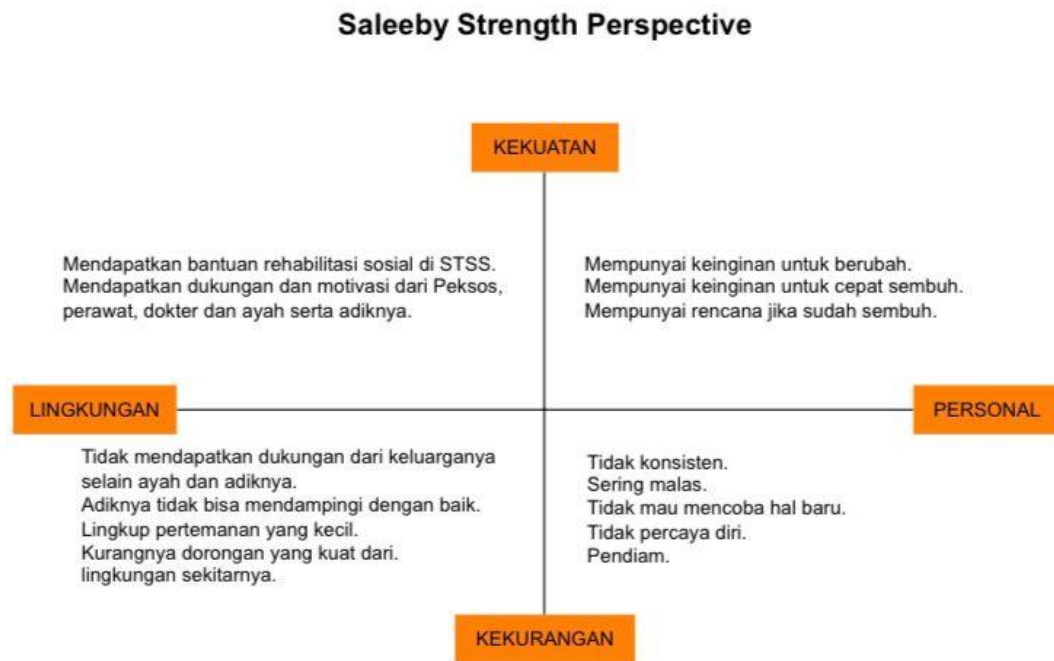
Gambar 4. 1 Saleeby Strength Perspective

mengetahui potensi yang dimiliki Klien MJ, praktikan menggunakan alat asesmen saleeby strength perspective yang ada dibawah ini: