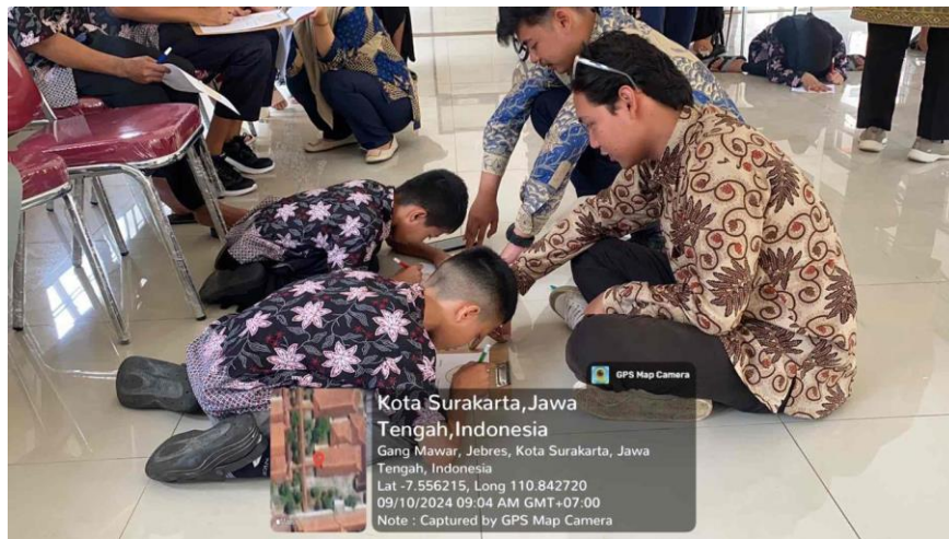
Foto 5. 4 4 Kegiatan Terapi Psikososial

Praktikan dilibatkan untuk mengikuti kegiatan rutin terapi psikososial yang diselenggarakan setiap hari Selasa pukul 08.00 pagi. Praktikan ikut terlibat dengan mendampingi para klien yang mengikuti terapi psikososial ini.