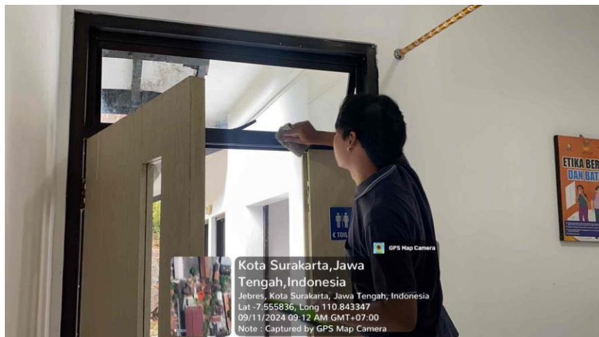
Foto 5. 3 Kegiatan Rabu Bersih

Kegiatan rabu bersih rutin dilakukan pada setiap hari rabu pukul 07.30, kegiatan rabu bersih ini dilakukan di sekitana lingkungan sentra dengan melibatkan seluruh warga sentra untuk saling gotong royong membersihkan dan merawat lingkungan sentra.