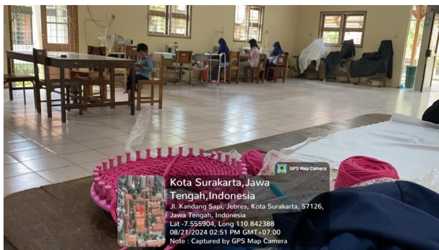
Foto 5. 5 Kegiatan vokasional

Praktikan ditempatkan secara bergilir di unit-unit vokasional seperti unit handycraft, unit menjaahit, bengkel, komputer, percetakan, IPP, unit fotografi. Praktikan ikut serta dan mendampingi para klien pada setiap unitnya.