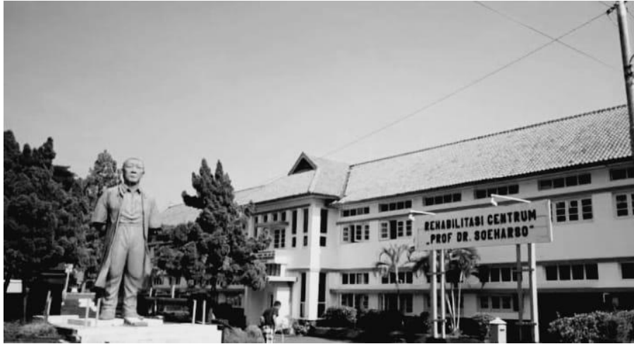
Foto 3. 1 Sentra Terpadu Prof. Dr. Soeharso Surakarta

Sentra Terpadu Prof. Dr. Soeharso Surakarta merupakan tempat pertolongan dan pelayanan bagi para PPKS untuk direhabilitasi agar pulih kembali rasa percaya diri, kemampuan, kecintaan kerjanya, serta tanggung jawabnya sehingga mereka mampu mandiri dan dapat melaksanakan fungsi sosialnya secara wajar dalam kehidupan bermasyarakat.