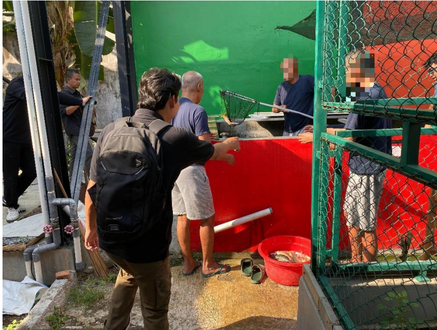
Foto 5. 6 Kegiatan Panen

Kegiatan panen ini dimaksudkan kepada klien ODGJ, tujuannya untuk memberikan pengalaman dalam panen sayuran dan ikaan. Praktikaan terlibat dalam kegiatan panen ini, mendampingi serta membimbing para klien ODGJ.