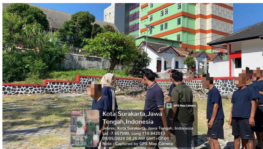
Foto 5. 8 Kegiatan Dinamika Kelompok

Praktikan terlibat dalam kegiatan dinamika kelompok yang ditujukan untuk klien cluster ODGJ. Klien cluster ODGJ disuruh untuk menari dengan diiringi musik dan menggambarkan sesuatu di selembar kertas.