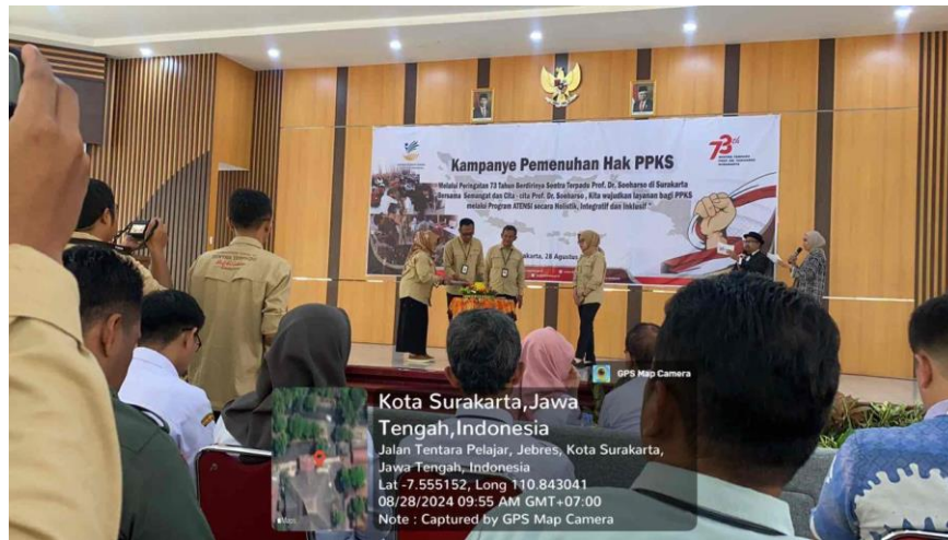
Foto 5. 7 Kegiatan UlangTahun Sentra