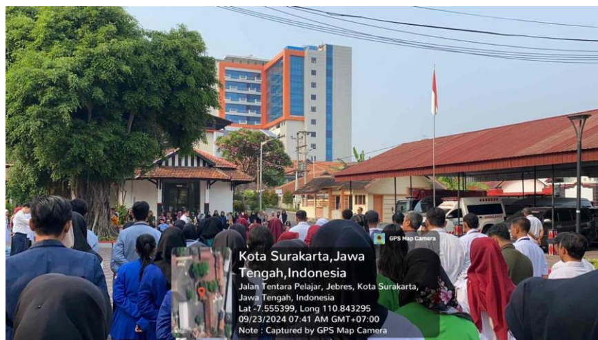
Foto 5. 1 Kegiatan Apel

Praktikan mengikuti kegiatan apel pagi, yang dilaksanakan rutin setiap hari Senin pada pukul 07.30 WIB di depan aula sentra. Kegiatan apel ini dihadiri oleh seluruh warga Sentra yang dipimpin oleh instruktur upacara yang didalamnya terdapat amanat yang isinya berupa arahan, evaluasi, dan mengingatkan hal-hal seperti kebersihan, ketertiban, dan kedisiplina bagi seluruh warga Sentra.