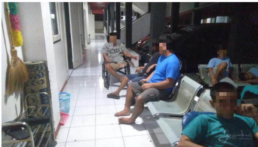
Foto 4. 6 Educational Group

Alasan di balik pemilihan metode intervensi kelompok adalah untuk memberikan dukungan sosial yang diperlukan dalam proses perubahan perilaku, di mana banyak klien cenderung lebih termotivasi ketika mereka memiliki dukungan dari orang lain yang menghadapi masalah serupa. Selain itu, pemahaman tentang faktor-faktor yang menyebabkan perilaku malas dan cara-cara untuk mengatasinya dapat mengatasi masalah dari klien MJ.