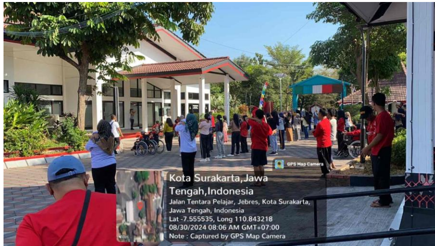
Foto 5. 2 Kegiatan Senam

Praktikan terlibat dalam kegiatan rutin senam pagi yang dilaksanakan rutin setiap hari jumat pukul 08.00 pagi, kegiatan ini dipimpin oleh instruktur senam dengan diiringi lagu.