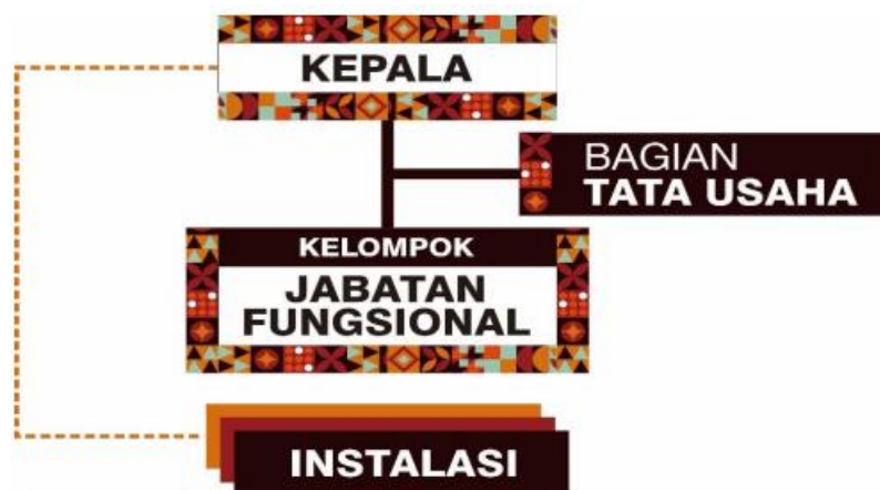
Gambar 3. 1 Struktur Organisasi

Berdasar bagan diatas, berikut ini tugas yang dilaksanakan oleh masing-masing pegawai: