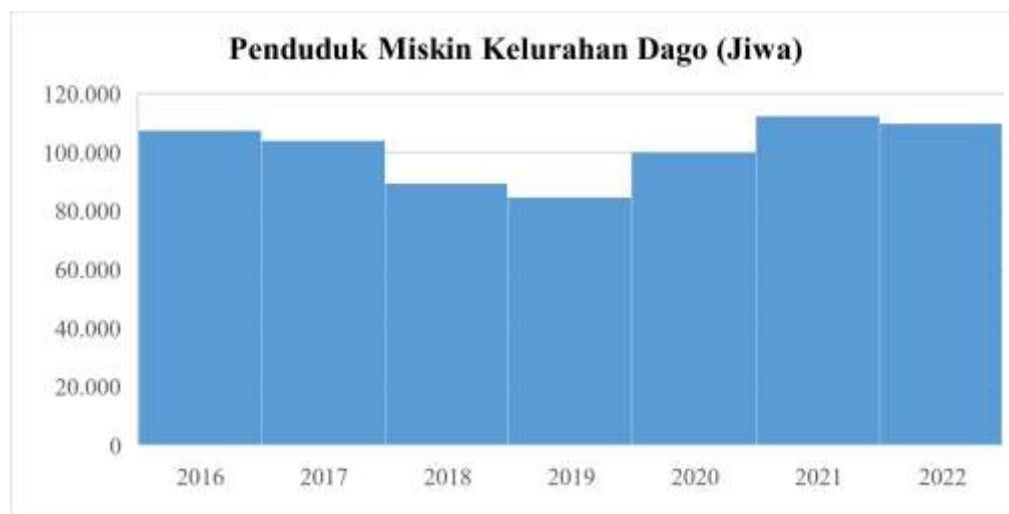
Matriks 1. 1 Jumlah Penduduk Miskin Kelurahan Dago Per 2022

Semenjak diluncurkannya Program Keluarga Harapan (PKH) pada 2007, Pemerintahan Kota Bandung ikut menjalankan Program Keluarga Harapan (PKH) pada 30 Kecamatan di Kota Bandung pada 2013, dengan berlandaskan Peraturan Walikota Bandung Nomor 18 Tahun 2019 tentang Pelaksanaan Verifikasi dan Validasi Warga Miskin Penerima Program Keluarga Harapan dan Bantuan Pangan Non Tunai. Salah satu wilayah Bandung yang melaksanakan Program Keluarga Harapan (PKH) adalah Kelurahan Dago Kecamatan Coblong dengan jumlah penduduk terbanyak yaitu 35.154 jiwa yang terbagi kedalam 105 RT dan 13 RW. Berikut merupakan data sekunder yang peneliti dapatkan terkait tingkat pertumbuhan penduduk di Kelurahan Dago yang setiap tahun mengalami peningkatan yang sangat signifikan.