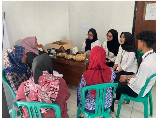
Foto 4. 15 Kegiatan Terminasi