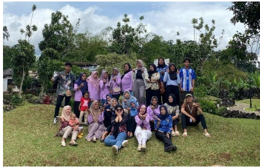
Foto 4. 13 Pelatihan kader posbindu

program ini. Praktikan menutup pelatihan dengan menyampaikan apresiasi kepada semua peserta atas antusiasme dan partisipasi aktif mereka. Kegiatan diakhiri dengan doa bersama dan sesi foto bersama sebagai dokumentasi acara.