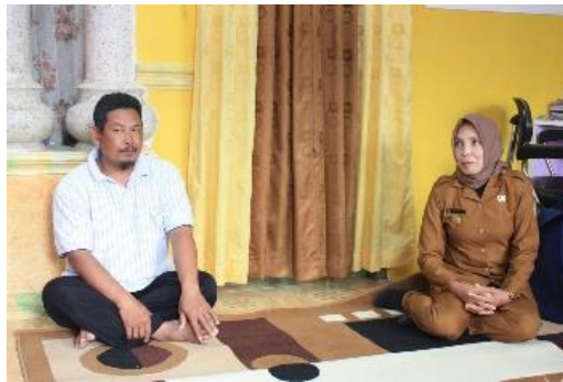
Foto 4. 3 Kunjungan RT dan RW

Praktikan juga melakukan kunjungan ke rumah Ketua RT dan Ketua RW untuk mempererat hubungan dengan pemangku kebijakan lokal. Kunjungan ini bertujuan untuk membangun komunikasi yang lebih baik serta memahami lebih dalam kondisi dan kebutuhan masyarakat di tingkat RT dan RW. Dalam pertemuan tersebut, praktikan memperkenalkan diri dan menjelaskan tujuan serta kegiatan praktikum komunitas yang akan dilaksanakan. Ketua RT dan RW memberikan wawasan tentang isu-isu sosial yang dihadapi oleh masyarakat setempat, serta berbagi informasi mengenai program-program yang sedang berjalan di lingkungan tersebut.