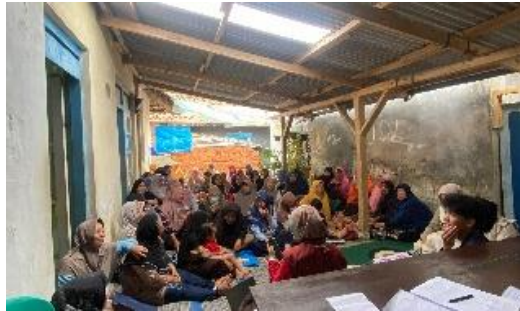
Foto 4. 6 Kegiatan P2K2