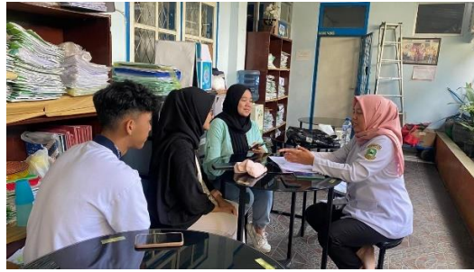
Foto 4. 11 Wawancara dengan bidan desa