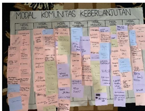
Gambar 4. 2 Hasil SLA