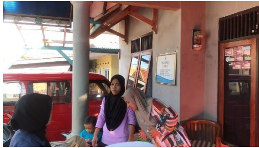
Foto 5. 1 Kegiatan Posyandu Balita