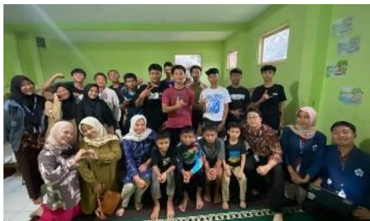
Foto 5. 2 Kegiatan Posyandu Remaja

Beberapa rangkaian kegiatan yang dilakukan meliputi penyuluhan napza, pemeriksaan kesehatan, dan diskusi Interaktif mengenai berbagai permasalahan yang sering dialami oleh remaja, seperti kesehatan mental, tekanan sosial, dan tantangan dalam pendidikan. Diskusi ini bertujuan untuk memberikan solusi serta motivasi bagi remaja untuk menghadapi permasalahan tersebut.