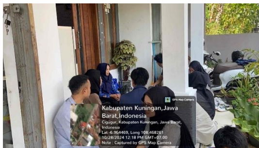
Foto 4. 1 Pertemuan dengan pendamping lapangan