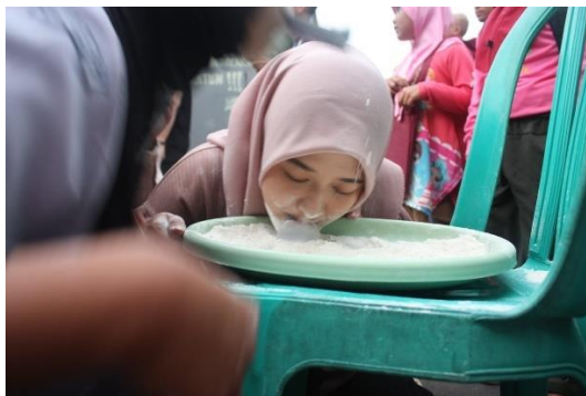
Foto 4. 7 Kegiatan Pesta Rakyat

Praktikan juga turut terlibat aktif dalam kegiatan masyarakat sebagai bagian dari pendekatan komunitas. Keterlibatan ini meliputi partisipasi dalam kegiatan Posyandu di berbagai lingkungan, di mana praktikan membantu dalam pengecekan kesehatan ibu dan anak serta mendukung pelaksanaan program kesehatan masyarakat. Selain itu, praktikan juga mengikuti kegiatan majelis taklim yang menjadi wadah pembinaan spiritual dan sosial, serta turut serta dalam aktivitas olahraga voli bersama ibu-ibu untuk mempererat hubungan dan membangun kerja sama. Selanjutnya, praktikan juga ikut serta dalam kegiatan pesta rakyat yang diselenggarakan di lingkungan Sukamanah, dan ikut dalam setiap kegiatan perlombaan.