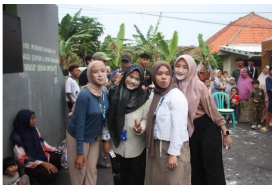
Foto 5. 4 Kegiatan Pesta Rakyat

Kegiatan ini dilaksanakan di lingkungan Sukamanah dan berkolaborasi dengan Djarum Coklat, yang menyelenggarakan berbagai perlombaan untuk memeriahkan acara. Dalam kegiatan ini, praktikan turut berpartisipasi aktif dengan mengikuti perlombaan bersama tim ibu-ibu dari lingkungan Sukamanah, sehingga mempererat hubungan dan menciptakan suasana yang lebih akrab antara praktikan dan masyarakat setempat. Setelah shalat Isya, acara dilanjutkan dengan perlombaan karaoke yang menambah semangat dan keceriaan peserta. Kegiatan ini tidak hanya memberikan hiburan, tetapi juga memperkuat rasa kebersamaan dan interaksi antara warga dan praktikan.