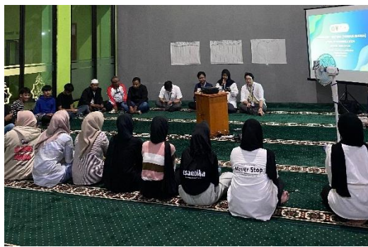
Foto 4. 10 Proses pelaksanaan MPA dan SLA