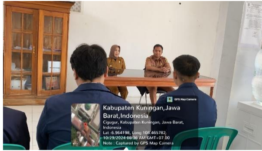
Foto 4. 2 Penerimaan Praktikan di Kelurahan