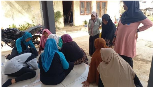
Foto 5. 3 Kegiatan Posbindu

sebagai instruktur senam pada kegiatan senam lansia yang dilakukan sebelum kegiatan cek kesehatan.