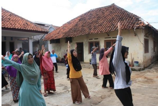
Foto 4. 14 Kegiatan senam lansia