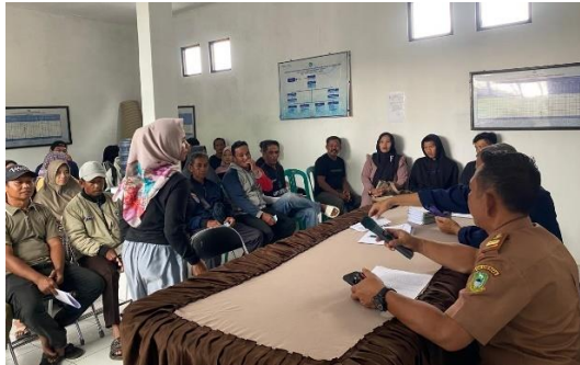
Foto 5. 7 Pembagian Kartu BPJS