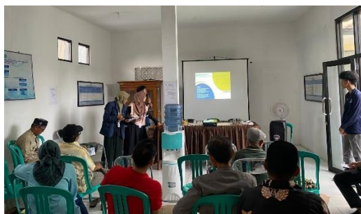
Foto 4. 9 Kegiatan sosialisasi PPKS

Praktikan ikut serta dalam kegiatan forum diskusi pembangunan menara masjid, dan memberikan sosialisasi mengenai PPKS kepada masyarakat. Dalam kegiatan ini, praktikan memperkenalkan maksud dan tujuan praktikum kepada masyarakat, termasuk memberikan penjelasan tentang Penyandang Permasalahan Kesejahteraan Sosial (PPKS) dan Potensi Sumber Kesejahteraan Sosial (PSKS). Dalam kegiatan sosialisasi ini, praktikan membuat pamflet mengenai daftar PPKS dan PSKS (gambar terlampir). Selain itu, praktikan juga memaparkan rencana kegiatan yang akan dilaksanakan selama praktikum dan mengajak masyarakat untuk berpartisipasi aktif dalam program-program tersebut.