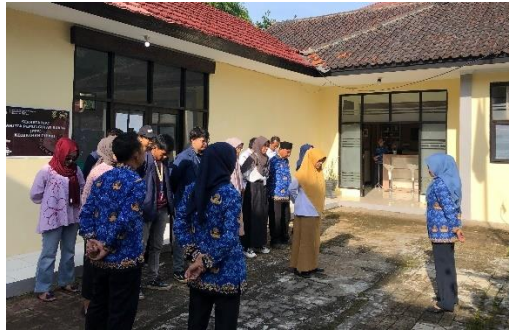
Foto 5. 5 Kegiatan Apel Pagi