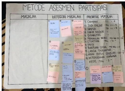
Gambar 4. 1 Hasil MPA