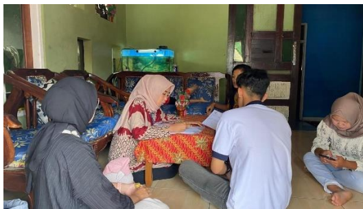
Foto 5. 8 Asesmen data stunting

Praktikan melakukan kunjungan lapangan bersama kader Posyandu untuk melaksanakan home visit ke rumah anak-anak yang menghadapi permasalahan terkait tumbuh kembang. Dalam kegiatan ini, praktikan mengunjungi tiga rumah untuk melakukan asesmen secara langsung kepada orang tua masing-masing anak.