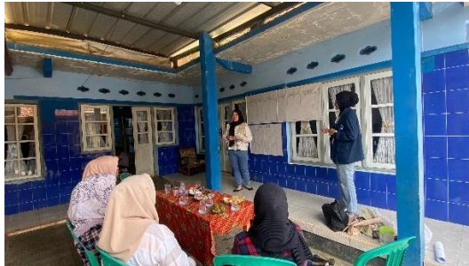
Foto 4. 12 Pelaksanaan ToP

Hati ini menjadi simbol kesepakatan dan dedikasi para peserta untuk bekerja sama dalam mewujudkan tujuan program. Kegiatan diakhiri dengan ucapan terima kasih kepada semua peserta atas partisipasi aktif mereka, disertai dengan doa bersama untuk kelancaran pelaksanaan program.