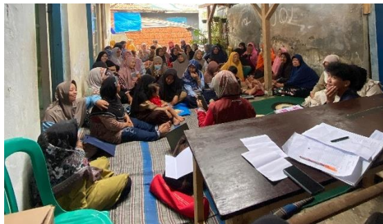
Foto 5. 6 Kegiatan P2K2

Kegiatan ini dilaksanakan sebanyak 2 kali, pertama dilakukan di kelurahan, dan yang kedua dilaksanakan di salah satu rumah warga, di mana keduanya dipimpin oleh pendamping PKH. Dalam kegiatan ini disampaikan mengenai pengasuhan dan pendidikan anak dengan fokus pada pembentukan perilaku positif dan pencegahan perilaku negatif pada anak. selain itu, disampaikan juga mengenai panduan menjadi orang tua yang hebat dengan menekankan pentingnya pemberian pujian dan penghargaan kepada anak.