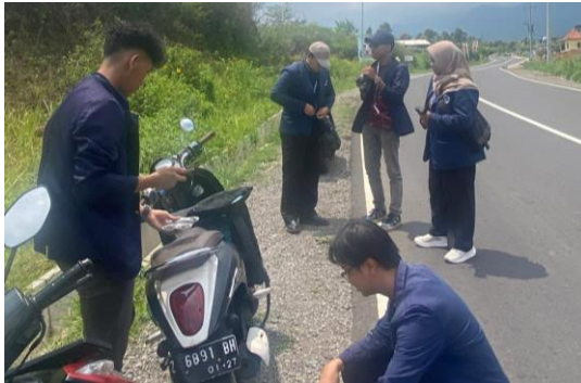
Foto 5. 9 Pengambilan video profil desa