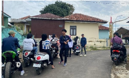
Foto 4. 8 Kegiatan Social Mapping

Cibulakan. Selain itu, praktikan juga melakukan Social mapping sebagai upaya untuk memetakan dinamika sosial dan potensi yang dimiliki masyarakat Cipari.