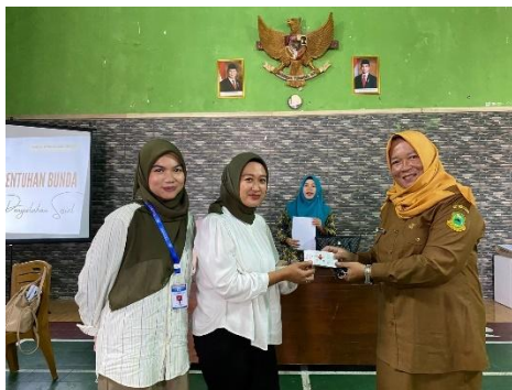
Foto 12 penyerahan TTD ke posyandu

berperan aktif dalam memastikan bahwa remaja putri mendapatkan TTD sesuai jadwal.