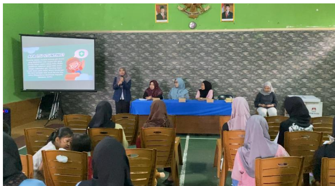
Foto 10 kegiatan edukasi di Balai Desa

disukai. Kehadiran orang tua, kepala desa, dan kader posyandu juga sangat penting dalam memperkuat pesan yang disampaikan dan mendukung remaja putri untuk lebih disiplin dalam mengonsumsi TTD. Di akhir sesi, dilakukan post-test untuk mengukur perubahan pemahaman peserta setelah mengikuti penyuluhan. Post-test ini mencakup pertanyaan yang sama dengan pre-test untuk membandingkan tingkat pengetahuan sebelum dan sesudah sesi edukasi. Hasil post-test menunjukkan bahwa sebagian besar remaja mengalami peningkatan pemahaman, yang menjadi indikator keberhasilan sesi penyadaran ini.