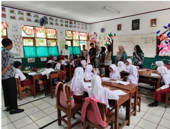
Foto 4 kegiatan observasi di lingkungan sekolah

visit. dari observasi ini praktikan memahami kondisi serta situasi yang terjadi di Desa Haurkuning.