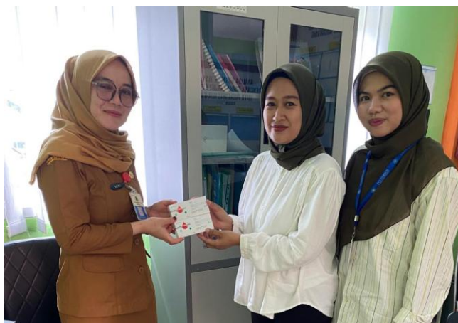
Foto 11 pendampingan kader posyandu

libur sekolah atau kekosongan stok sebelumnya. Praktikan juga mengajak diskusi antara kader posyandu dan pihak puskesmas untuk membangun sistem kerja sama yang berkelanjutan. Hal ini mencakup penjadwalan pengambilan TTD di puskesmas serta pengelolaan stok di posyandu agar tetap tersedia bagi remaja putri secara teratur.