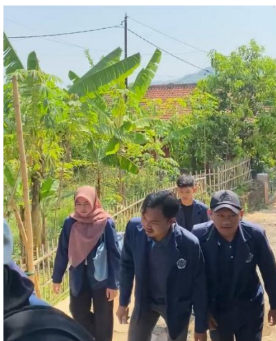
Foto 1 kegiatan transect walk ke dusun wage

Dalam kegiatan ini praktikan berjalan melintasi berbagai wilayah desa khususnya lima dusun (Puhun, Wage, Manis, Pahing, dan Kliwon) seperti jalan utama, lahan pertanian, permukiman warga, fasilitas umum, serta potensi yang ada di masing-masing dusun tersebut. Teknik ini dilakukan untuk mengenal karakteristik fisik dan sosial desa secara langsung, sekaligus menciptakan interaksi awal dengan warga yang dijumpai di sepanjang perjalanan.