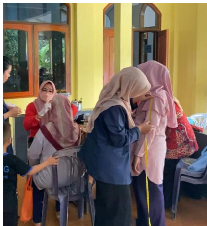
Foto 5 kegiatan posyandu di Dusun Manis

Praktikan aktif terlibat dalam kegiatan komunitas, seperti pertemuan warga, acara keagamaan, kegiatan posyandu, serta interaksi sehari-hari lainnya. Teknik ini bertujuan untuk menciptakan kepercayaan dan membangun hubungan emosional dengan masyarakat.