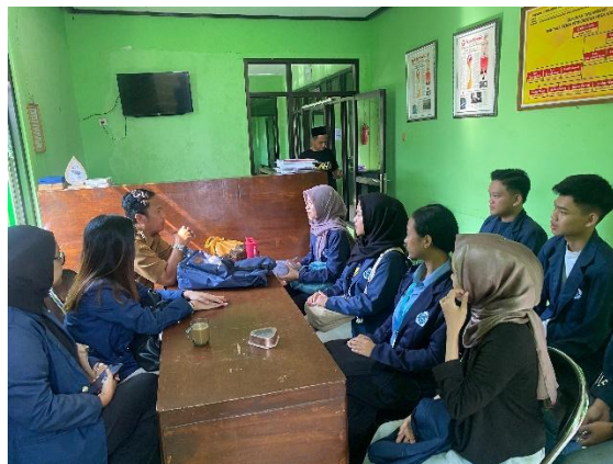
Foto 3 kegiatan wawancara dengan kepala Desa Haurkuning

Dilakukan dalam bentuk terstruktur dan tidak terstruktur, wawancara ini bertujuan memperoleh informasi mendalam mengenai potensi lokal, kebutuhan komunitas, serta pandangan masyarakat terhadap berbagai isu sosial dan ekonomi.