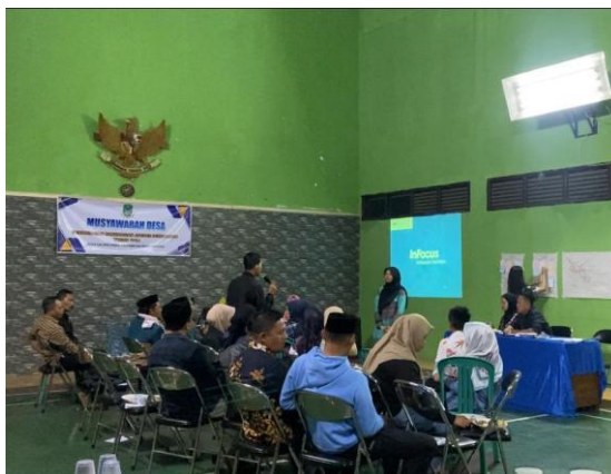
Foto 6 kegiatan community meeting di Balai Desa Haurkuning

langkah-langkah yang dapat diambil ke depan. Selain itu juga praktikan memebrikan kesempatan kepada warga yang telah hadir di balai desa untuk dapat berdiskusi mengenai PPKS dan PSKS yang ada di sekitar rumah mereka masing-masing. Hal ini membuat mereka semakin peka dengan keadaan lingkungan sekitar mereka, dan melatih kepedulian warga antara warga lainnya.