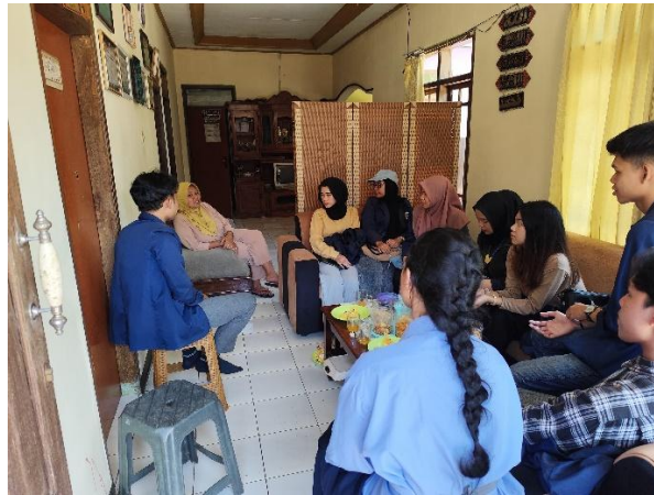
Foto 2 kegiatan home visit ke rumah warga

kehidupan sehari-hari, permasalahan yang dihadapi, serta harapan masyarakat terhadap perubahan yang diinginkan.