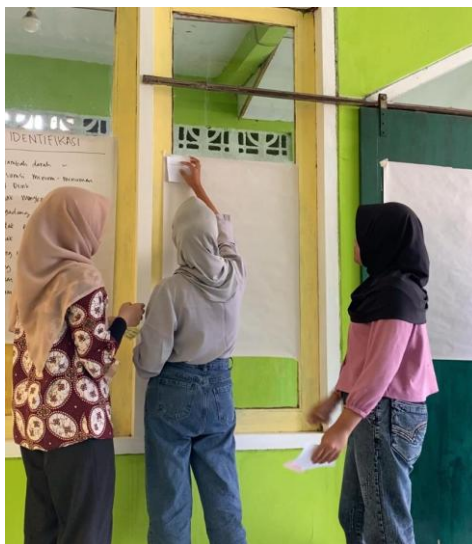
Foto 8 kegiatan MPA di Musholla Al Ikhsan

Setelah melakukan identifikasi perilaku remaja putri Dusun Puhun yang akan berisiko melahirkan anak stunting, praktikan memetakan masalah tersebut kedalam kelompok yang diberi judul untuk dilakukannya tahapan selanjutnya.