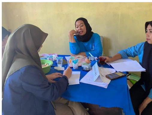
Foto 7 wawancara dengan kader posyandu