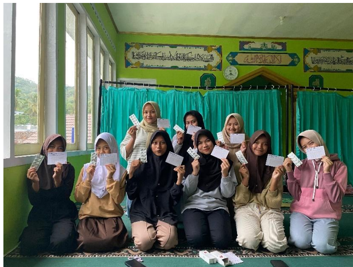
Foto 15 bersama dengan remaja putri Dusun Puhun

mereka hadapi, serta mencari solusi bersama untuk meningkatkan keberhasilan program ke depannya.