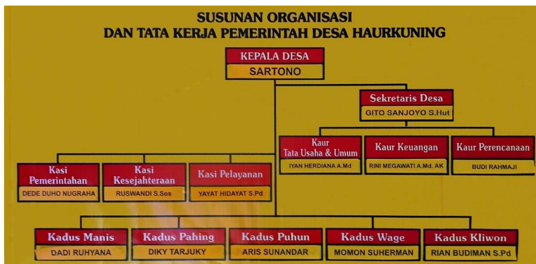
Gambar 2 Struktur Organisasi Desa Haurkuning

Kepala Desa Haurkuning bernama Sartono yang telah dilantik pada tahun 2023. Beliau memiliki latar belakang profesi TNI sebelum menjabat sebagai kepala desa Haurkuning. Terdapat 13 (tiga belas) jajaran pada susunan organisasi dan tata kerja pemerintah desa Haurkuning yang memiliki tugas dan kewajiban masing-masing sesuai dengan jabatannya.