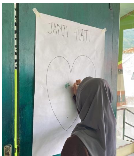
Foto 9 kegiatan TOP dalam penandatanganan janji hati

Setelah mengidentifikasi prioritas masalah, yaitu rendahnya konsumsi Tablet Tambah Darah (TTD) pada remaja putri, praktikan melanjutkan ke tahap penyusunan rencana intervensi dengan menggunakan pendekatan Technology of Participation (TOP) yang dilaksanakan pada tanggal 17 November 2024 bersamaan dengan proses MPA. Pendekatan ini mengedepankan partisipasi aktif dari masyarakat, dengan melibatkan mereka dalam setiap kegiatan dan rancangan program yang akan dilaksanakan. Sama seperti tahapan lainnya teknik yang digunakan yaitu community meeting bersama dengan target group dan interest group . Pada penyusunan rencana intervensi respon dari para undangan sangat baik dan kooperatif dalam setiap proses yang dijalankan, mulai dari penyusunan program sampai pada komitmen untuk melakukan program tersebut.