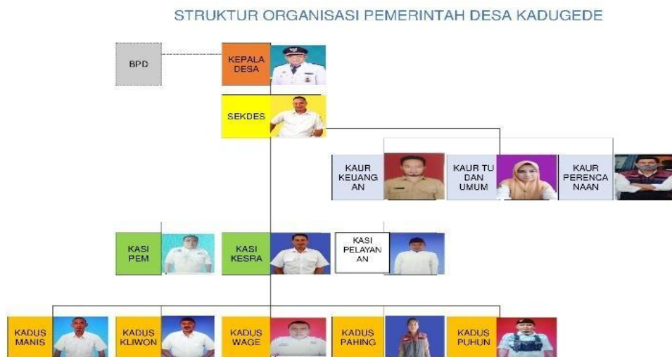
Gambar 3. 1 Struktur Organisasi