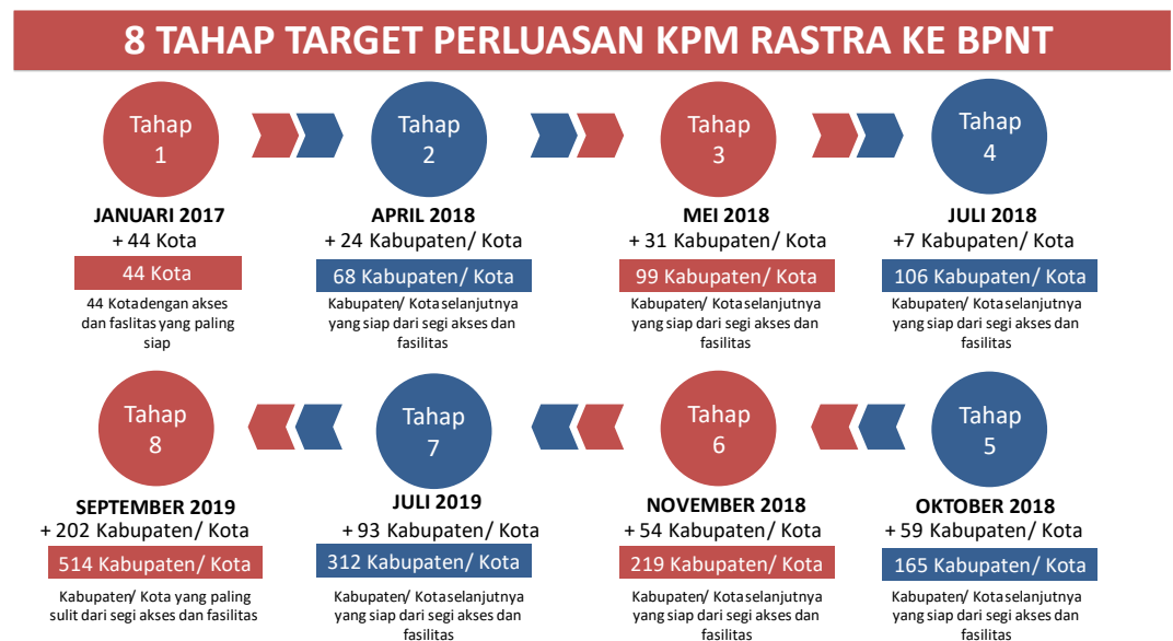
Gambar 2. 2 Tahap Target Perluasan KPM

Gambar 2.1 menunjukkan transformasi bagaimana transformasi sejarah Program bantuan dari tahun 2016 hingga 2019 dalam rangka peningkatan efektivitas dalam penyaluran bantuan sosial. Selain itu, program ini memperluas jenis komoditas yang dapat dibeli ini sebagai upaya dari Pemerintah untuk memberikan akses KPM terhadap bahan pokok dengan kandungan gizi lainnya. Di sisi lain, pengembangan jenis bahan pangan yang didapatkan dari program ini akan mampu meningkatkan nutrisi/gizi masyarakat, terutama anak-anak sejak dini sehingga akan memiliki pengaruh terhadap penurunan stunting .