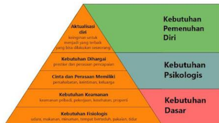
Gambar 2. 1 Hirarki Kebutuhan Maslow

Abraham Maslow (1989) dalam teori hierarki atau jenjang kebutuhan mengajukan bahwa semua orang memiliki kebutuhan-kebutuhan dasar yang harus terpuaskan terlebih dahulu sebelum mereka menyadari kebutuhan-kebutuhan lain yang lebih tinggi tingkatannya.