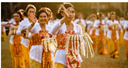
Gambar 2.4 Referensi modal sosial

Adi (2013) menjelaskan bahwa modal sosial merupakan tata cara yang untuk mengikat seperti norma, etika, dan aturan dalam kehidupan masyarakat serta mengatur pola perilaku warga, kepercayaan, dan jaringan antar warga masyarakat ataupun kelompok masyarakat.