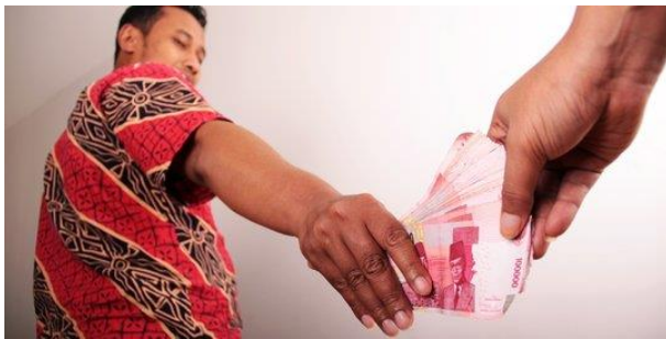
Gambar 2.5 Referensi modal finansial

Modal finansial merupakan salah satu modal yang sering diperhitungkan dalam menentukan suatu program untuk meningkatkan kesejahteraan masyarakat. Hal ini karena jenis modal ini berkaitan dengan keuangan yang dimiliki oleh masyarakat tersebut. Adi (2013) mengatakan bahwa modal finansial adalah dukungan keuangan yang dimiliki suatu masyarakat yang dapat digunakan untuk membiayai proses pembangunan yang diadakan dalam masyarakat berupa sumber keuangan yang dimiliki seperti tabungan, kredit dan sebagainya yang dapat digunakan oleh masyarakat.