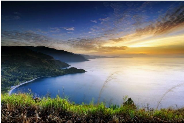
Gambar 2.1. Referensi modal alam