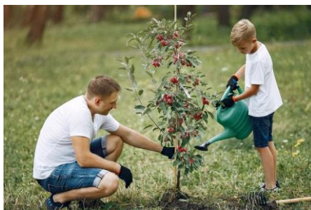
Gambar 2.3 Referensi modal manusia

masyarakat dalam perkembangan suatu daerah. Green dan Haines (dalam Adi, 2015) berpendapat bahwa modal manusia adalah kemampuan serta keterampilan yang dimiliki manusia yang berpengaruh terhadap produktivitas mereka. Hal ini untuk melihat kualitas modal manusia dengan melihat cara penguasaan teknologi yang bermanfaat bagi masyarakat, baik itu teknologi yang sederhana maupun teknologi yang canggih.