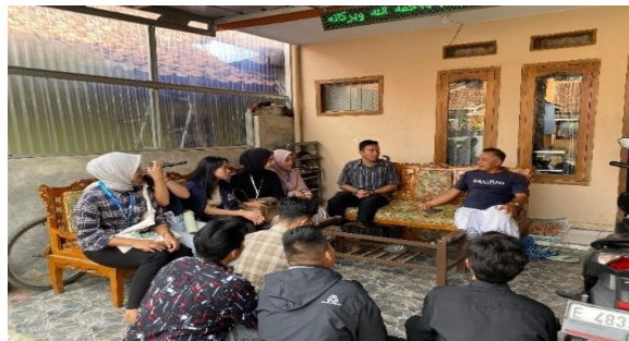
Foto 4 2 Home Visit