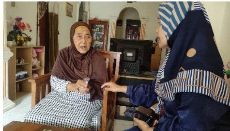
Foto 4 13 Home Visit Lansia Kedua