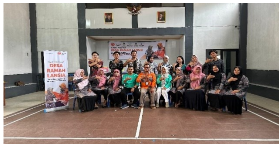
Foto 4 11 Sosialisasi

Proses sosialisasi program SALING berlangsung pada tanggal 16 November 2024 di Posbindu yang diadakan oleh desa. Kegiatan ini dimulai dengan pembukaan oleh perangkat desa yang memberikan pengantar singkat tentang tujuan kegiatan. Selanjutnya, praktikan menjelaskan secara detail mengenai latar belakang, tujuan, dan manfaat program SALING kepada masyarakat yang hadir, termasuk lansia, keluarga mereka, dan anggota masyarakat lainnya.