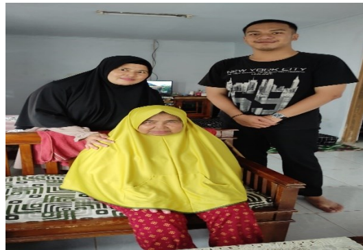
Foto 4 12 Home Visit Lansia Pertama