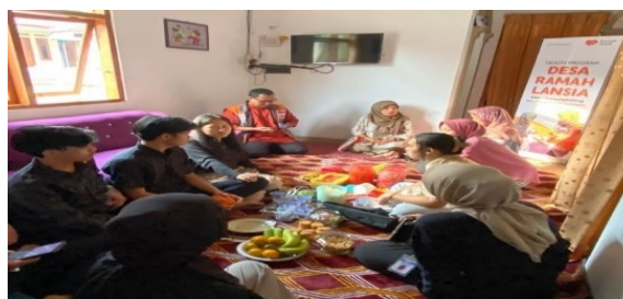
Foto 4 10 Penyuluhan