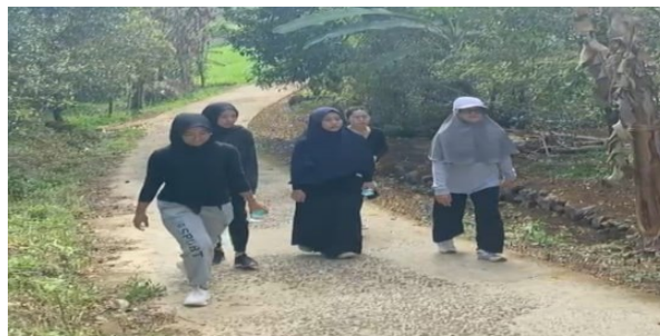
Foto 4 3 Transect Walk

Pada kegiatan Transect Walk di tahap dialog, praktikan melakukan transect walk yaitu menelusuri wilayah desa Gunungkeling secara langsung bersama para mahasiswa praktikan yang lain berjumlah 12 Orang. Tujuan transect walk ini bertujuan untuk mengamati, mengenali, serta mengetahui potensi dan system sumber serta mengetahui kondisi geografis wilayah masyarakat desa Gunungkeling.