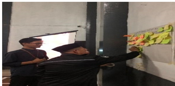
Foto 4 7 exploring resource system

Dalam kegiatan penggalian sumber daya, praktikan melakukan asesmen partisipatif dengan menggunakan tools Methode Participatory Assessment (MPA) pada tanggal 08 November 2024 dengan dihadiri oleh perwakilan dari Masyarakat yaitu Kepala Desa, Kepala dusun, RT dan RW setempat, Kader PKK, Perwakilan Perempuan, perwakilan pemuda, perwakilan lansia, Perangkat desa dan Tokoh tokoh Masyarakat. Tujuan dari MPA adalah untuk mendapatkan informasi terkait dengan 45 permasalahan,