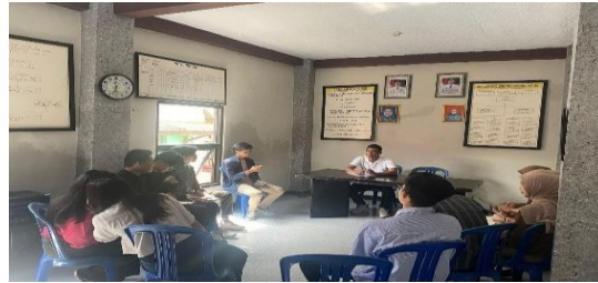
Foto 4 1 Penerimaan Praktikan

Penerimaan mahasiswa praktikan dari Politeknik Kesejahteraan Sosial Bandung untuk kegiatan Praktikum Komunitas 2024 di Kabupaten Kuningan dilakukan di Pendopo Bupati Kuningan oleh PJ Bupati pada tanggal 28 Oktober 2024. Setelah itu, praktikan melaksanakan penerimaan di Kecamatan Cigugur yang dihadiri oleh perwakilan mahasiswa. Selanjutnya, penerimaan di Desa Gunungkeling dilaksanakan di Kantor Desa Gunungkeling pada tanggal 29 Oktober 2024, dihadiri oleh 11 mahasiswa praktikan dan perangkat Desa Gunungkeling. Dalam proses penerimaan ini, praktikan menyampaikan maksud dan tujuan melaksanakan praktikum komunitas di Desa Gunungkeling, serta menjelaskan timeline kegiatan dan tahapan yang akan dilaksanakan selama 40 hari ke depan.